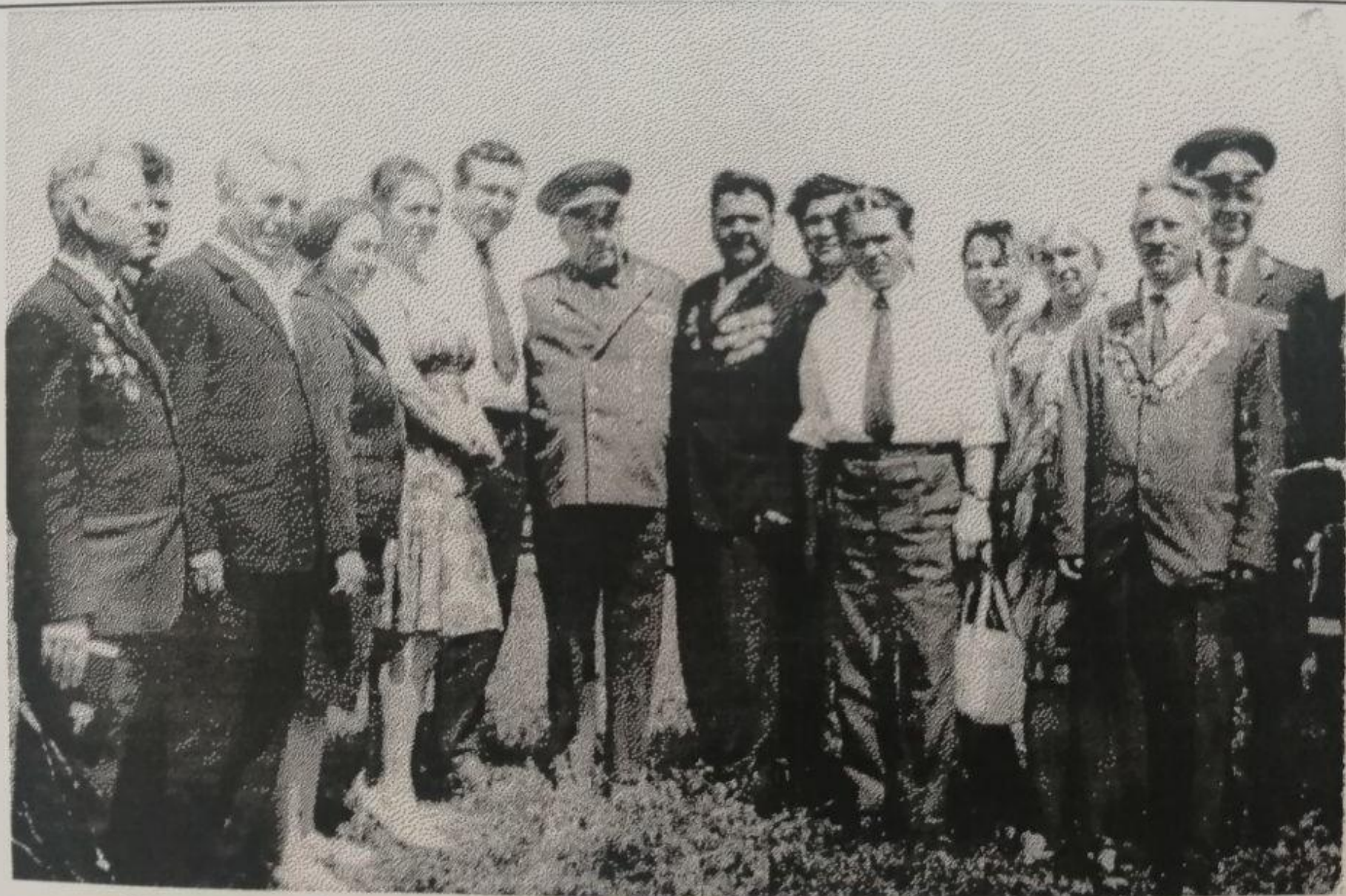
Встреча фронтовиков через 40 лет после Победы.