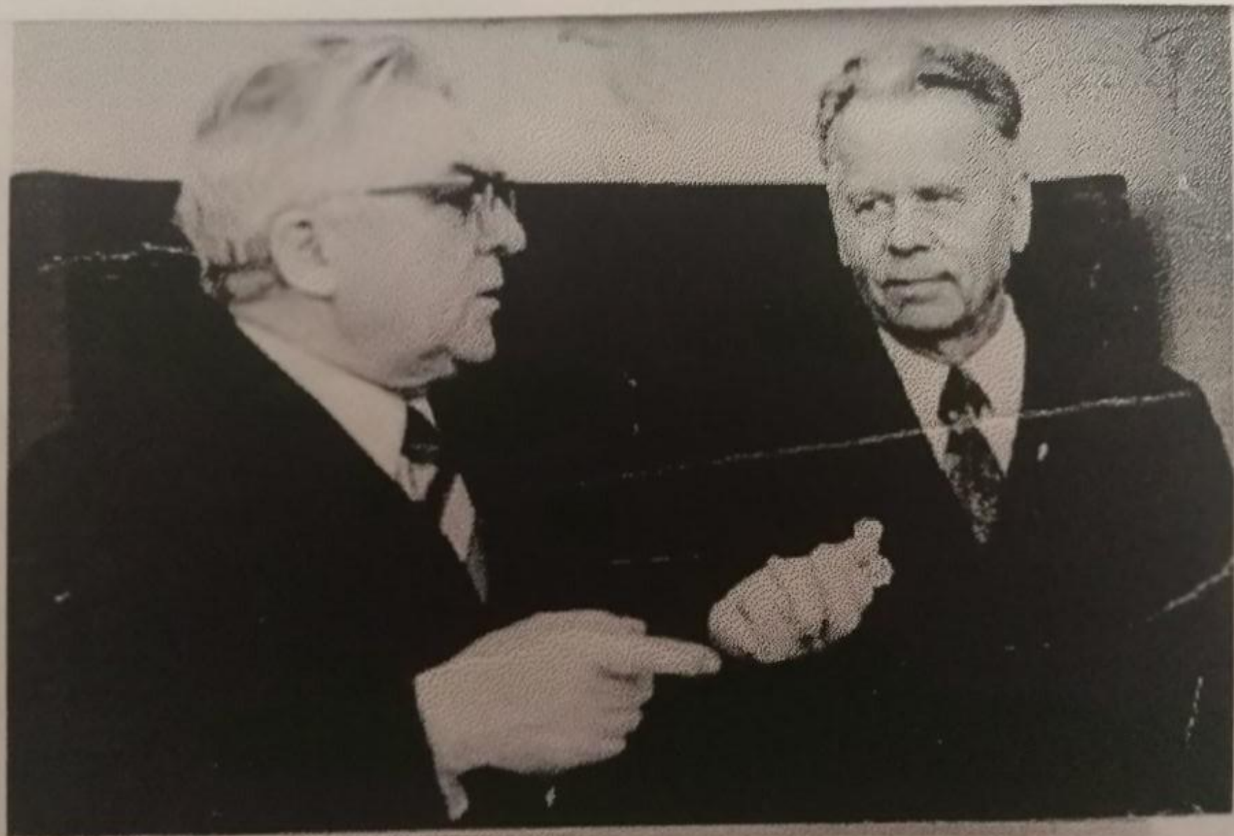
Фотокор А. Космаков - вместе мы начинали.