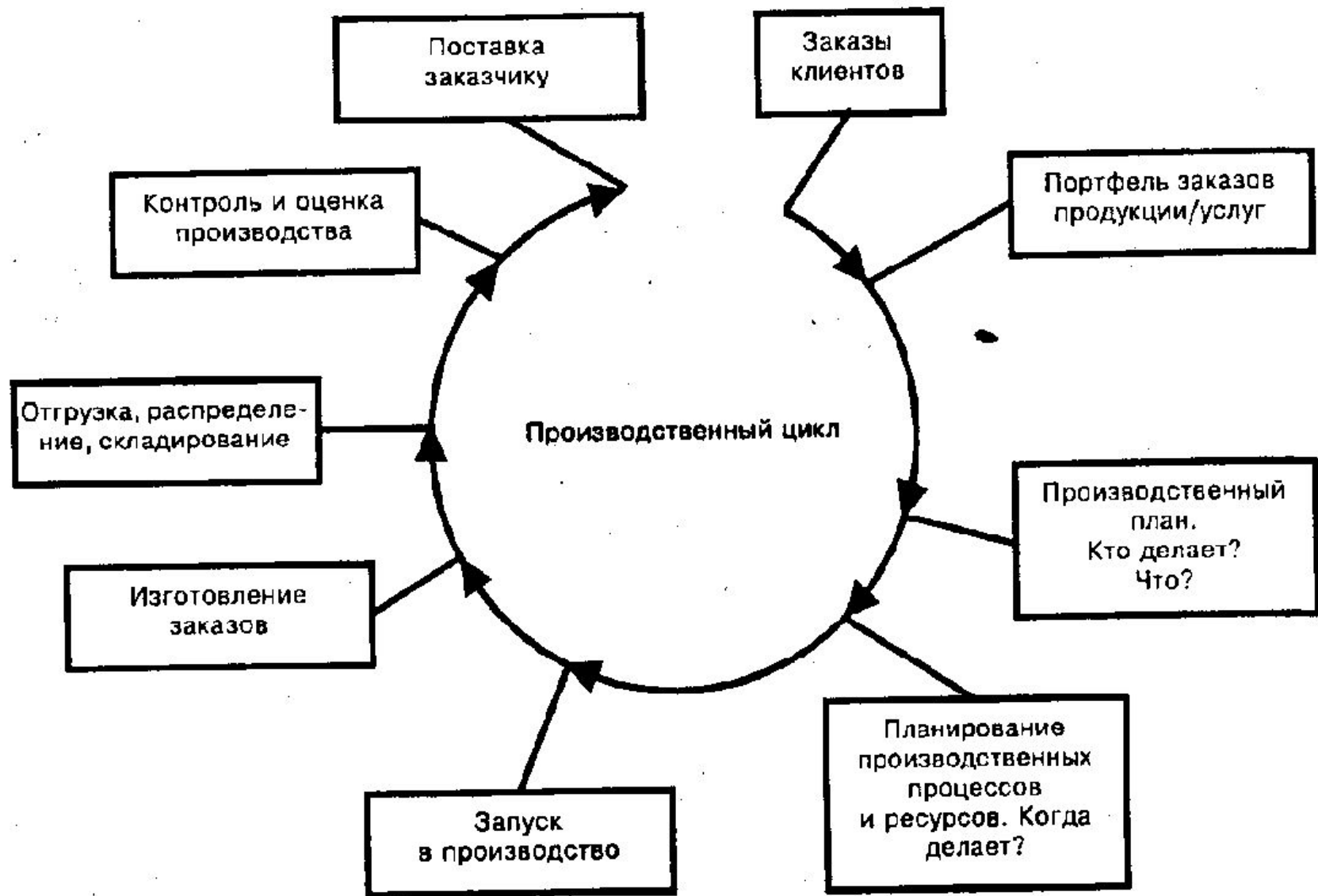
Рис. 5.1. Структурные составляющие производственного цикла