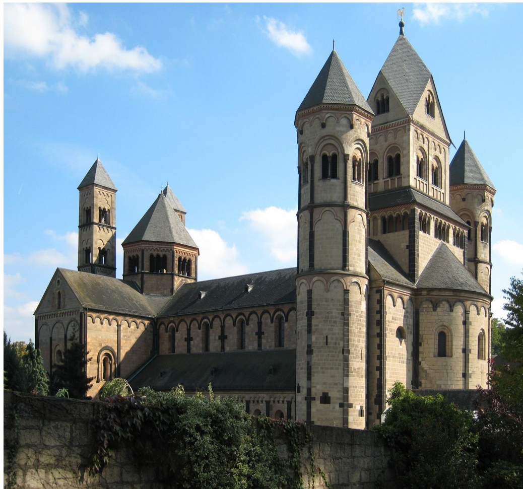
Аббатство Мария Лаах, Германия

- Постройки этого периода отличались суровой простотой, ясностью объемов, внушительностью, тяжеловесностью, монолитностью, замкнутостью, отсутствием обильных украшений.