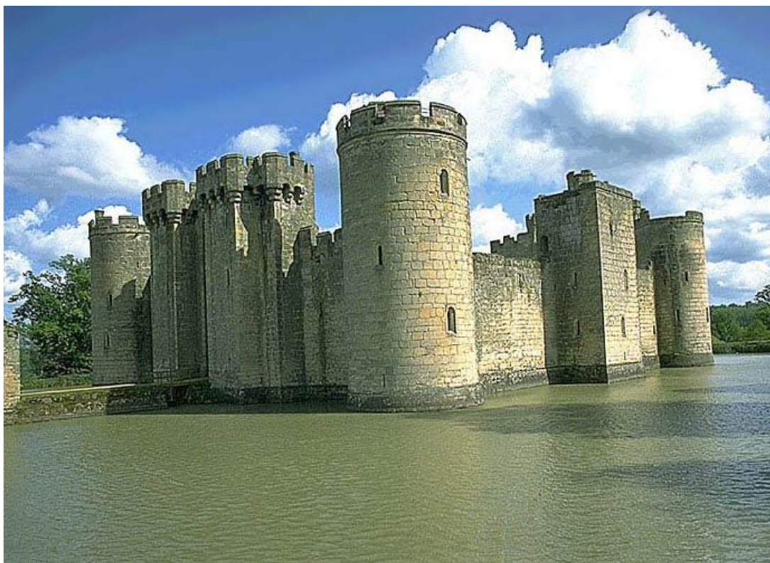
Норманнская крепость, Франция

Романский стиль (от лат. romanus — римский) — художественный стиль, господствовавший в Западной Европе (а также затронувший некоторые страны Восточной Европы) в XI—XII веках (в ряде мест — и в XIII в.), один из важнейших этапов развития средневекового европейского искусства. Наиболее полно выразился в архитектуре.