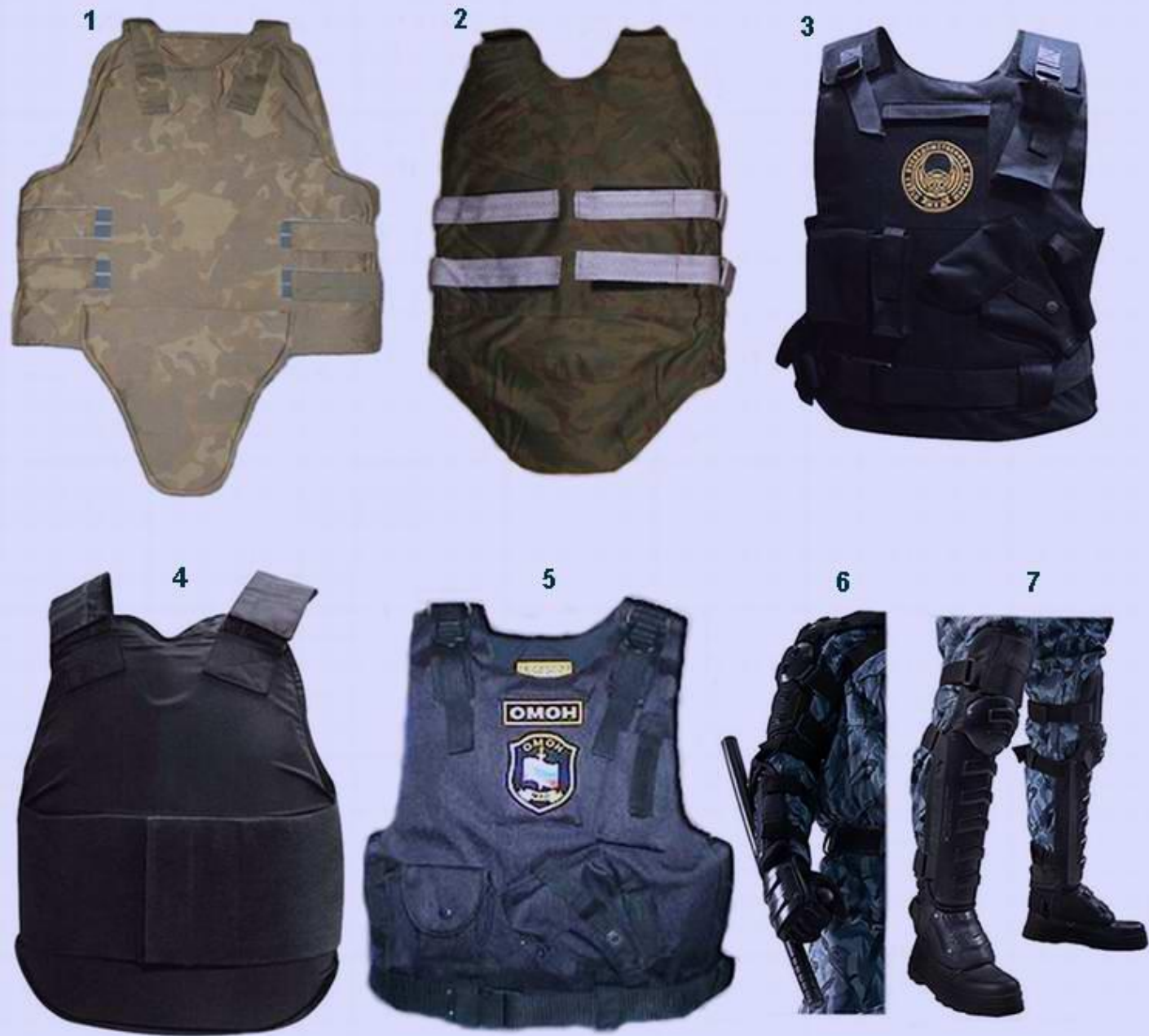
1. Бронежилет Кора-1 2. Бронежилет Кора-2 3. Бронежилет Кора-1МК