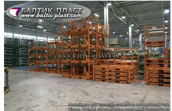
Контейнера для кузовных элементов автомобилей Ford, Nissan, Hyundai, изготовленные компанией Балтик-Пласт

Предприятие проектирует и производит различные металлоконструкции, предлагает клиентам готовое решение и именно в этом заключается его особенность.