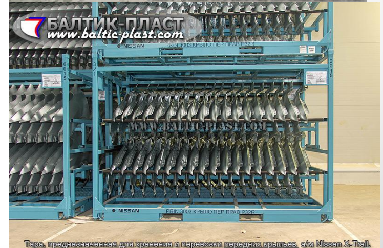
Тара, предназначенная для хранения и перевозки передних крыльев, а/м Nissan X-Trail.