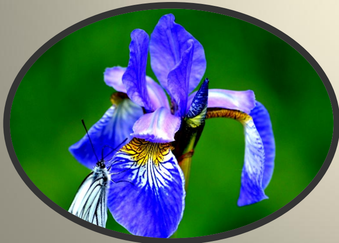
Касатик (Ирис) сибирский Iris sibirica L