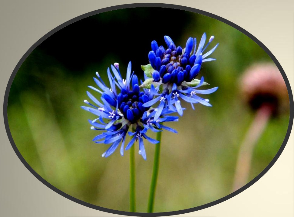
Jasione L. – Букашник

Этимология научного названия рода не имеет однозначного толкования. Большинство считает, что родовое наименование - от греческого «nasis» (лечение). Другие утверждают, что от латинского «iasione» - названия какого-то растения с белыми цветками у Плиния.