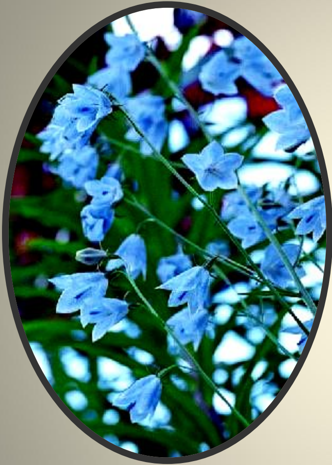
Adenophora Fisch. – Бубенчик

Происходит от греческого слова «aden», «adenos» - «железа» и «phorys» - «несущий».