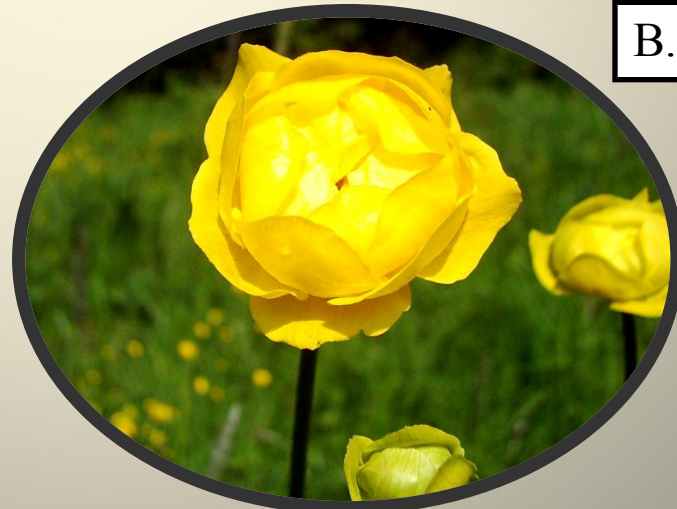
Купальница европейская Trollius europaeus L