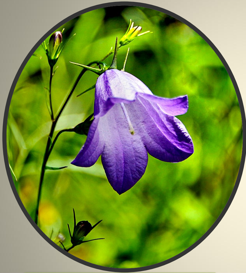
Campanula L. – Колокольчик

Латинское название рода – уменьшительное к позднелатинскому (и итальянскому) «campana» (колокол): по форме венчика.