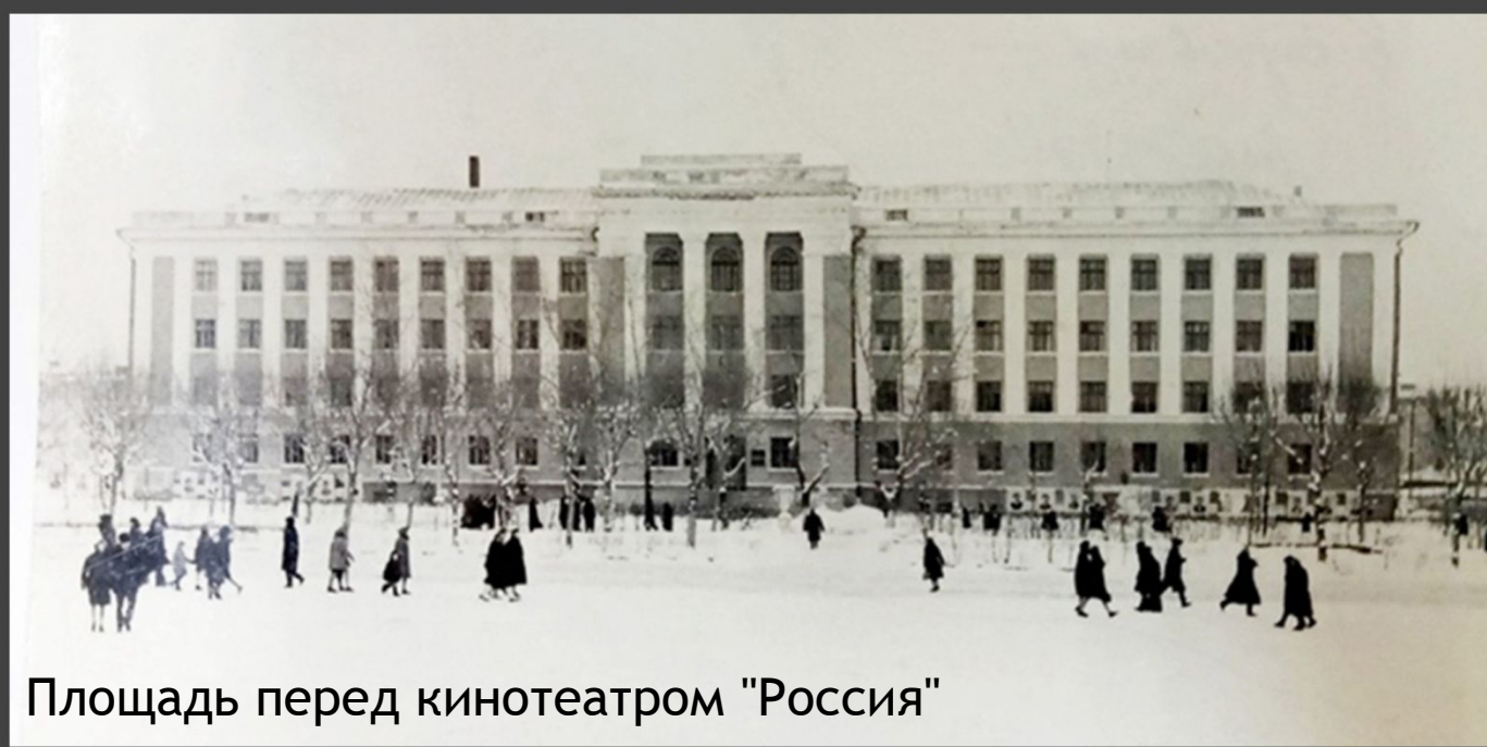
Площадь перед кинотеатром "Россия"

На историческом снимке 1964 года здание УООП ещё не обнесено забором. Нет автобусной остановки и фонтана