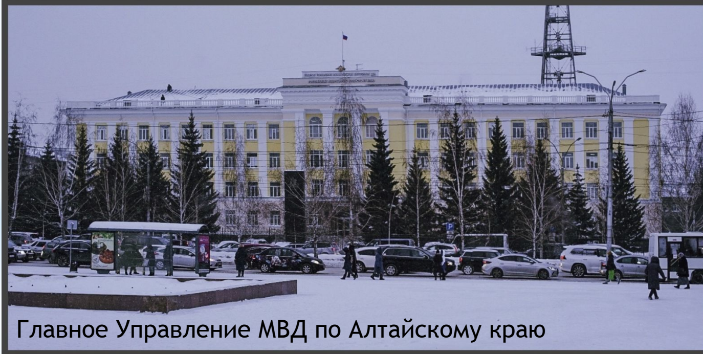
Главное Управление МВД по Алтайскому краю