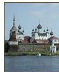
Культурное наследие и современность