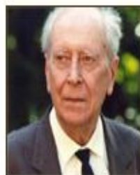
Наследие Д. С. Лихачева