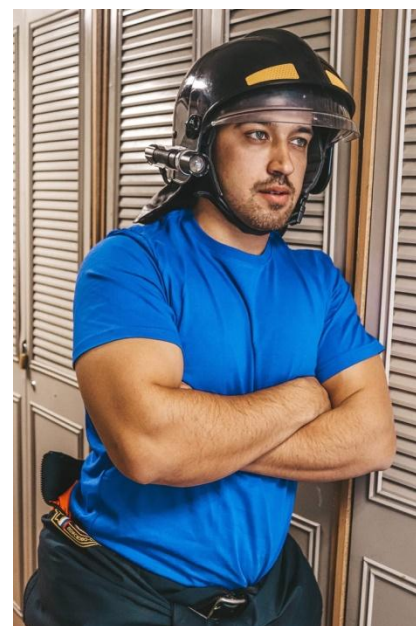
Старший инструктор ЦСП «Акваспас»