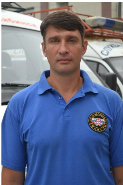
Руководитель сезонного отряда спасателей на воде