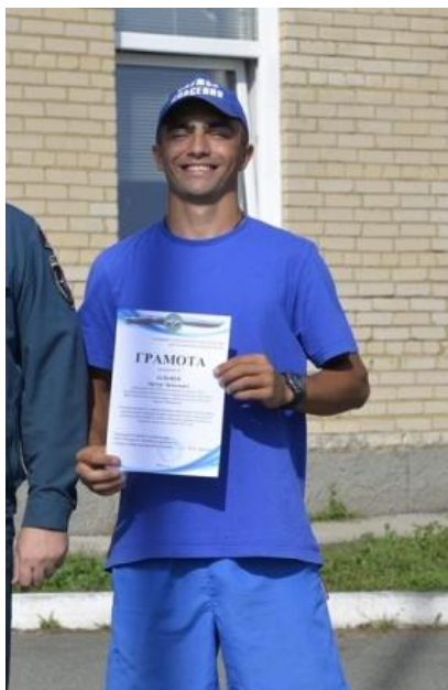
Командир ССО «Акваспас-ЧелПК»