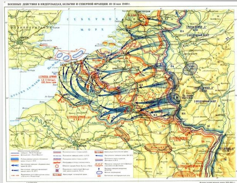
Карта военных действий-1940 год

□ 10 мая 1940года Немецкие войска вторгаются в Нидерланды, Бельгию и Люксембург (операции завершаются 14 мая) - реализуется план "Гельб" .