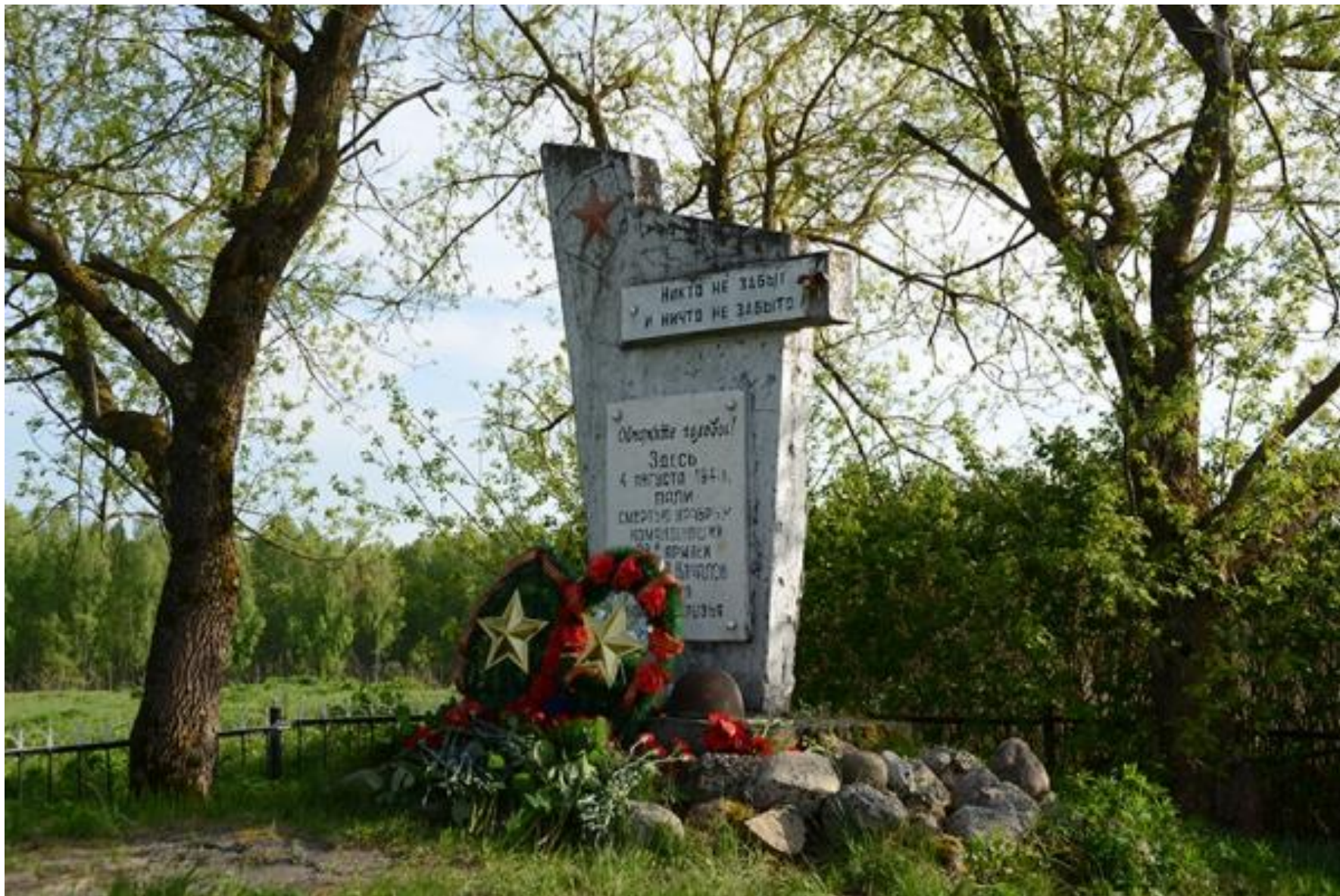
Памятный знак у деревни Старинка, где первоначально был похоронен генерал В.Я.Качалов