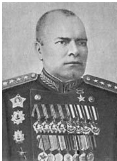
И. И. Масленников