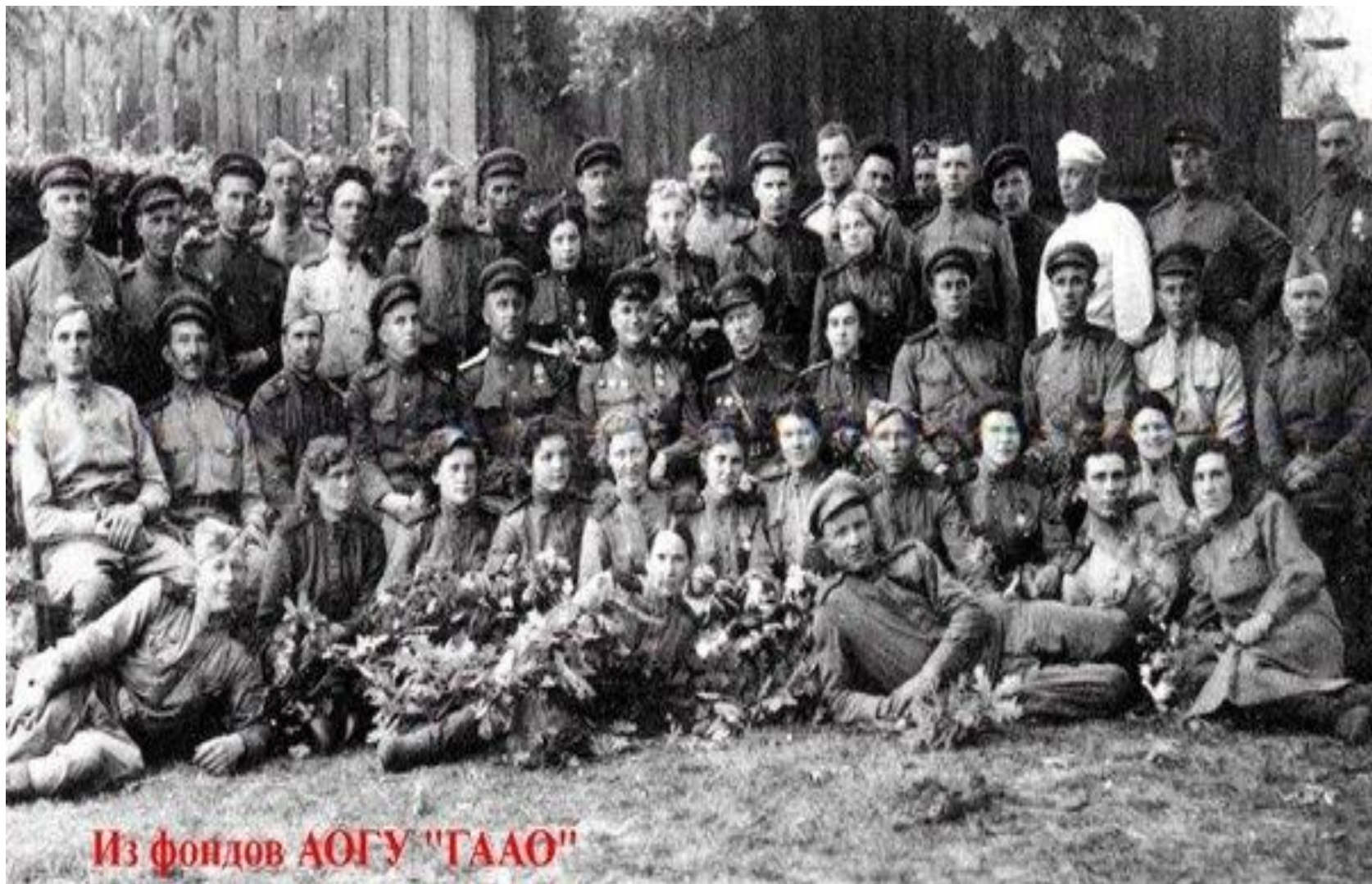
28 –я армия под командованием В. Я. Качалова.