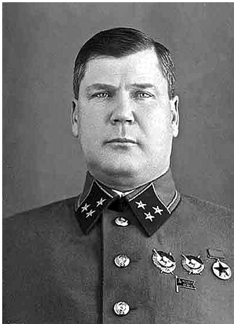
Генерал – лейтенант Владимир Яковлевич Качалов.