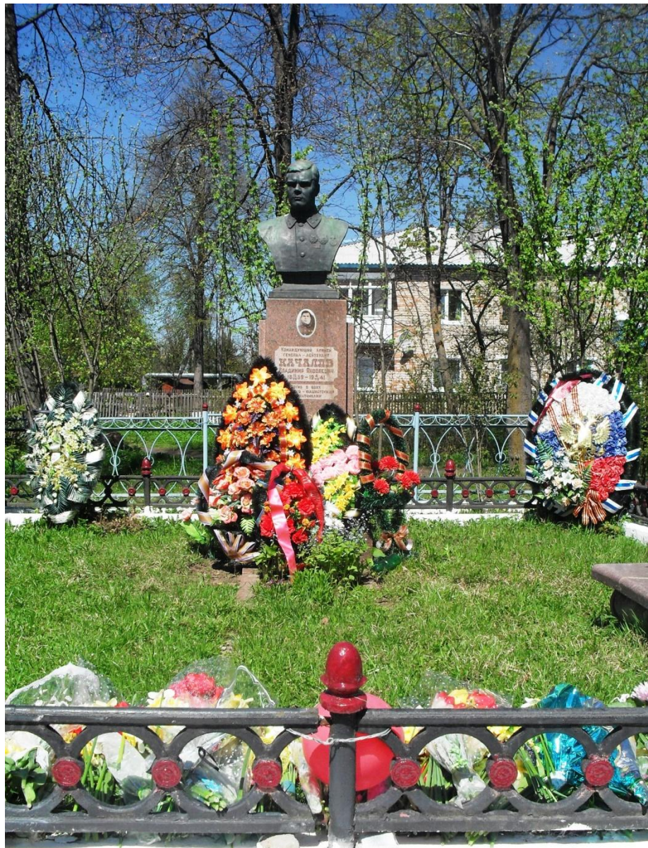
Место захоронения генерала В.Я.Качалова. Поселок Стодолище.