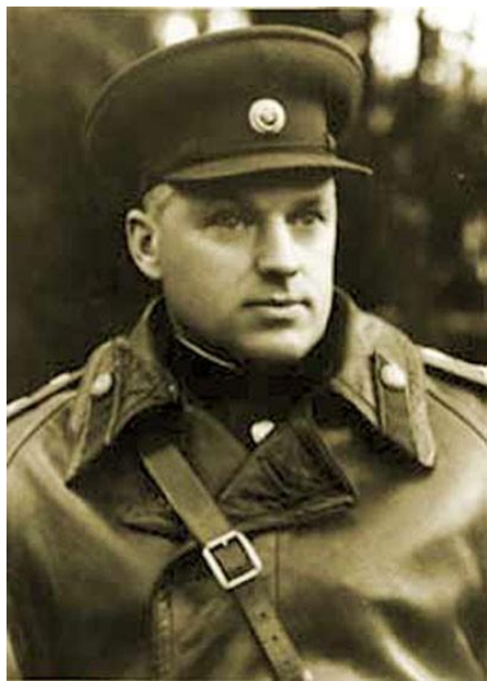
К. К. Рокоссовский