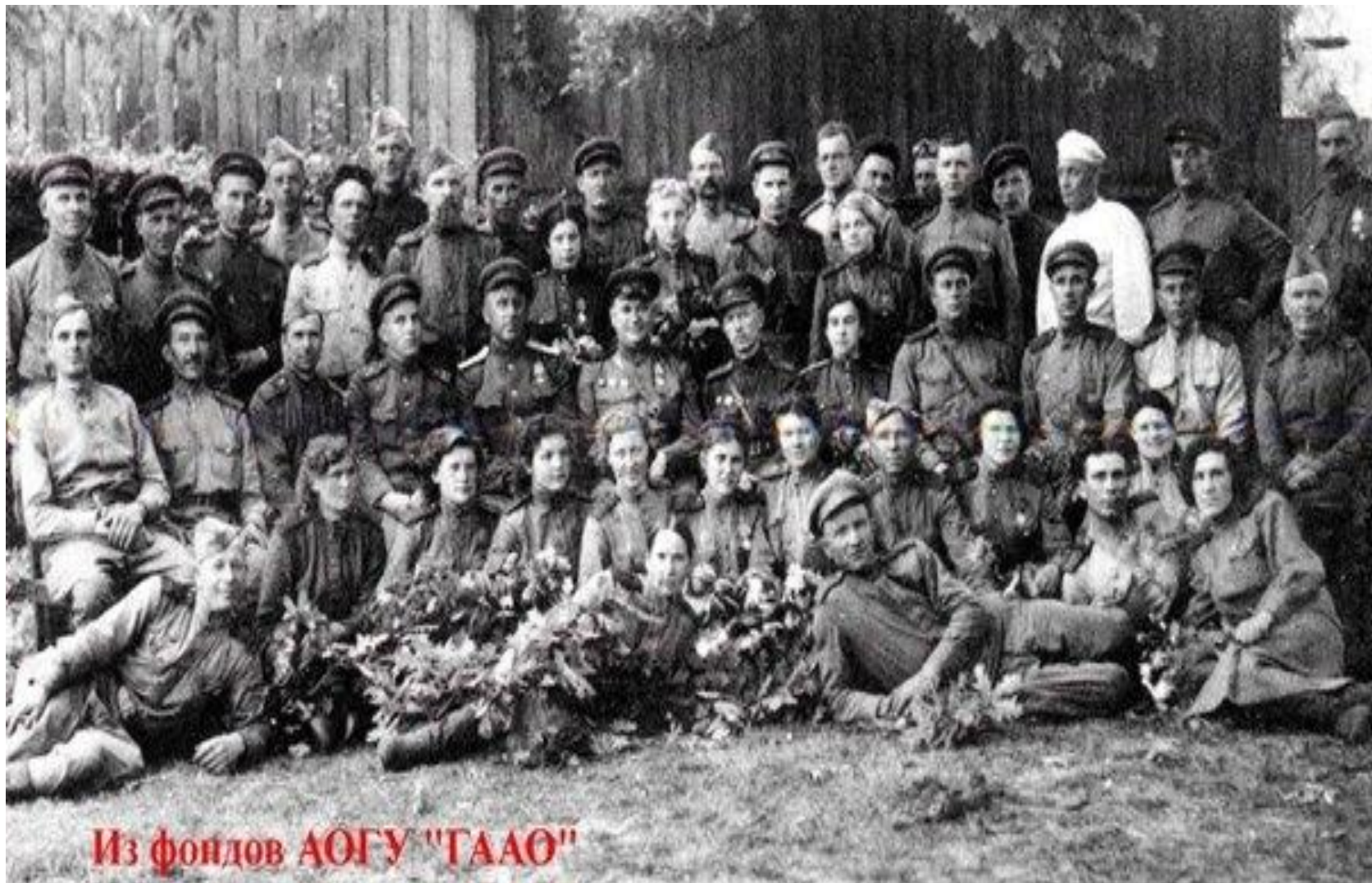
28 –я армия под командованием В. Я. Качалова.