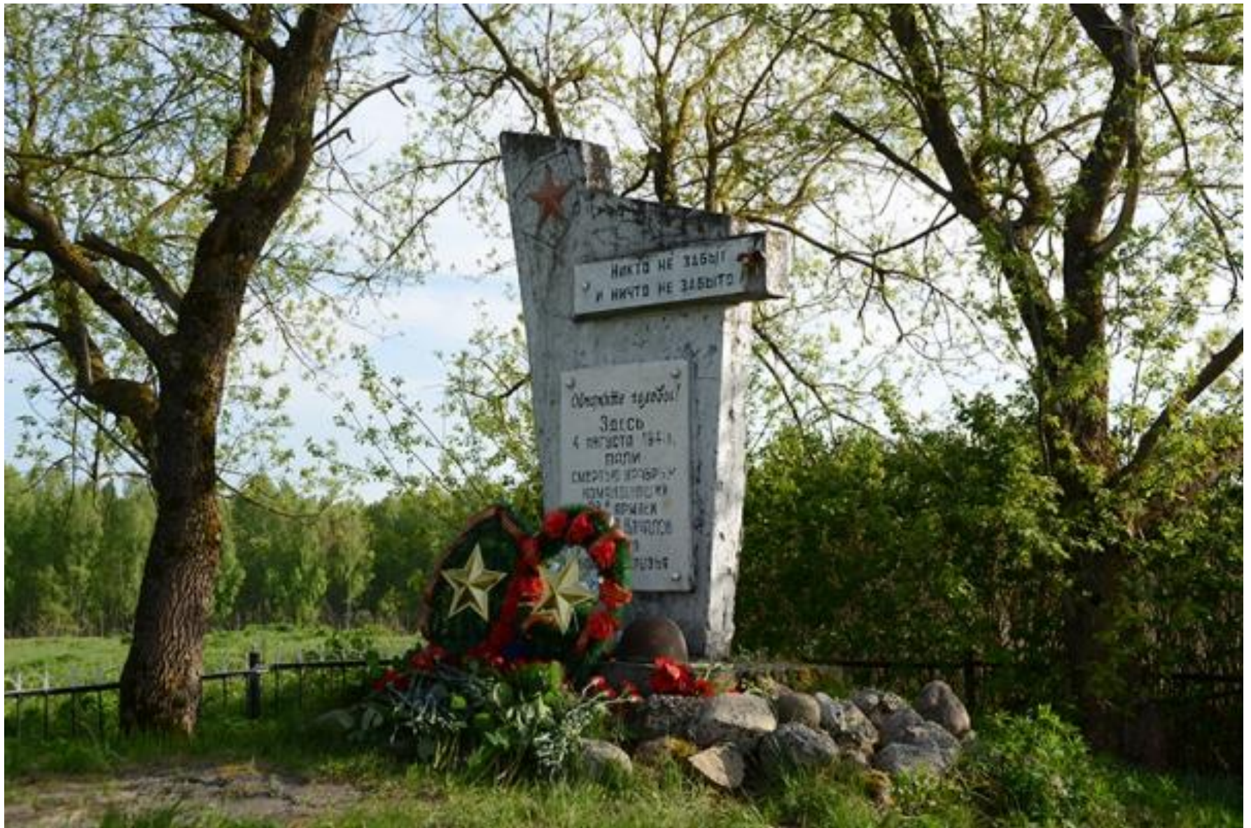
Памятный знак у деревни Старинка, где первоначально был похоронен генерал В.Я.Качалов