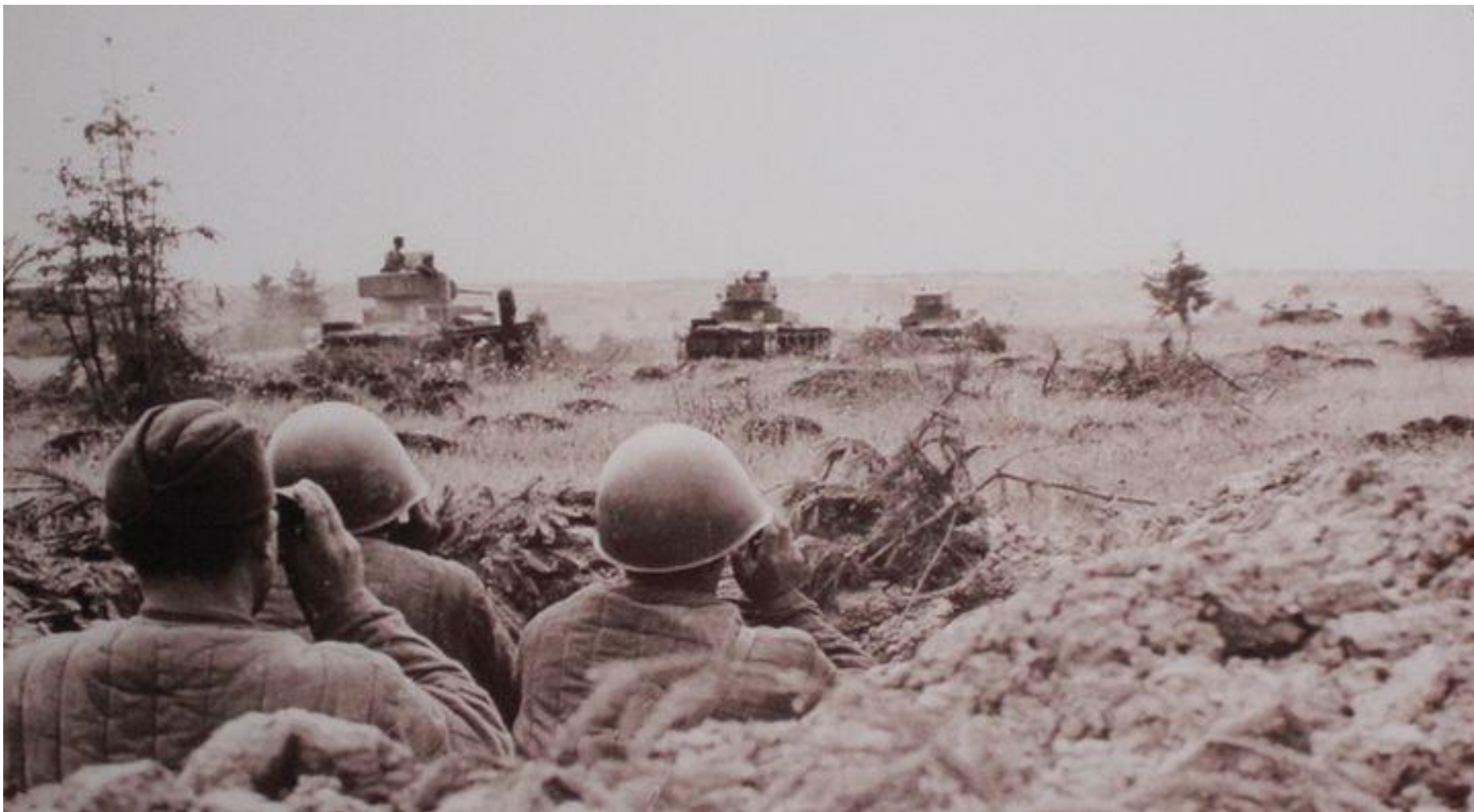
Смоленское сражение июль 1941 год.