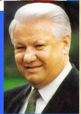
Ельцин Борис Николаевич 1931 -2007