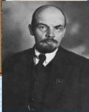
Ленин Владимир Ильич 1870 - 1924