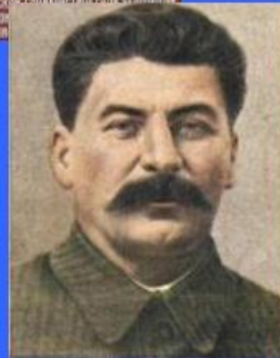
Сталин Иосиф Виссарионович 1879 - 1953