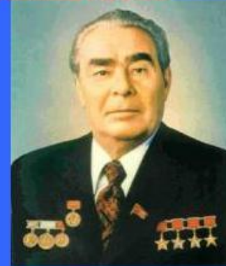
Брежнев Леонид Ильич 1906- 1982