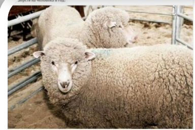
Ежегодно производится 1 200 500 тонн шерсти. Большинство — в странах «большой шестёрки» (Австралия, Новая Зеландия и Великобритания). Однако более 25% шерсти, используемой для изготовления одежды, производится в Австралии, где на 21,5 млн. человек приходится 111 млн. овец, и — по 5 овец на каждого жителя.