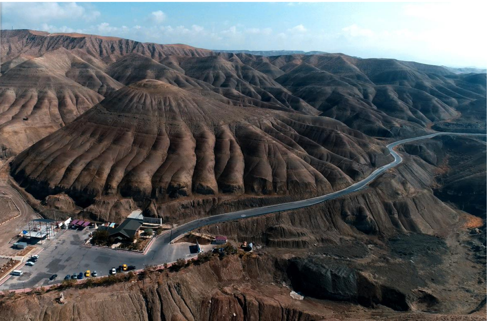
Пещера Дуздаг (Нахичеванская Автономная Республика)