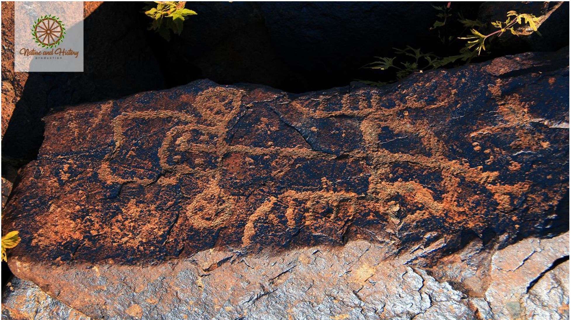
Наскальные рисунки Гямигая (Нахичеванская Автономная Республика)