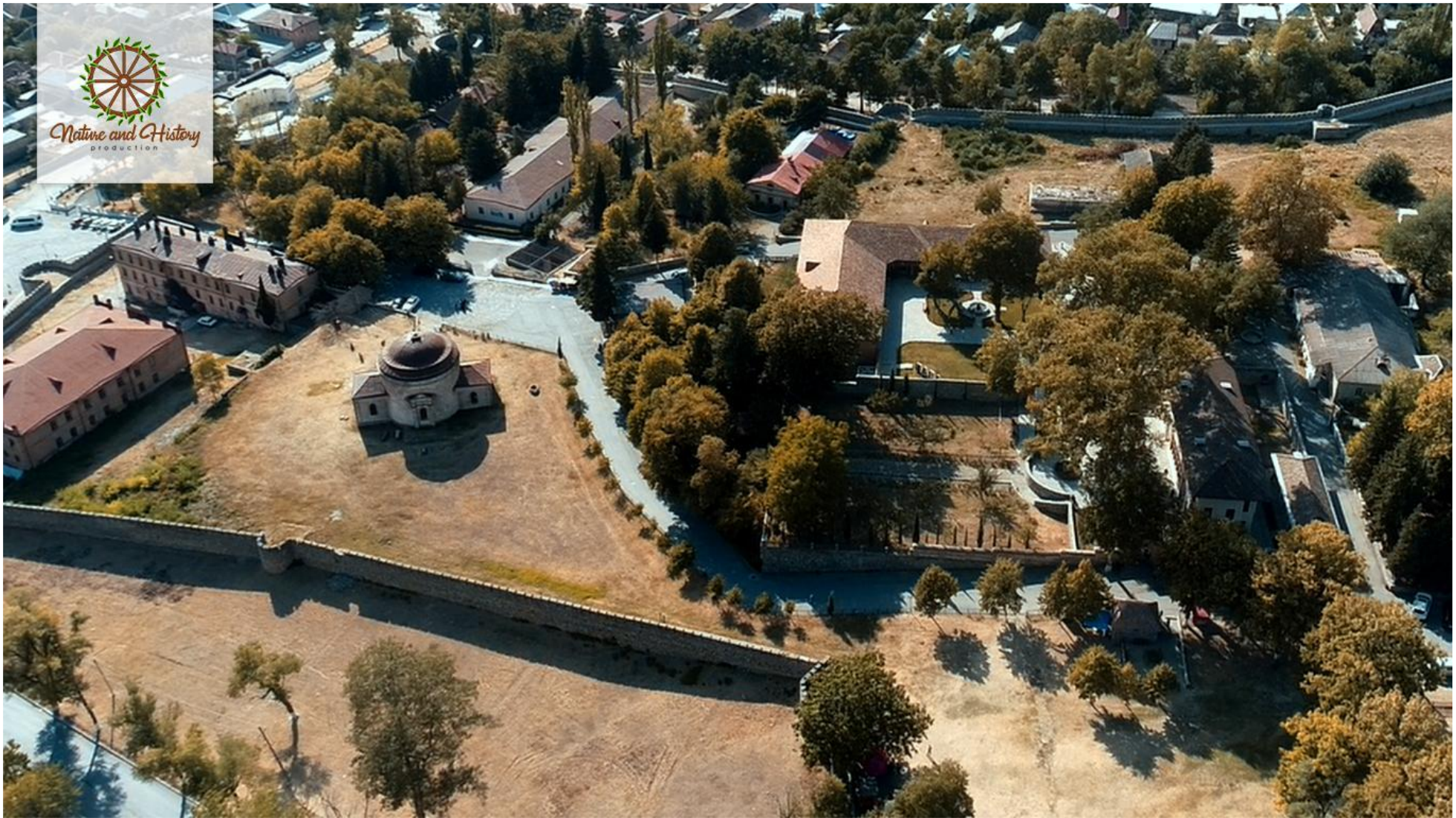
“Юхары Баш” Государственный историко-архитектурный заповедник (Шекинский район)