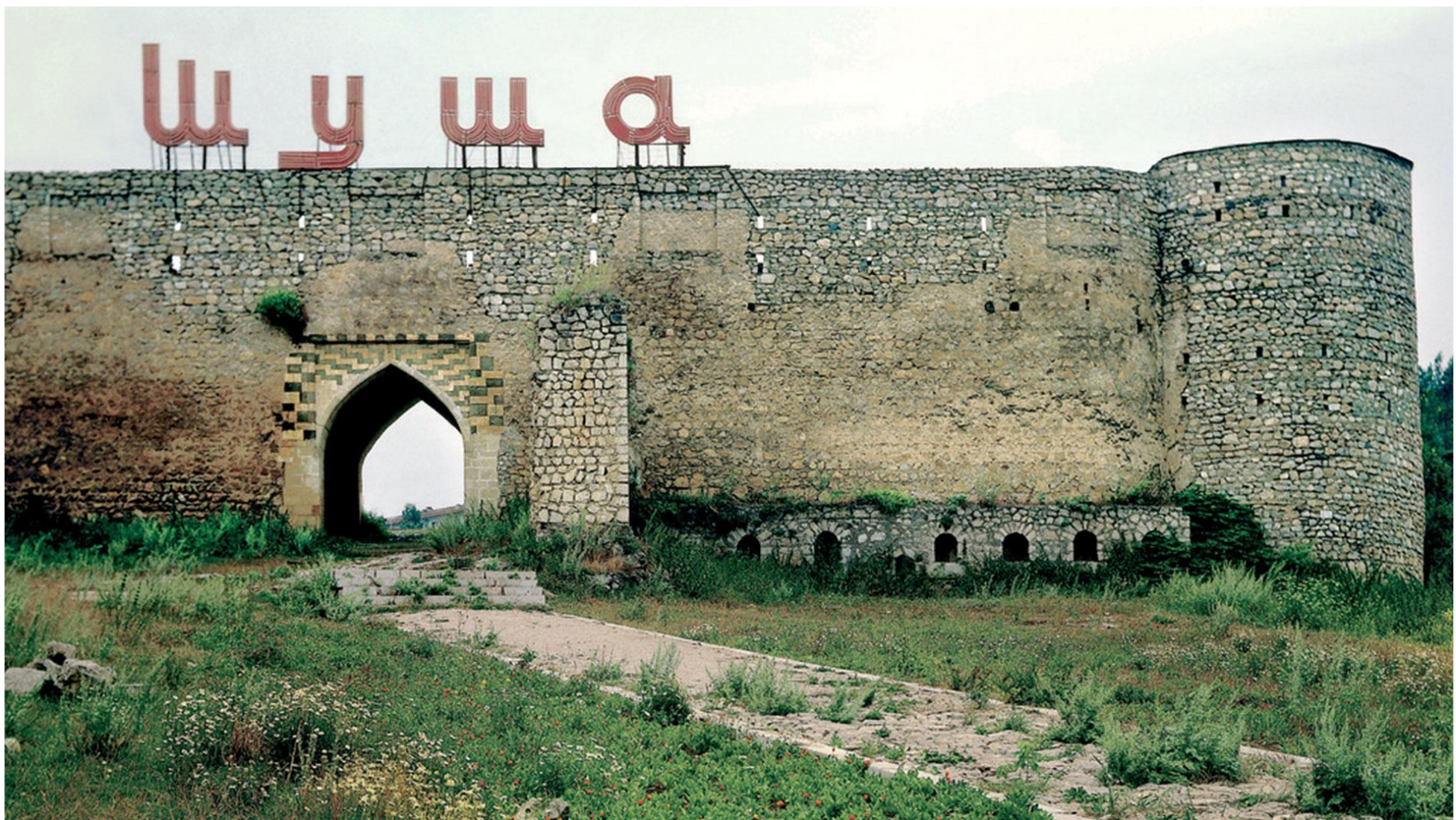
Шушинский государственный историко-архитектурный заповедник (Город Шуша)