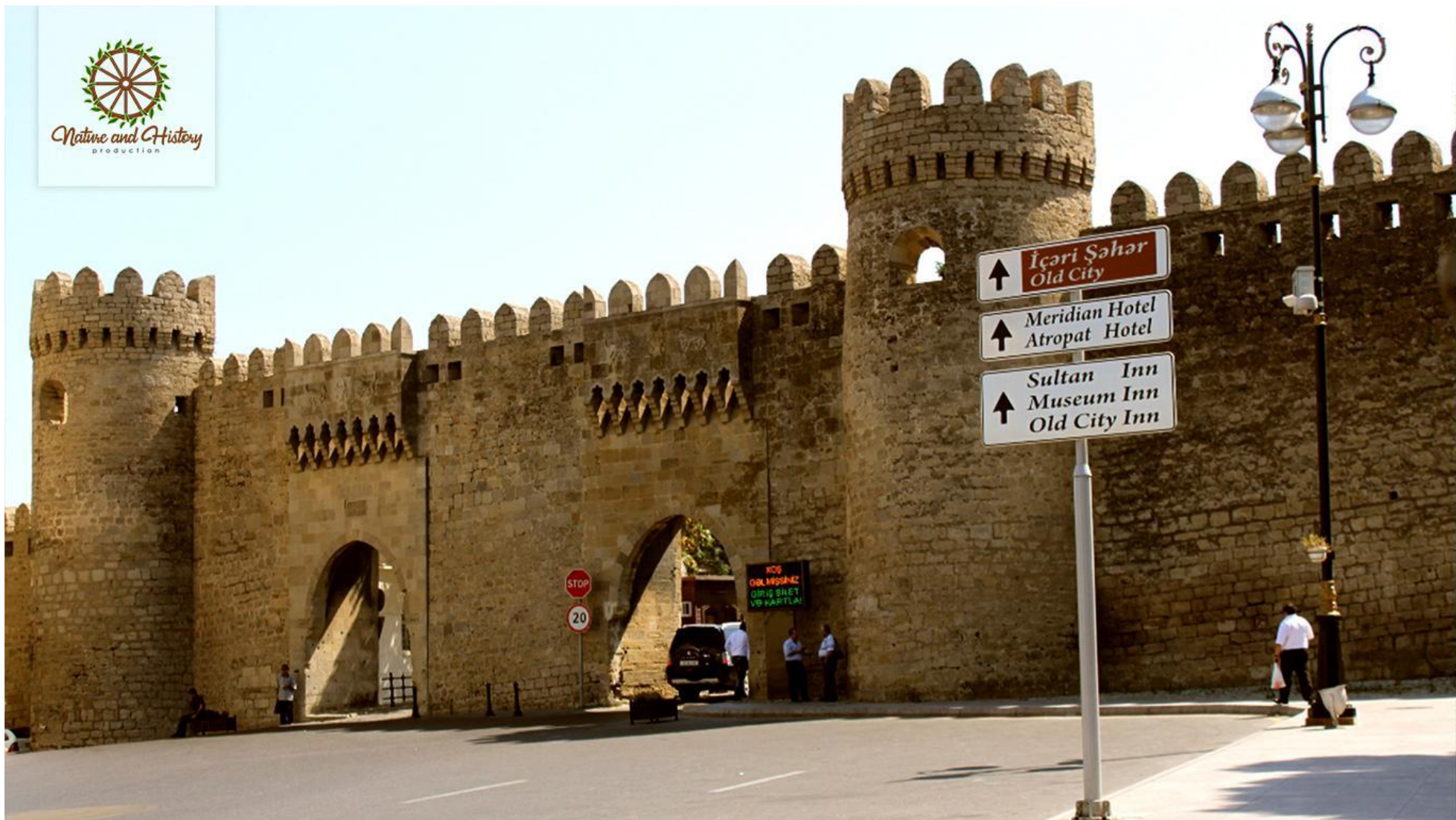
Историко-архитектурный комплекс Ичеришехер (Город Баку)