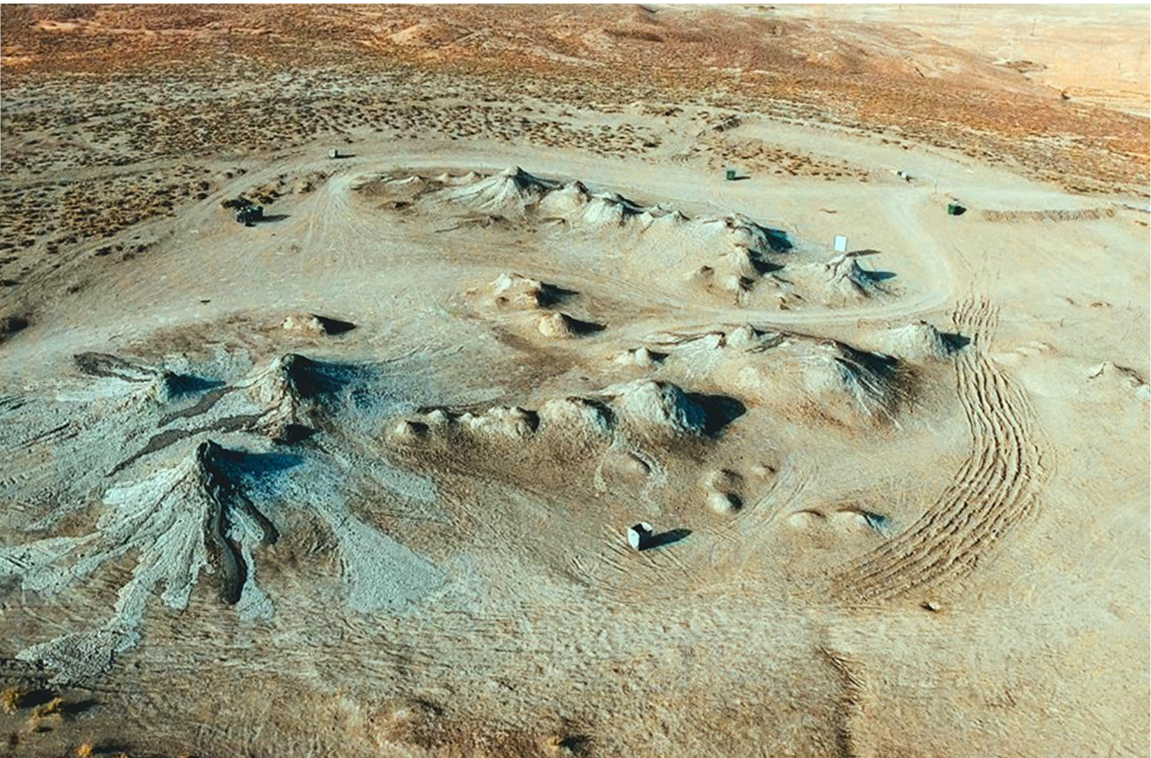
Грязевые вулканы (Апшеронский полуостров)