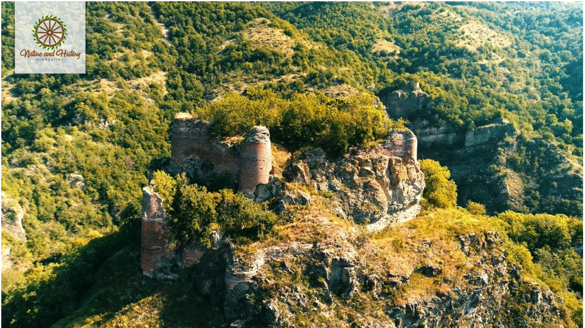
Намердгала (Гедабекский район)