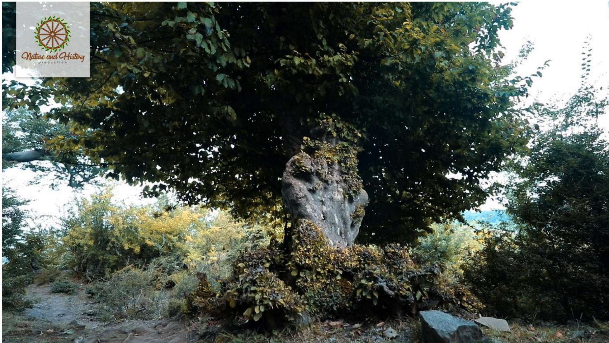
Демирагадж (реликтовые деревья) (Город Ленкорань)