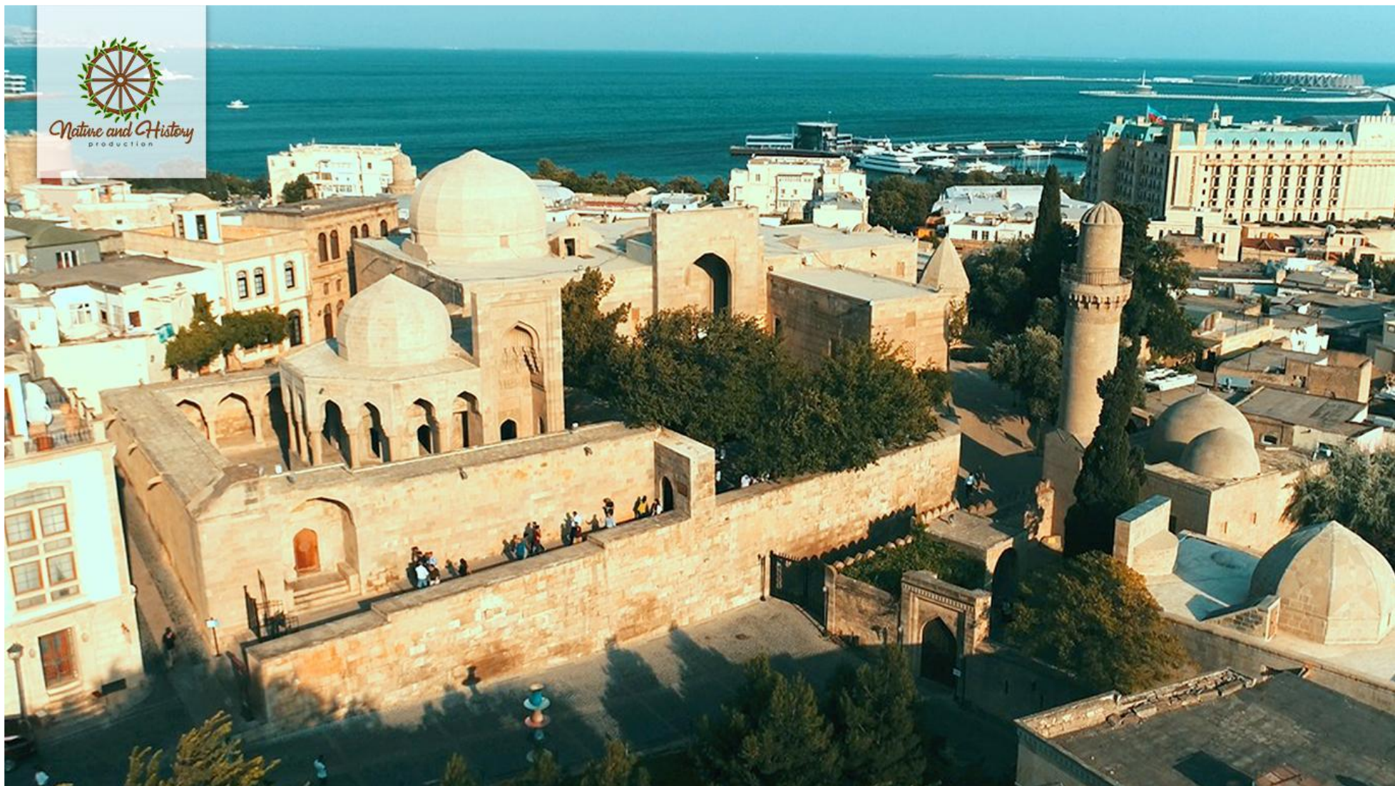
Комплекс Дворца Ширваншахов (Город Баку)