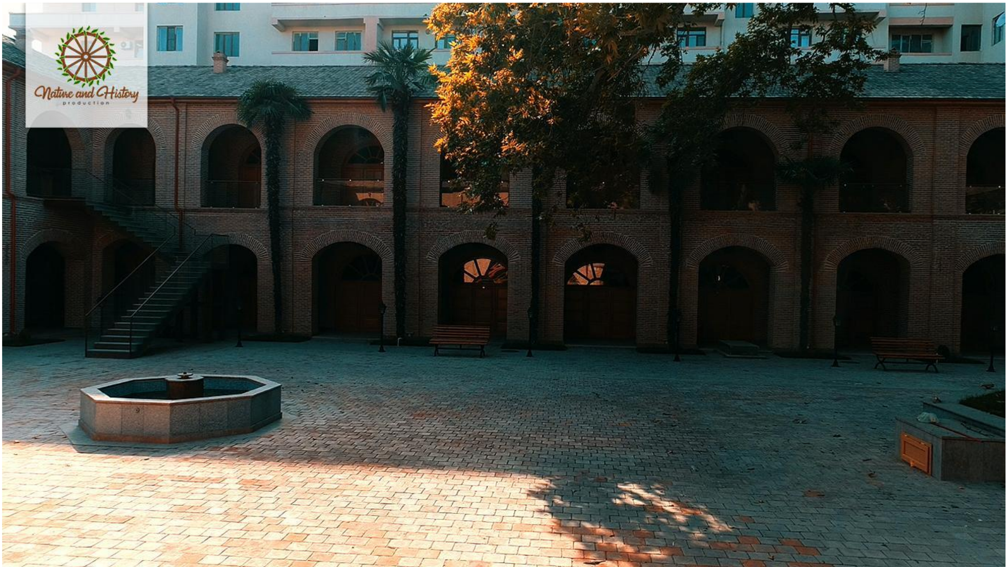
Караван-сарай Шах Аббас (Город Гянджа)