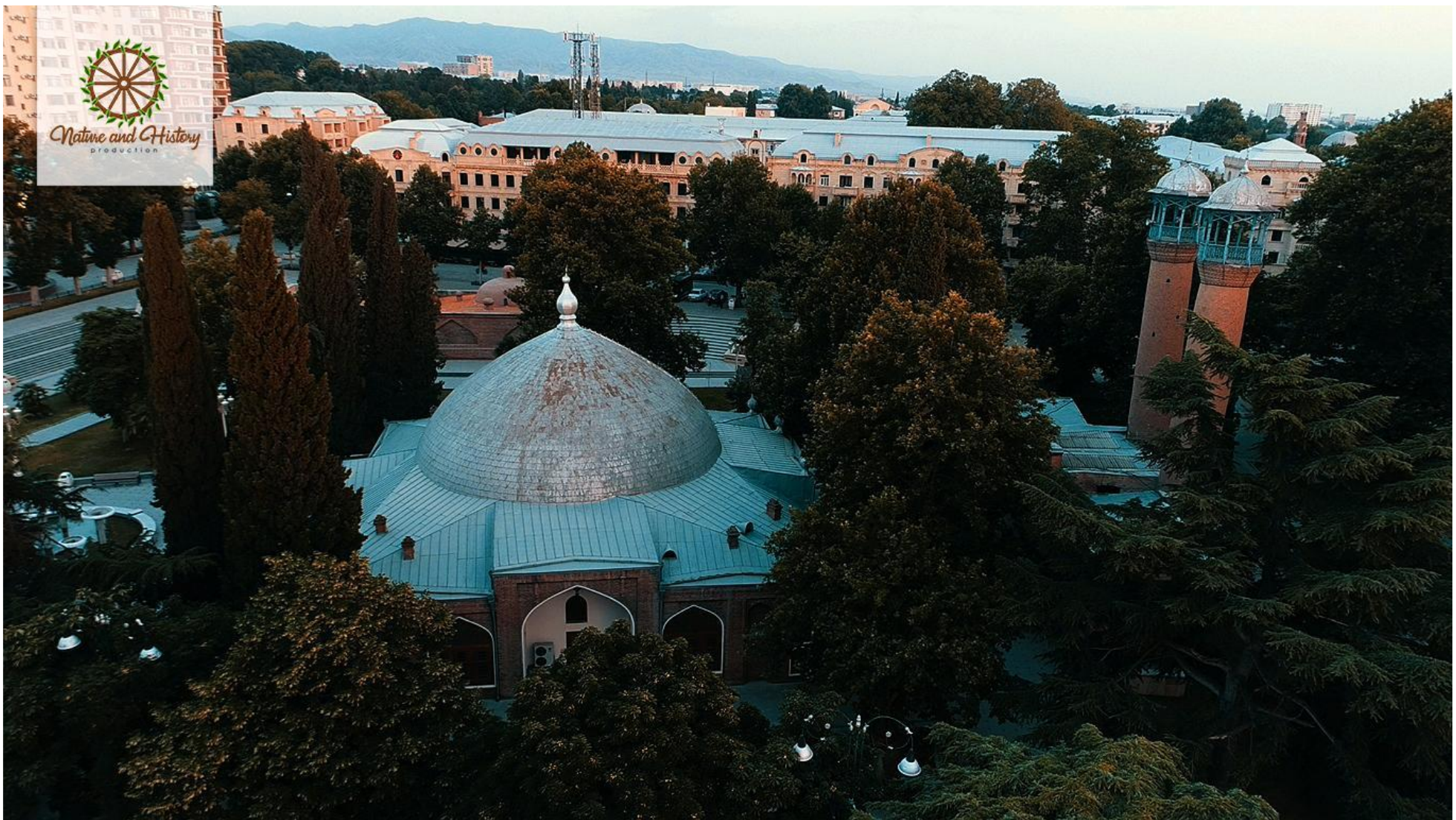
Джума мечеть (Город Гянджа)