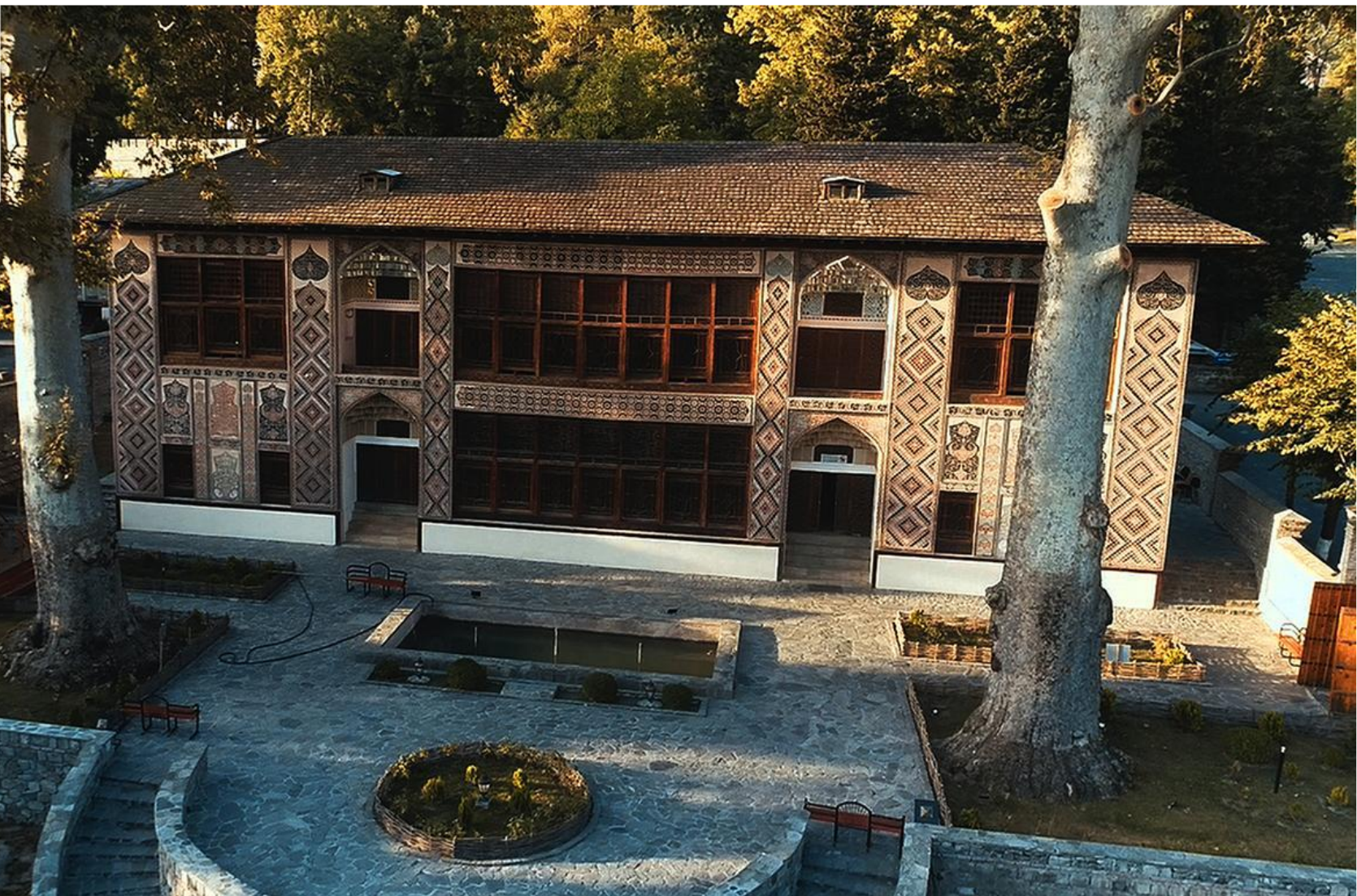
Дворец Шекинских ханов ( Шекинский район)