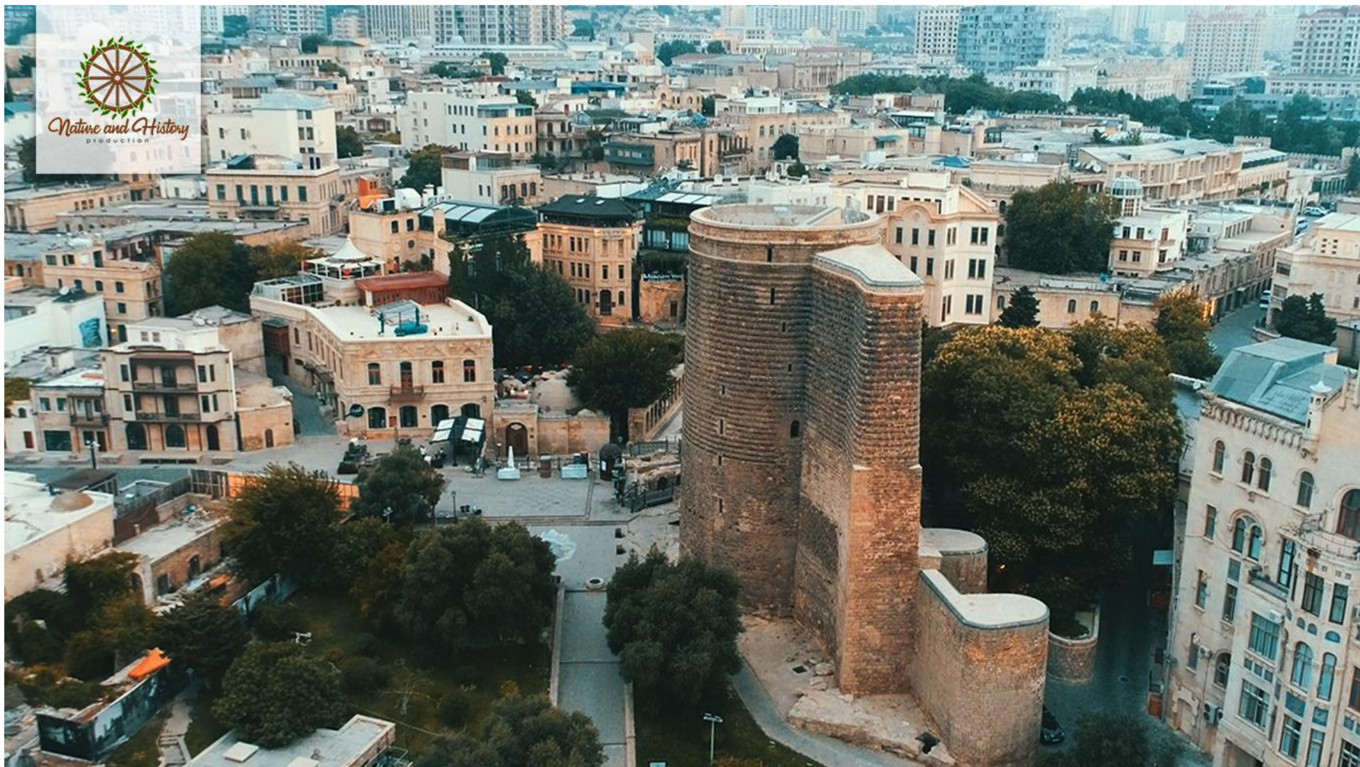
Девичья башня (Город Баку)