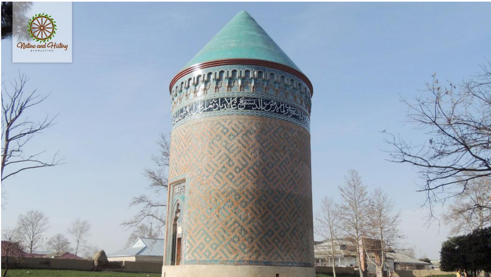
Бардинский мавзолей (Бардинский район)