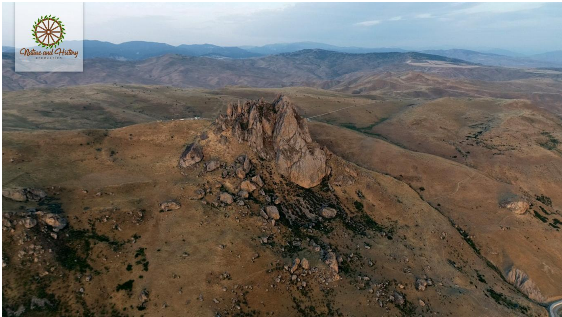
Оборонительная стена Бешбармаг (Сиязенский район)