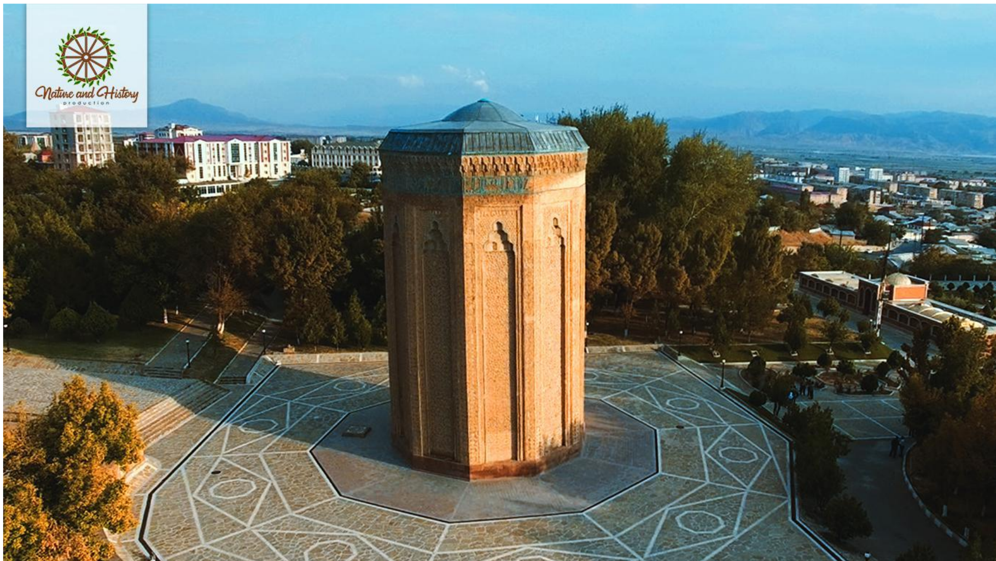
Мавзолей Момине Хатун (Нахичеванская Автономная Республика)