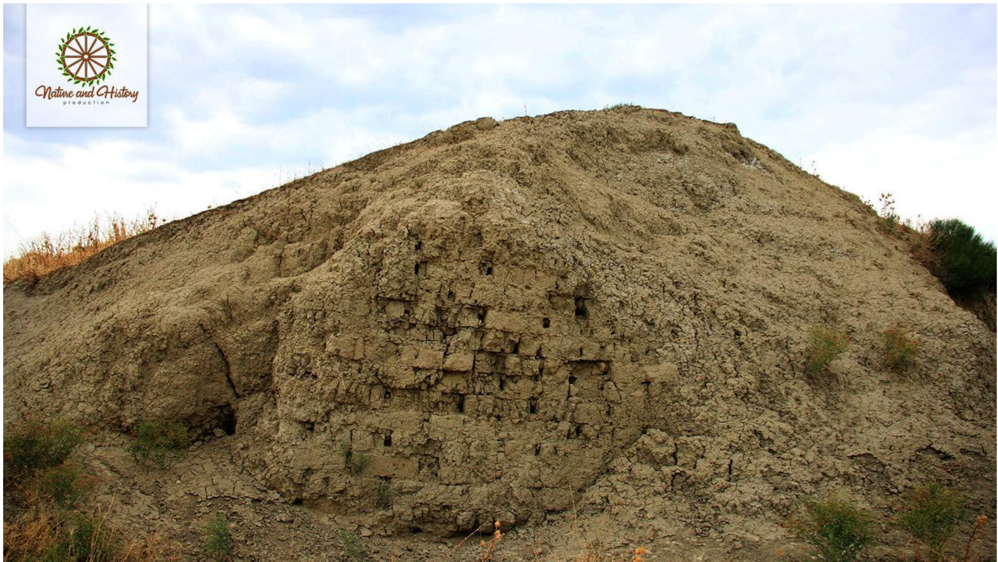
Оборонительный вал Гильгильчай (Шабранский район)