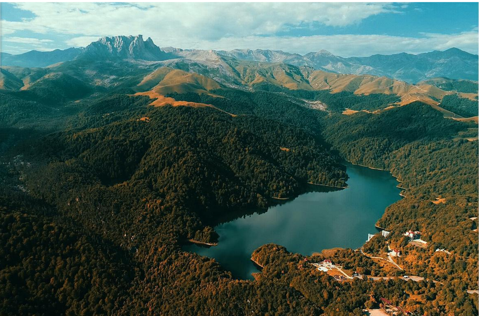
Гейгель и гора Кяпяз (Город Гянджа)