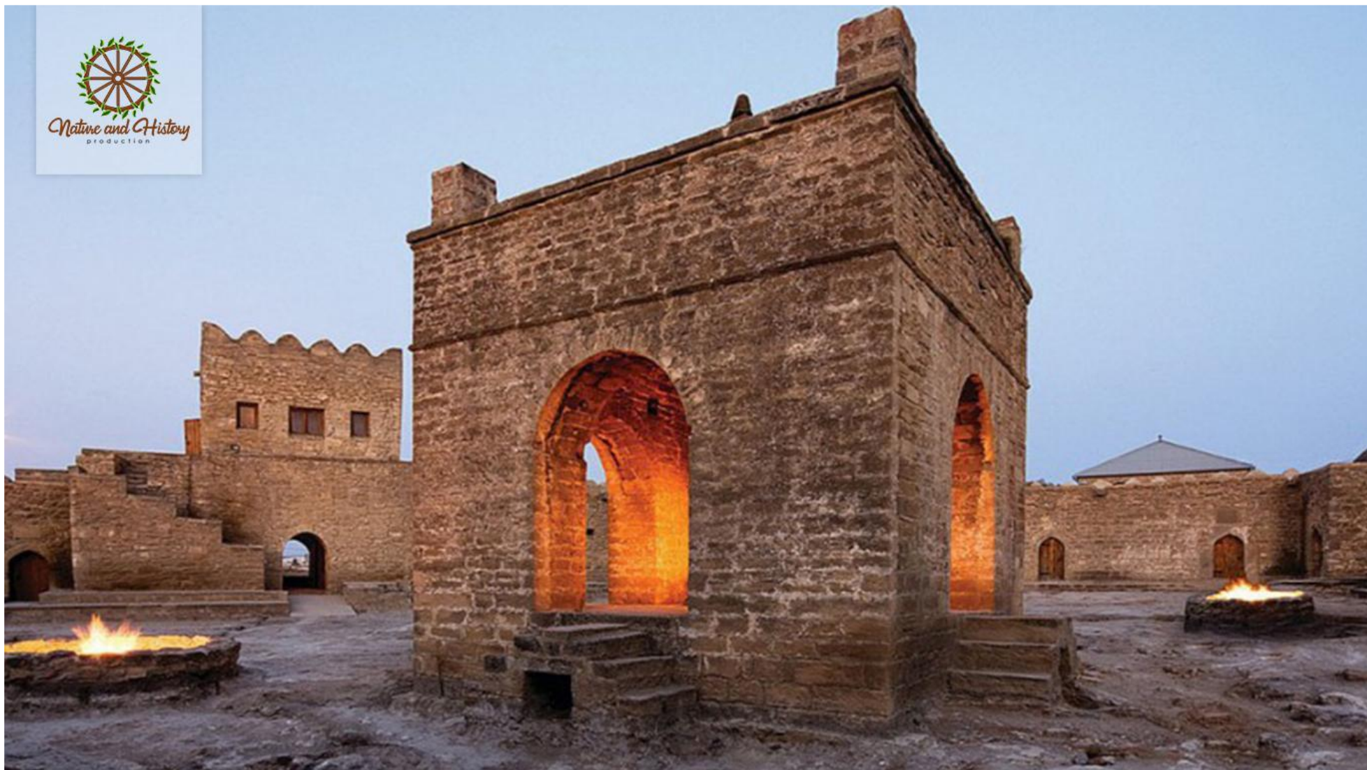
Государственный историко-архитектурный заповедник Аteshgяx (Сураханский район)