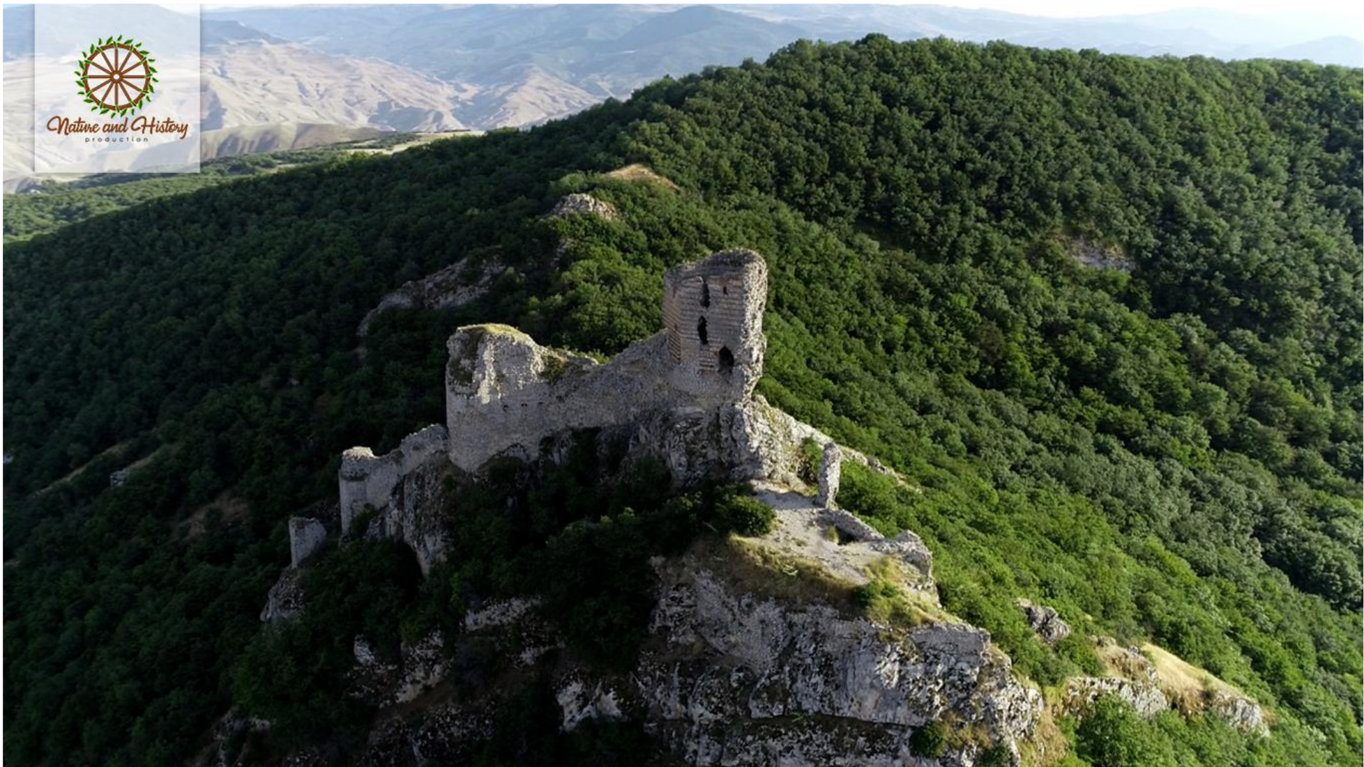
Чираггала (Шабранский район)