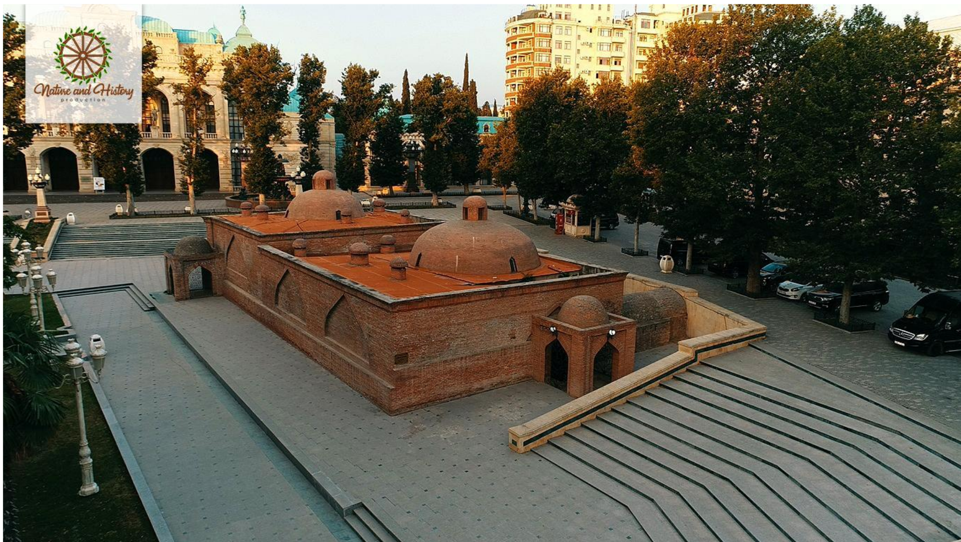
Баня Чокек Хамам (г. Гянджа)