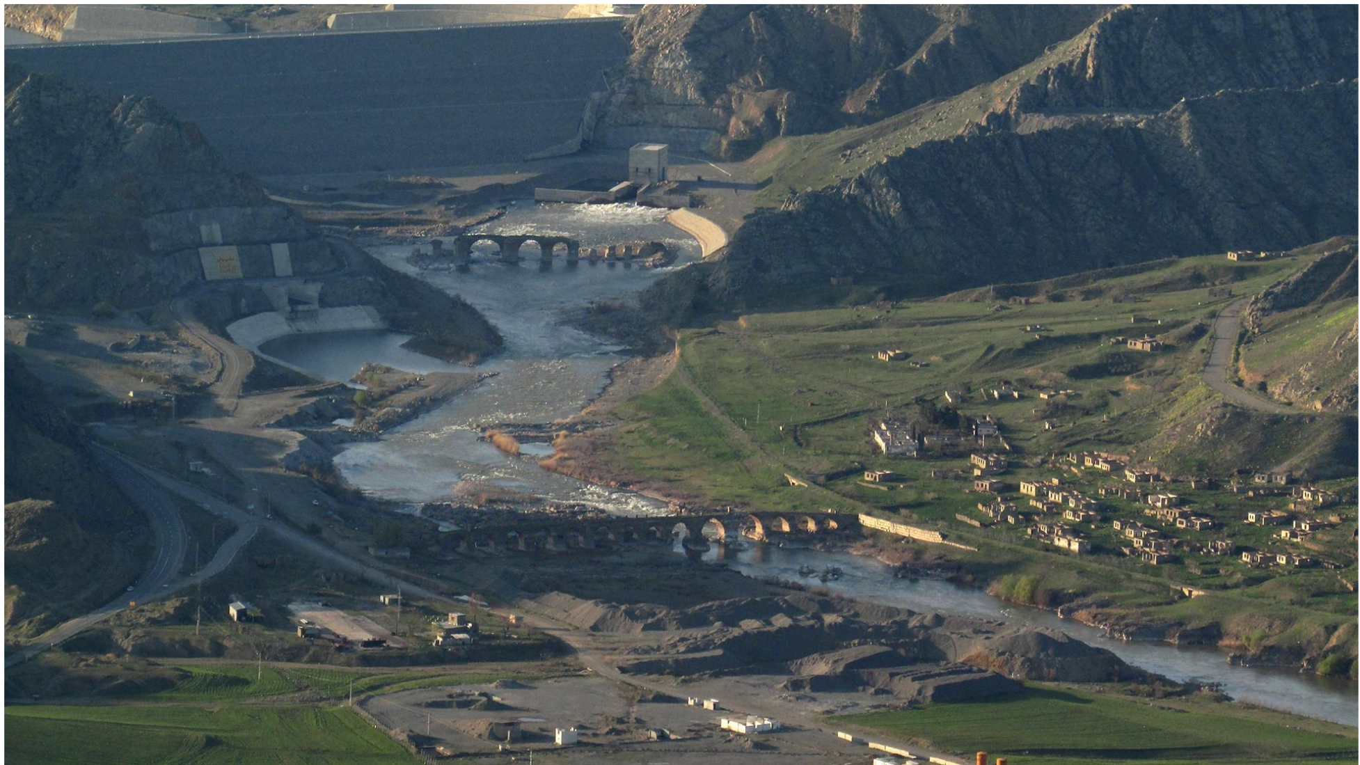
Худаферинские мосты (Джабраильский мост)