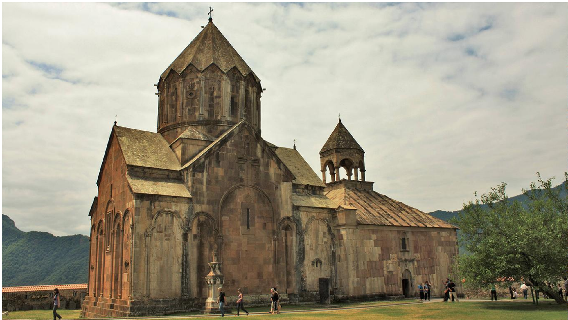
Гянджасарский монастырь (Кельбаджарский район)