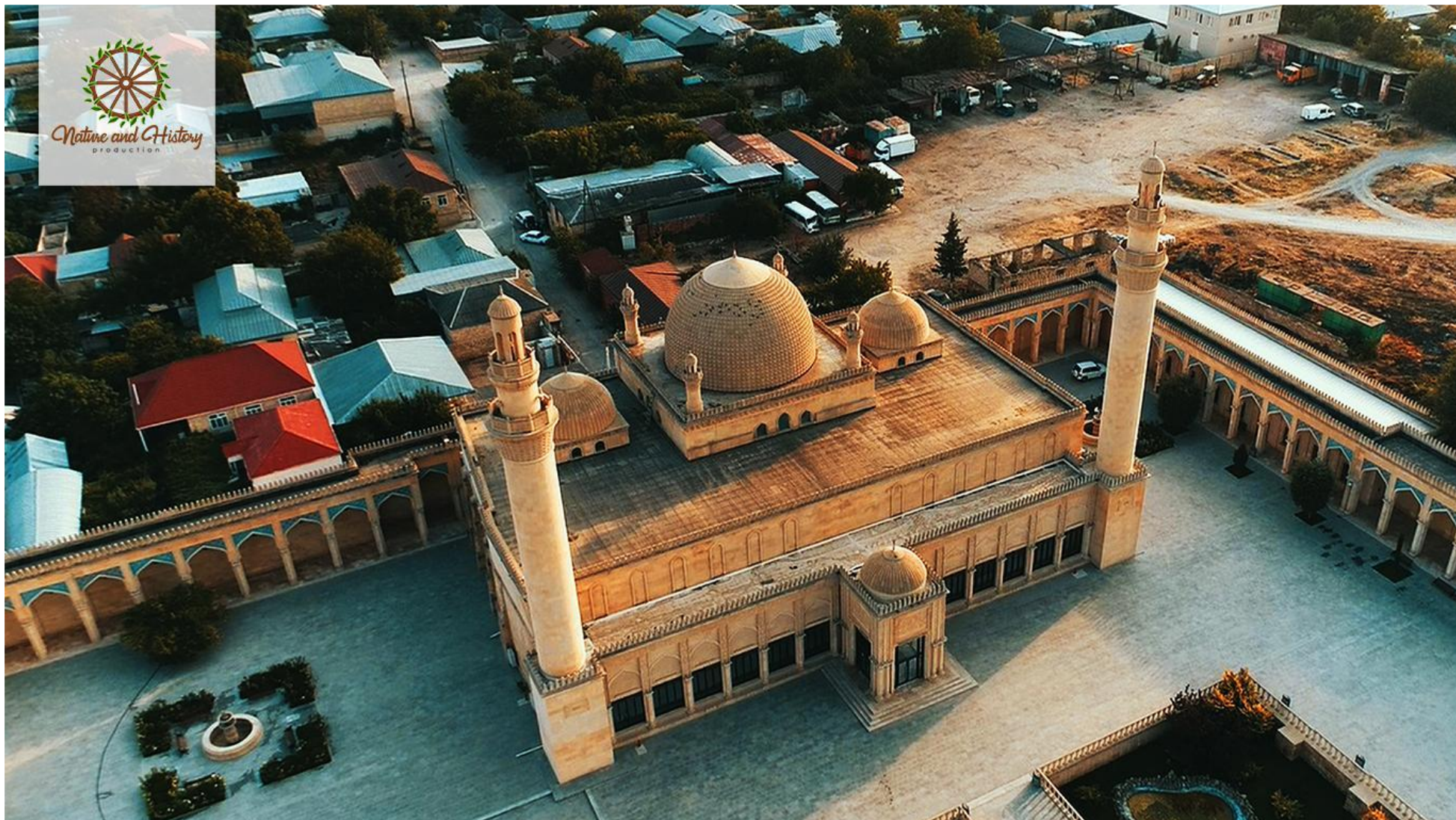
Джума-мечеть (Шемахинский район)