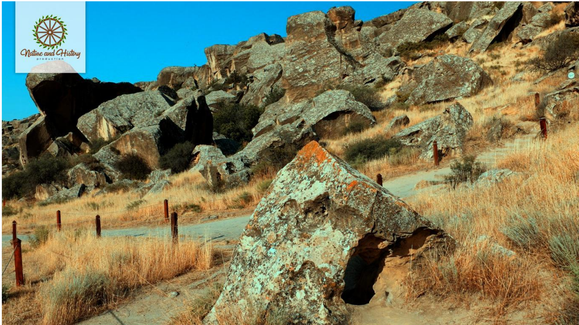
Гобустанский Государственный историко-художественный заповедник ( Гарадагский район)