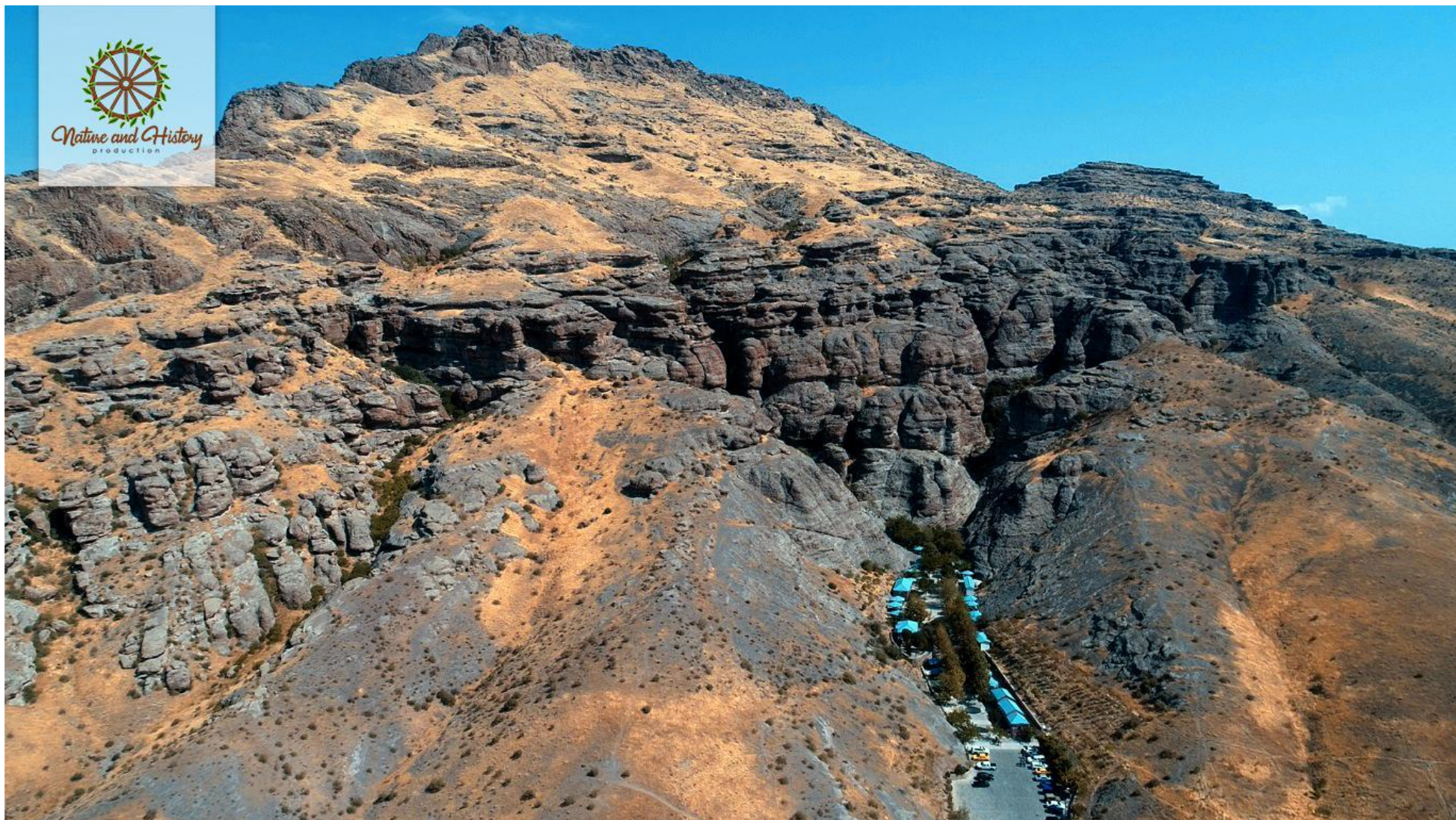
Пещера Асхаби- Кахф (Нахичеванская Автономная Республика)