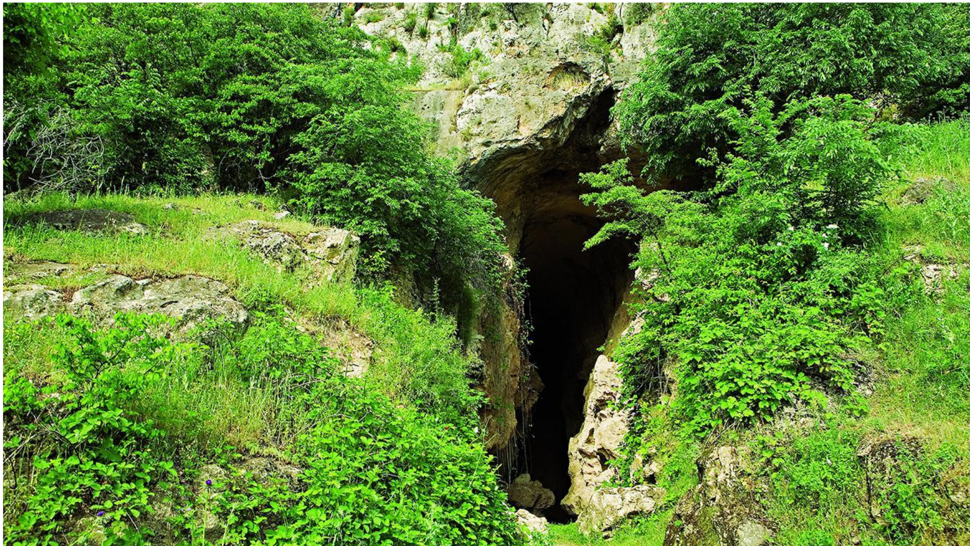
Азы́ская пещера (Физулинский район)