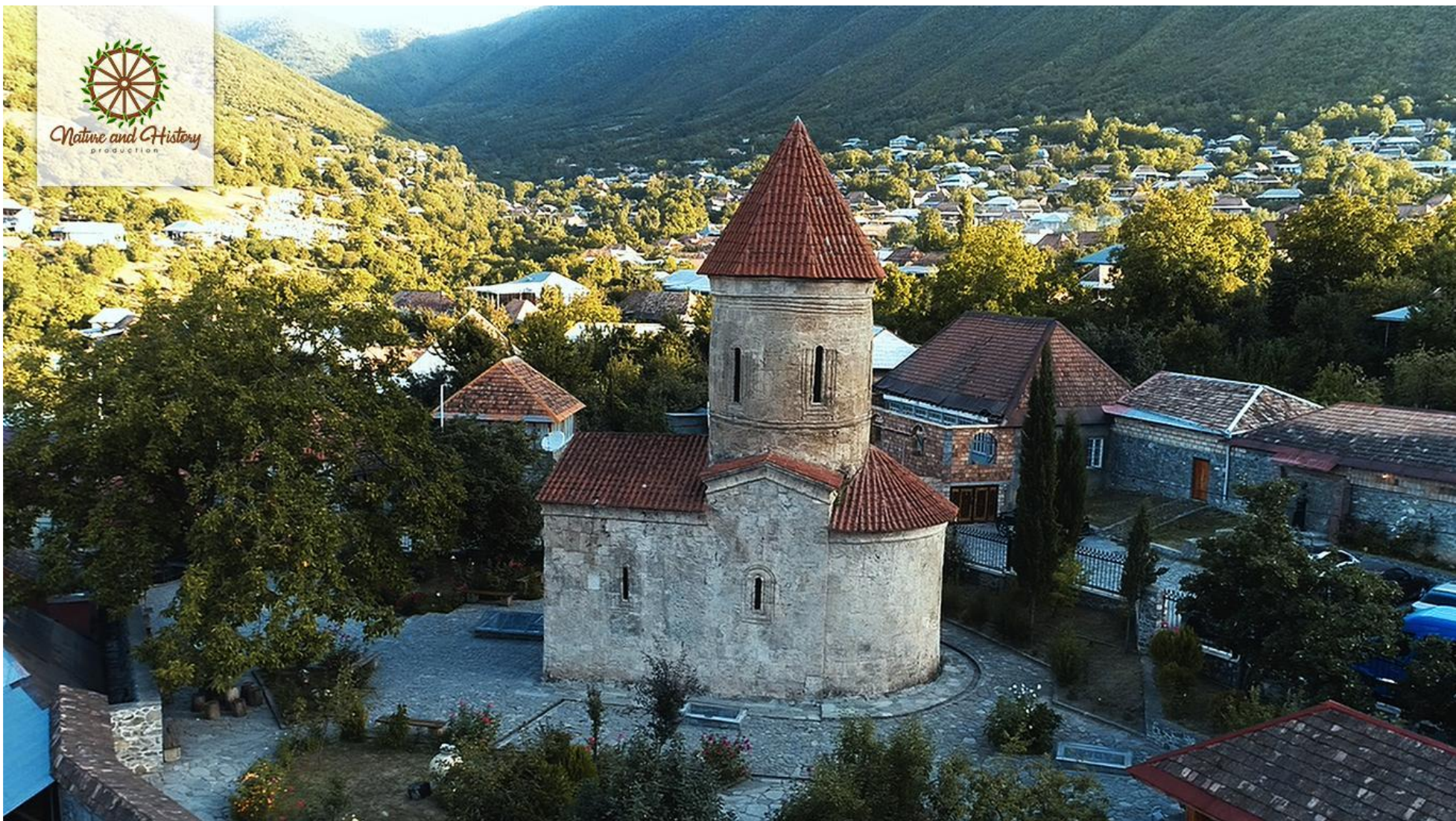
Церковь Киш (Святого Елисея)