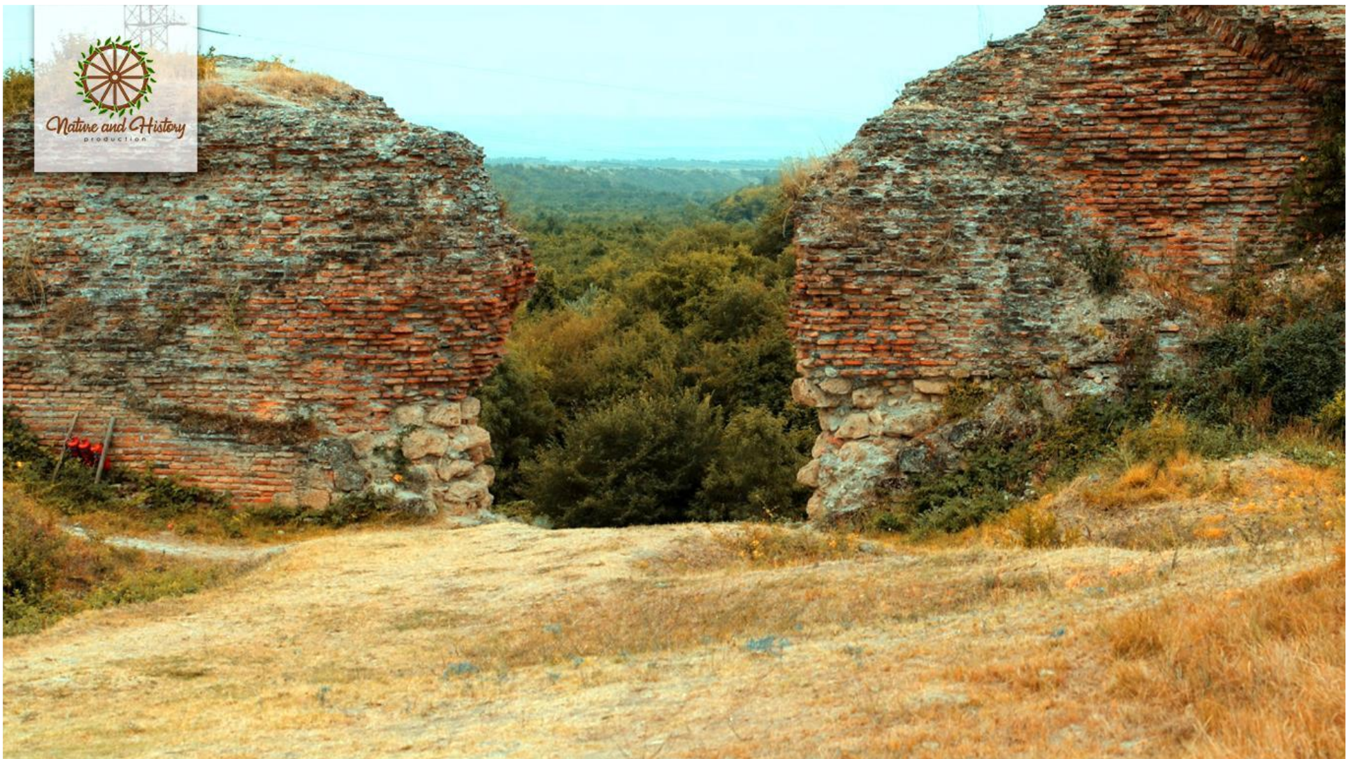
Древний город Габала, крепость Сальбир (Габалинский район)