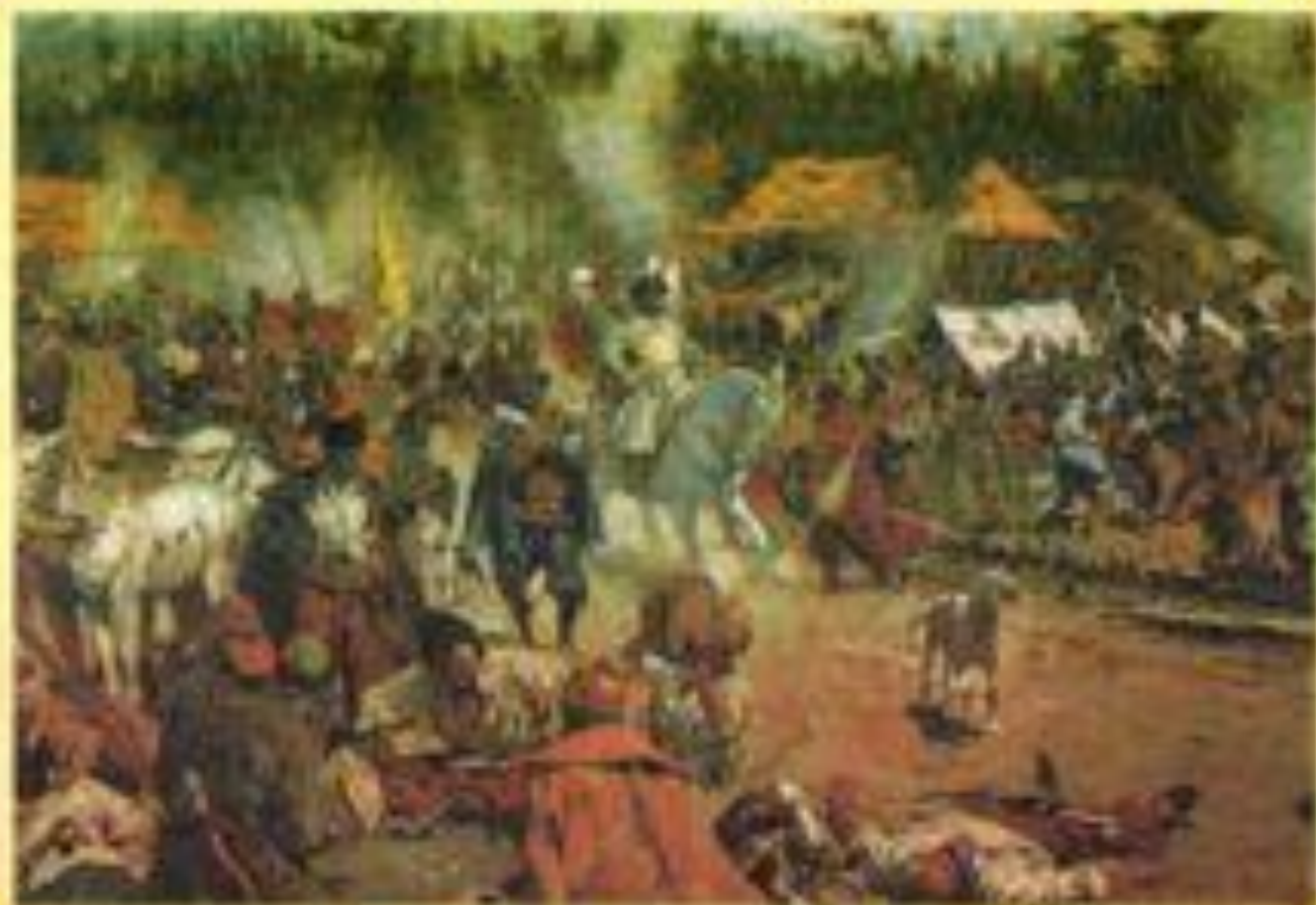
С. Иванов. Смутное время