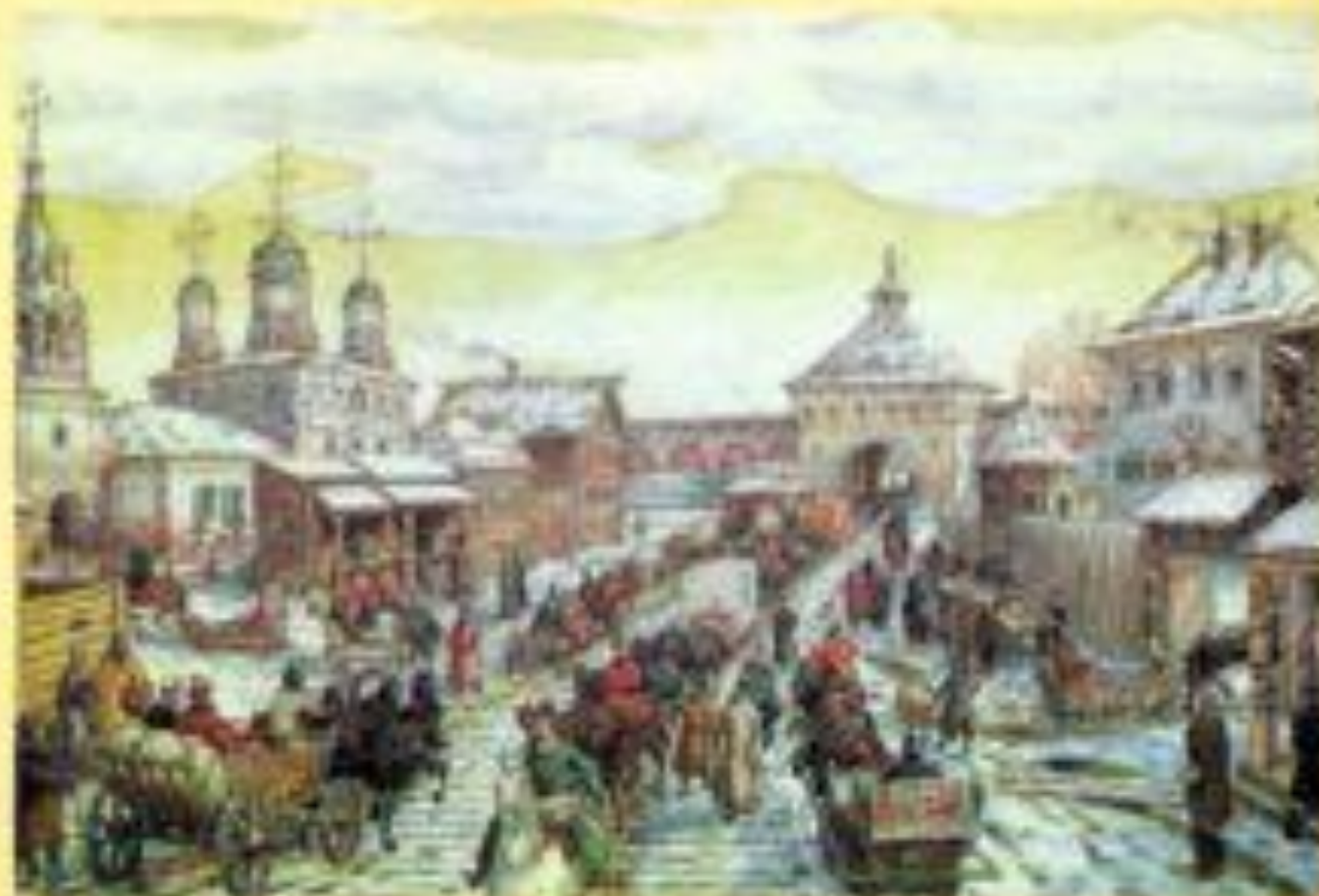
А. Васнецов. Мясницкие ворота. Уличное движение в XVII веке