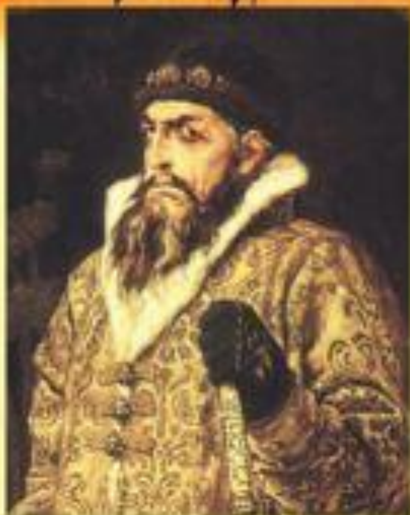
Портрет Ивана Грозного, художник В.М. Васнецов