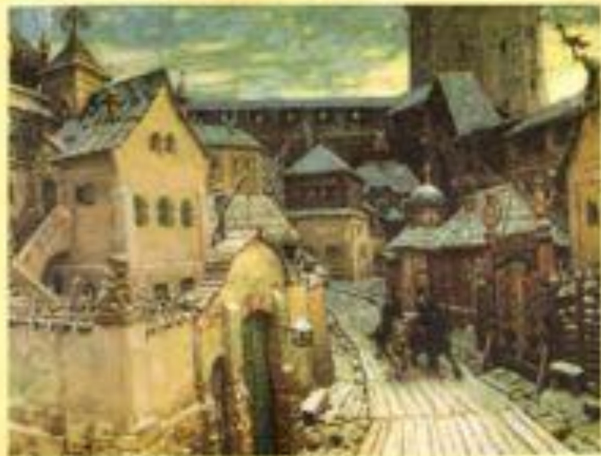
А. Васнецов. Гонцы. Ранним утром в Кремле.