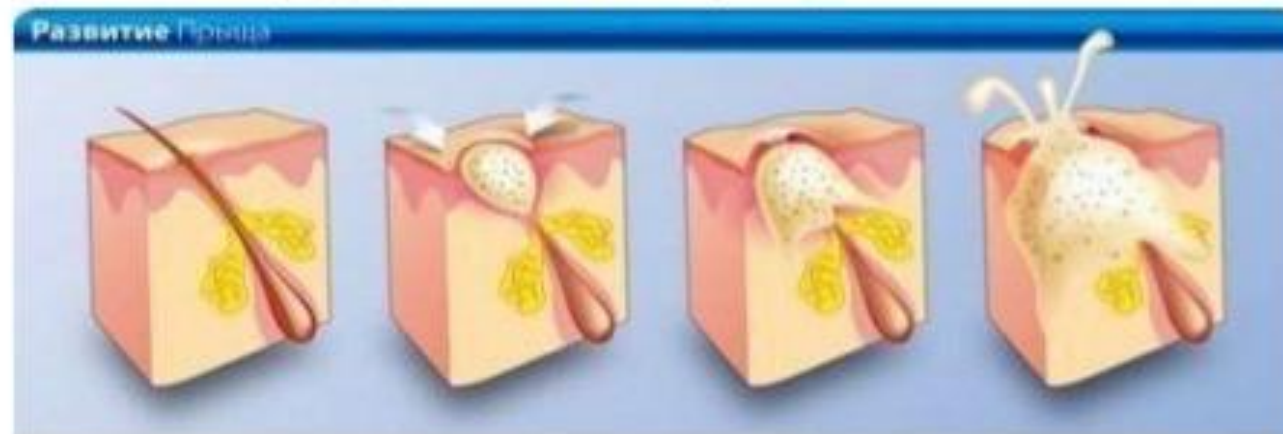
Обычное состояние поры