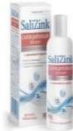
Салициловый лосьон «SaliZink»