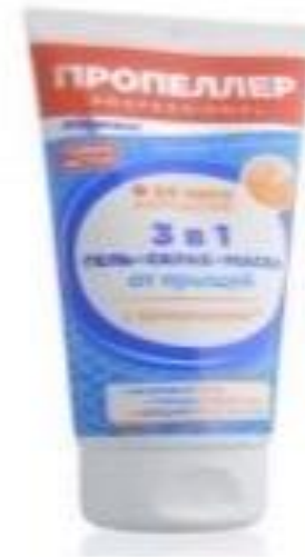
Гель от прыщей «Пропеллер»