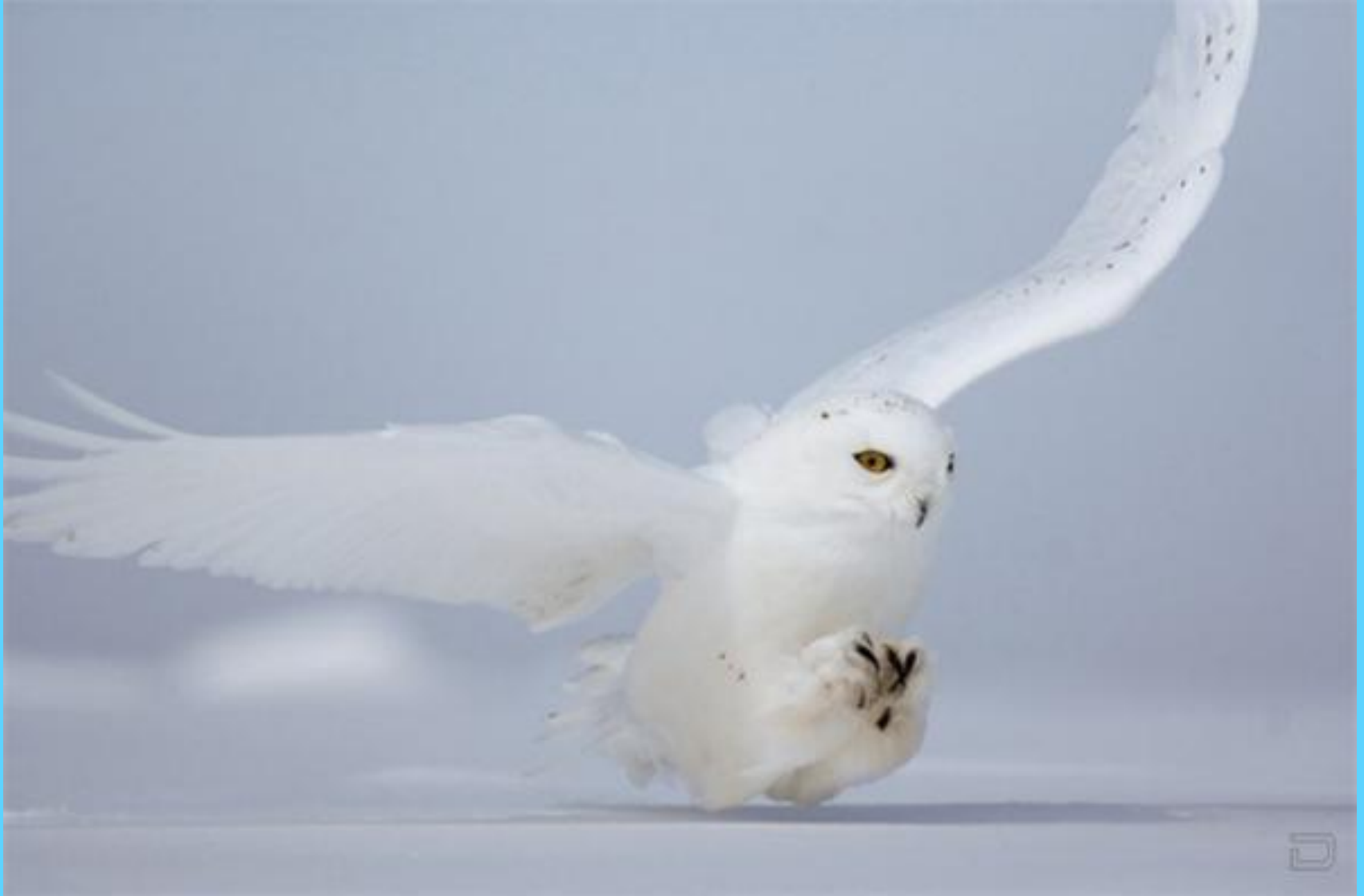
СЕВЕРНАЯ БЕЛАЯ СОВА