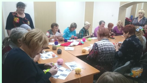
«Мы от скуки на все руки»