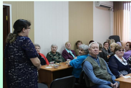
«Мы от скуки на все руки»