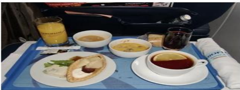
Реклама на тормозных салфетках/на подносе