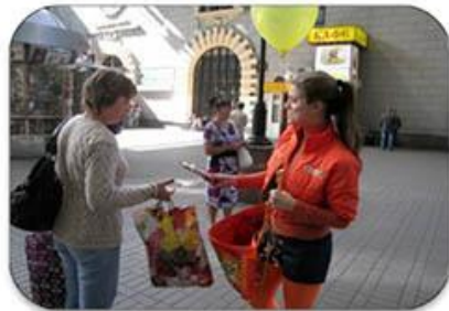
Промо-акции на вокзалах, платформах и в электропоездах