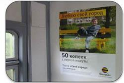
Реклама в пригородных поездах и поездах дальнего следования