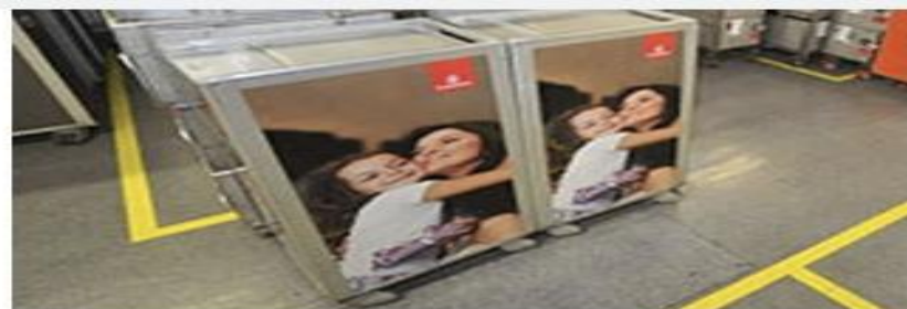
Реклама на тележках с питанием