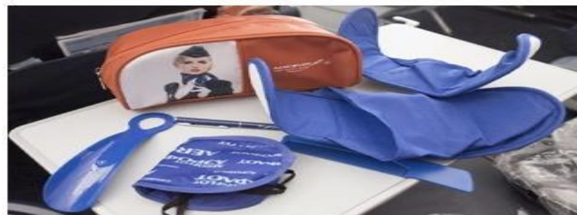
Реклама на дорожных наборах