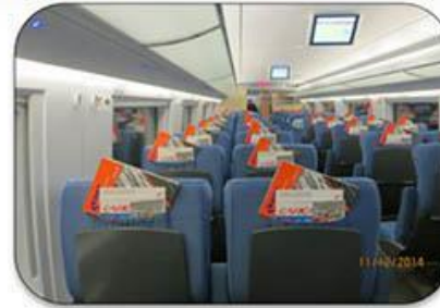
Реклама в поездах Сапсан /фирменных поездах