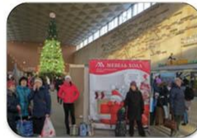
Экспонирование на вокзале