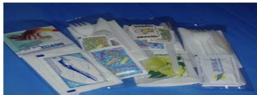
Реклама на упаковках столовых приборов