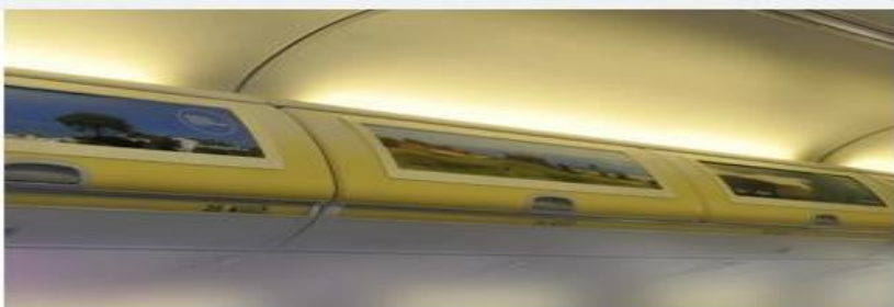
Реклама на багажных полках