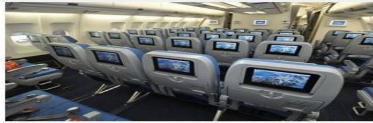
Реклама на мониторах