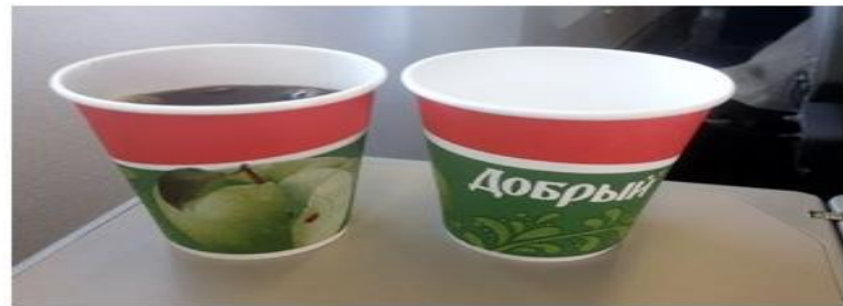
Реклама на стаканчиках, одноразовой посуде