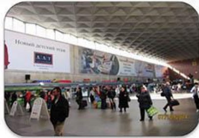
Рекламные конструкции на вокзалах