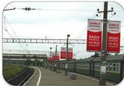
Рекламные конструкции на пригородных станциях