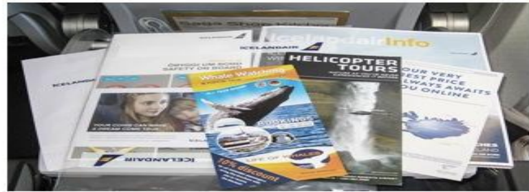
Раскладка полиграфии (буклеты, листовки)