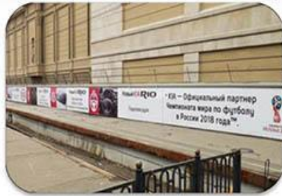
Рекламные конструкции на платформах