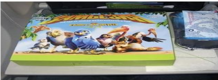
Реклама на ланч-боксах (снаружи и внутри)