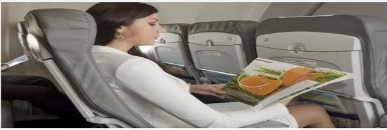
Реклама в бортовых журналах авиакомпаний