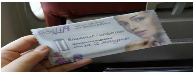
Реклама на упаковках влажных салфеток