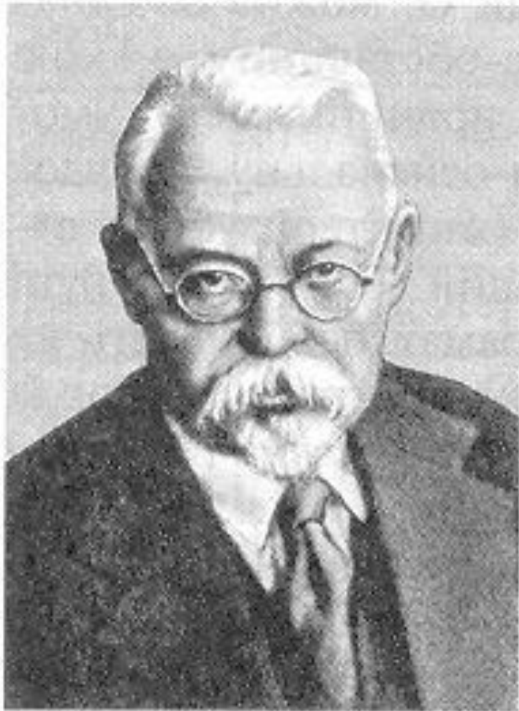
I. I. Огієнко.

I. Огієнко зауважив: «Мова — це наша національна ознака, в мові — наша культура, ступінь нашої свідомості... і поки живе мова — житиме і народ як національність. Не стане мови — не стане й національності: вона геть розрушиться поміж дужчим народом».