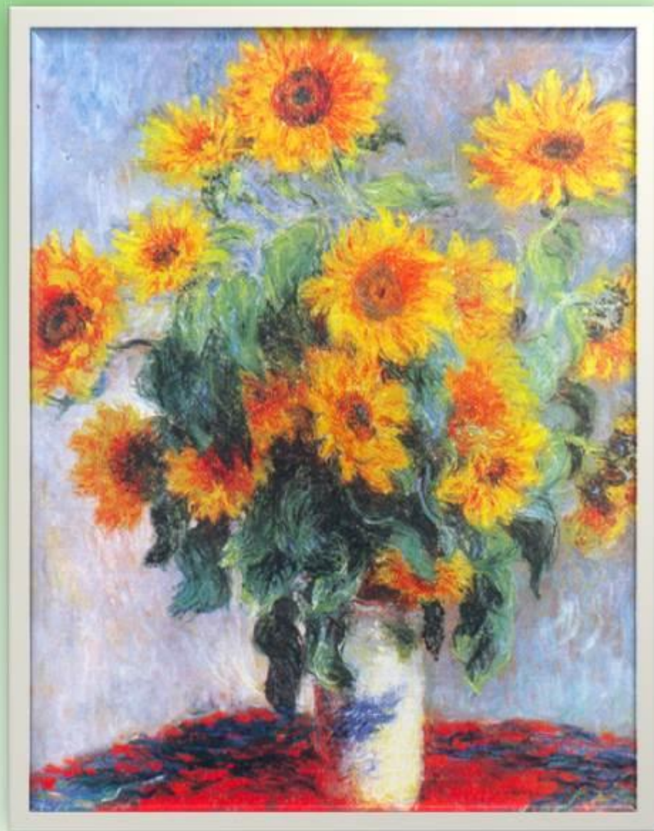
Клод Мане «Подсолнечники»