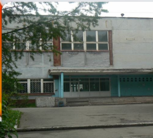
ГАПОУ СО «НТГМК»

СРЕДНЕЕ ПРОФЕССИОНАЛЬНОЕ ОБРАЗОВАНИЕ НА БАЗЕ 9 И 11 КЛАССОВ