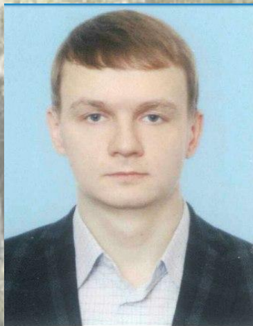
Правительство Рязанской области