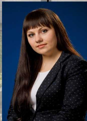
МАУК г. Рязани «Лесопарк»