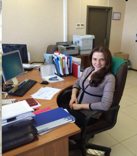
ООО «НК Роснефть»