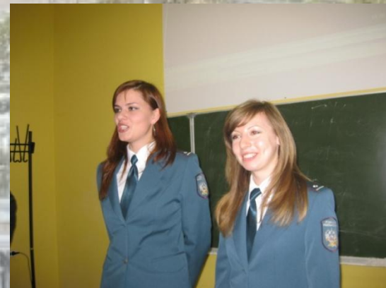
УФНС РФ по Рязанской области