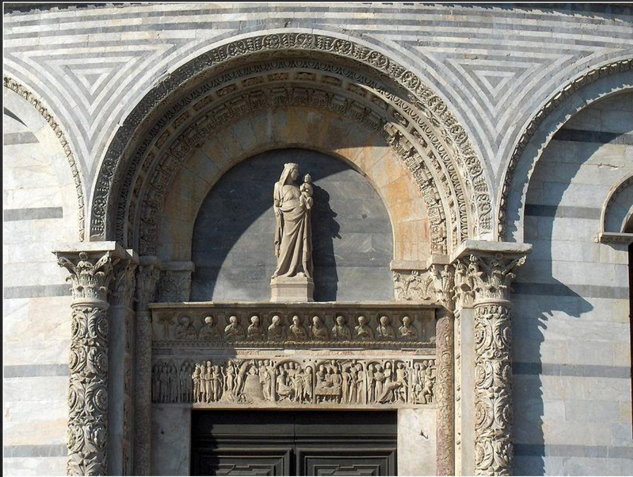
Баптистерий Святого Иоанна