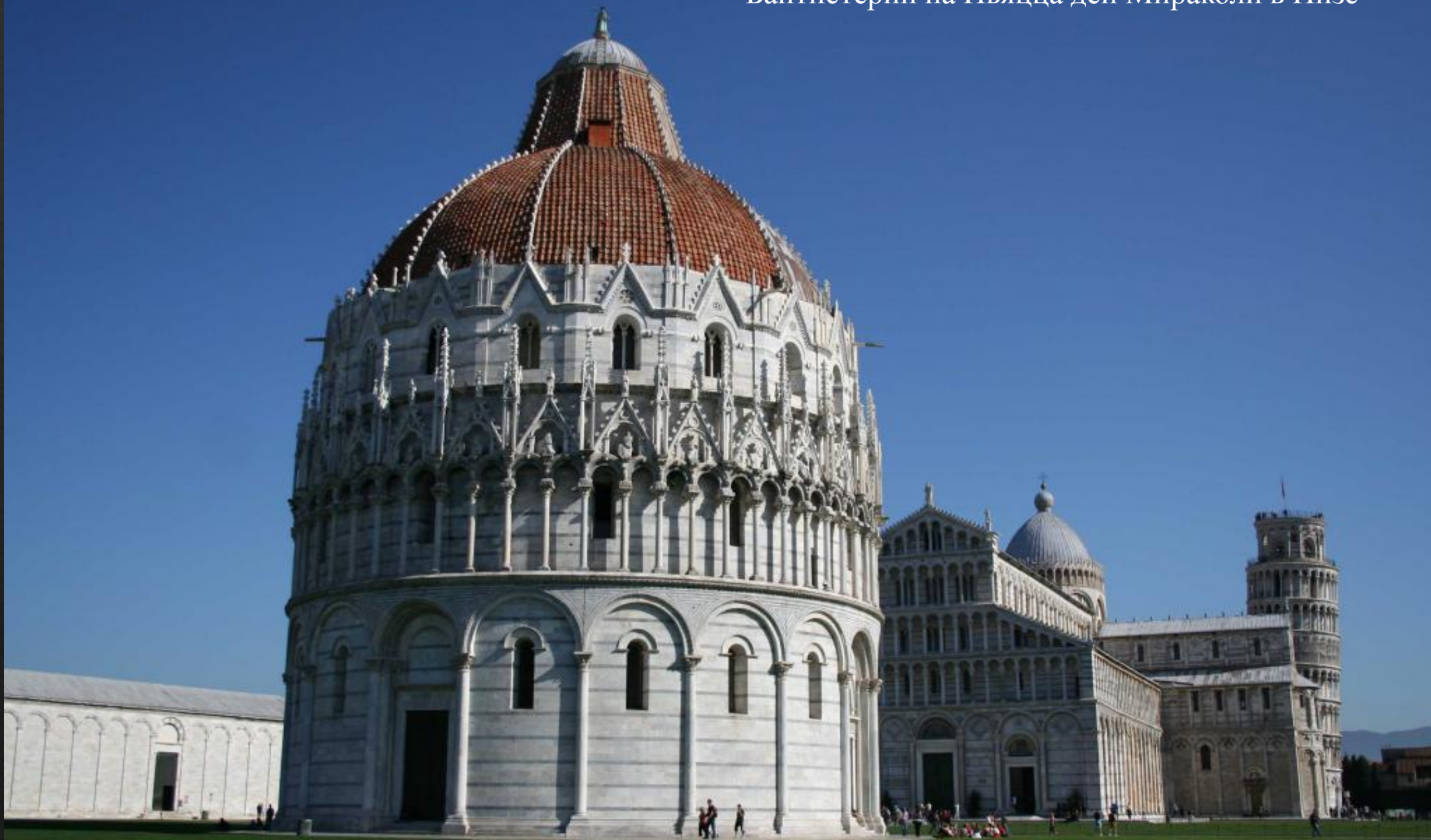
Баптистерий на Пьяцца деи Мираколи в Пизе