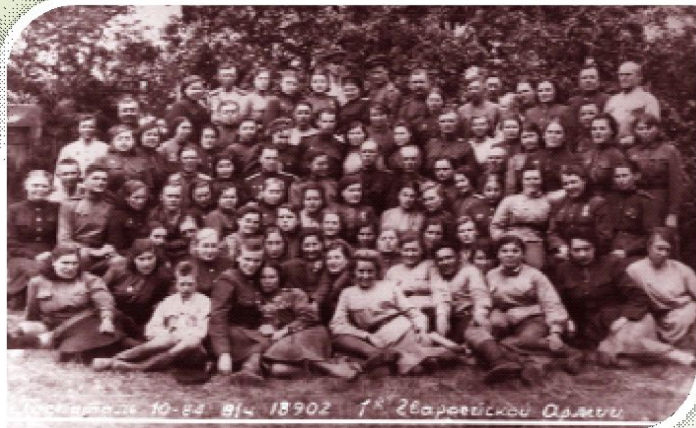
Госпиталь 10-84 9/4 18902 1-я Зваревской Армии