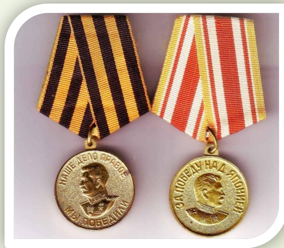
Медаль «За победу над Японией»