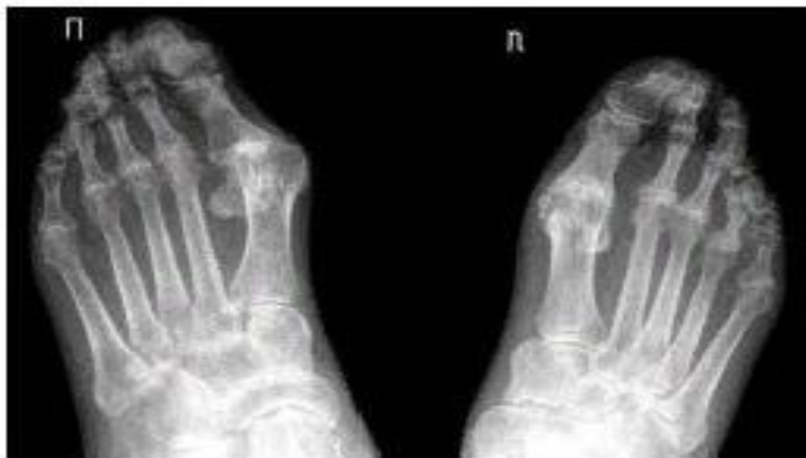
Рис. 10. Больной П. РА 4-й стадии.

Обзорная рентгенография дистальных отделов стоп. Выраженный распространенный остеопороз. Множественные кистовидные просветления костной ткани. Сужены щели суставов.