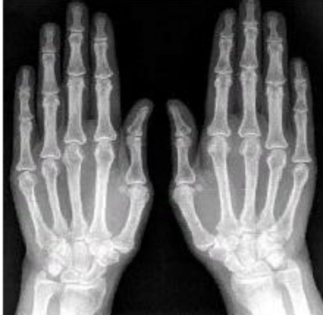
Рис. 1. Больная Н. РА 1-й стадии. Обзорная рентгенография кистей. Незначительный околосуставной остеопороз. Единичные кистовидные просветления костной ткани в пястных головках. Незначительно сужены щели отдельных пястно-фаланговых (ПЯФ) суставов