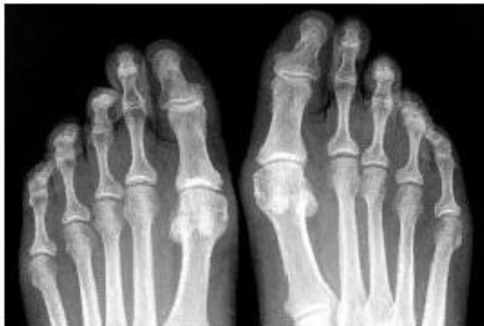
Рис. 2. Больная Н. РА 1-й стадии.

Обзорная рентгенография дистальных отделов стоп. Околосуставной остеопороз не определяется. Единичные кистовидные просветления костной ткани в 3 и 4 плюсне-фаланговых суставах слева. Суставные щели не сужены