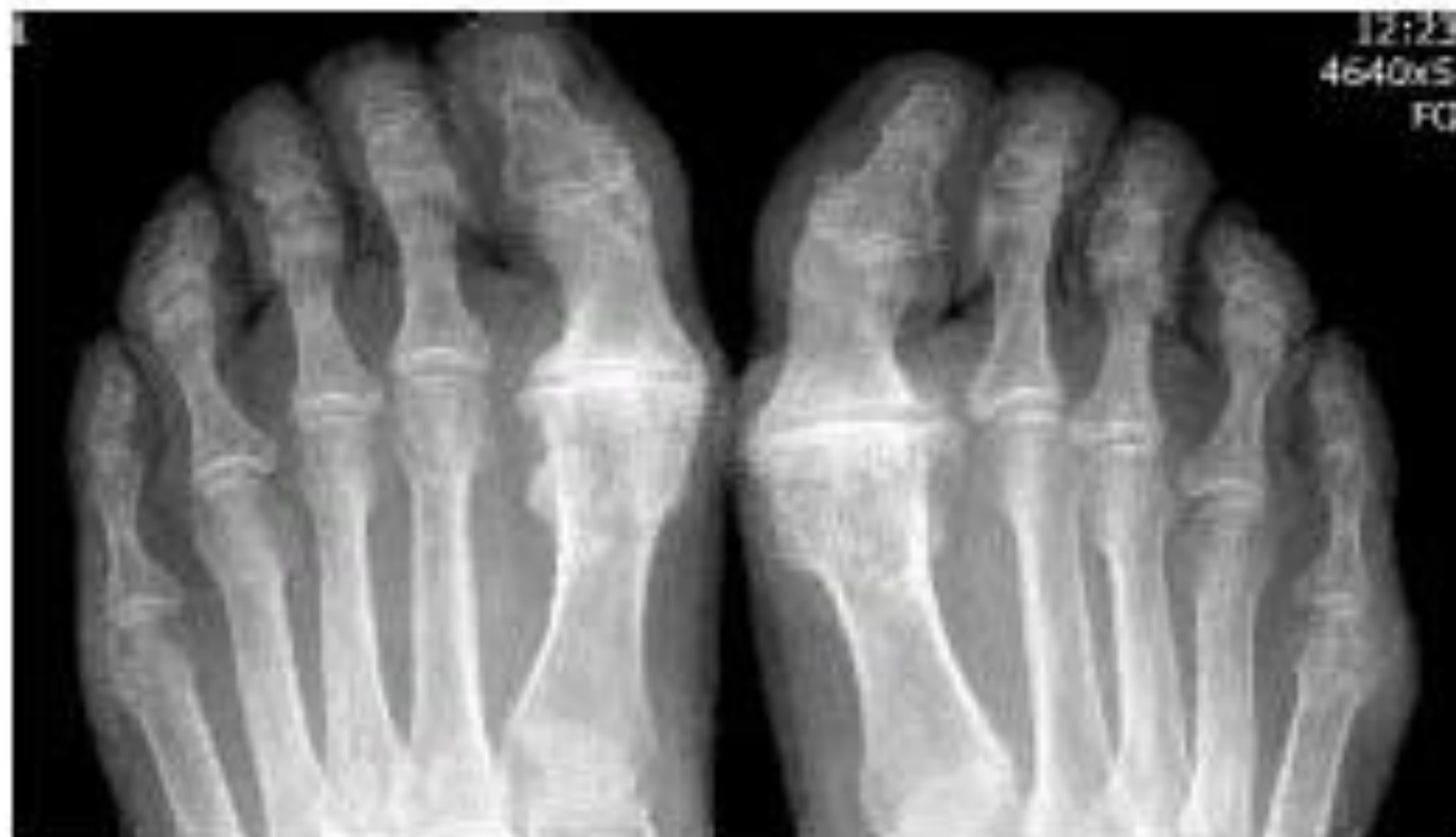
Рис. 4. Больной 3. РА 2-й стадии (неэрозивная форма). Обзорная рентгенография дистальных отделов стоп. Выраженный распространенный остеопороз. Множественные кистовидные просветления костной ткани в 1-х межфаланговых и 5-х плюсне-фаланговых (ПлФ) суставах. Незначительно сужены щели отдельных ПлФ суставов. Эрозий, вывихов и подвывихов суставов, деформаций костей во 2-5-х ПлФ суставах не выявляется. Выраженный артроз 1-х ПлФ суставов