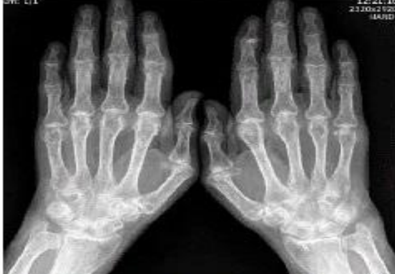
Рис. 3. Больной 3. РА 2-й стадии (неэрозивная форма). Обзорная рентгенография кистей. Выраженный распространенный остеопороз. Множественные кистовидные просветления костной ткани. Сужены щели большинства суставов. Неровность контуров и небольшие деформации отдельных эпифизов костей. Эрозий, вывихов и подвывихов суставов не выявляется. Небольшие остеофиты на краях суставных поверхностей костей в дистальных и проксимальных межфаланговых (ПМФ) суставах (симптомы узелковой формы остеоартроза)