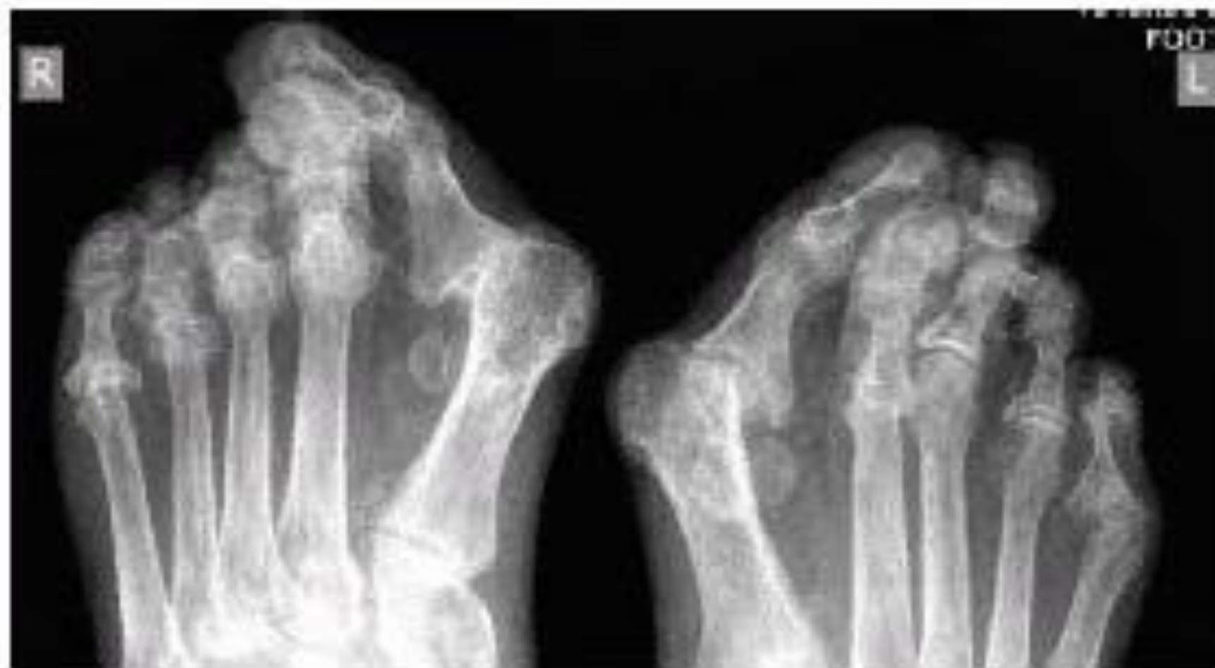
Рис. 8. Больная М. РА 3-й стадии.

Обзорная рентгенография дистальных отделов стоп. Выраженный распространенный остеопороз. Множественные кистовидные просветления костной ткани. Сужены щели многих суставов.