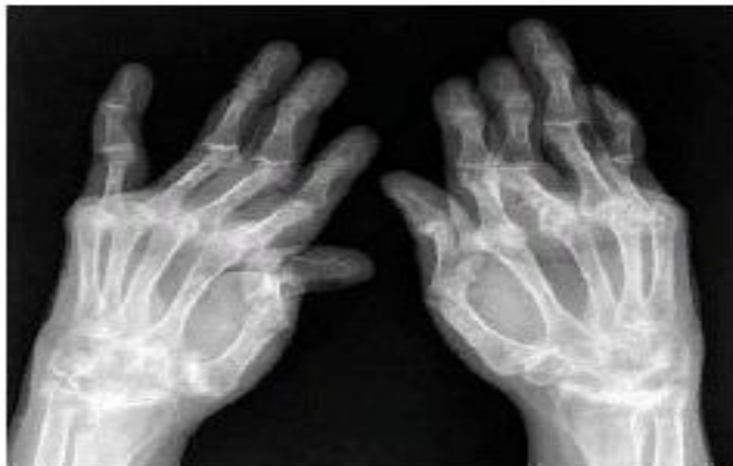
Рис. 11. РА 4-й стадии.

Обзорная рентгенография кистей. Выраженный распространенный остеопороз. Множественные кистовидные просветления костной ткани. Сужены щели всех суставов. Множественные эрозии костей и суставных поверхностей. Множественные вывихи и подвывихи суставов. Выраженные деформации эпифизов костей. Костные анкилозы суставов запястий. Сгибательные и разгибательные контрактуры суставов