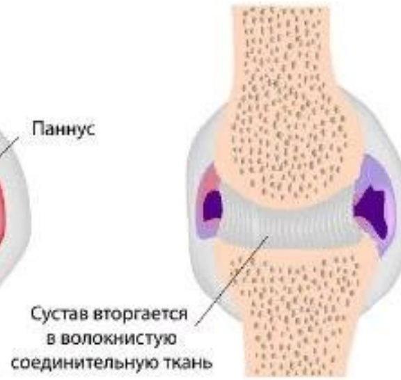
3. Волокнистый анкилоз