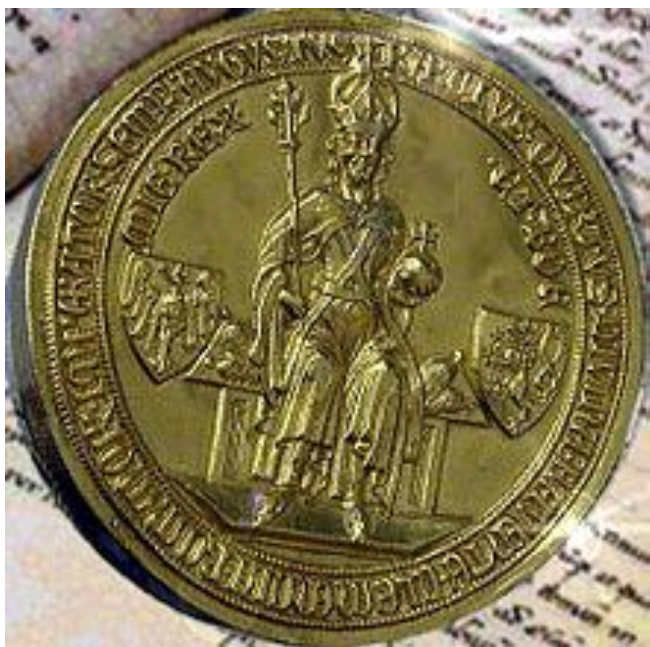
Золотая булла императора Карла IV