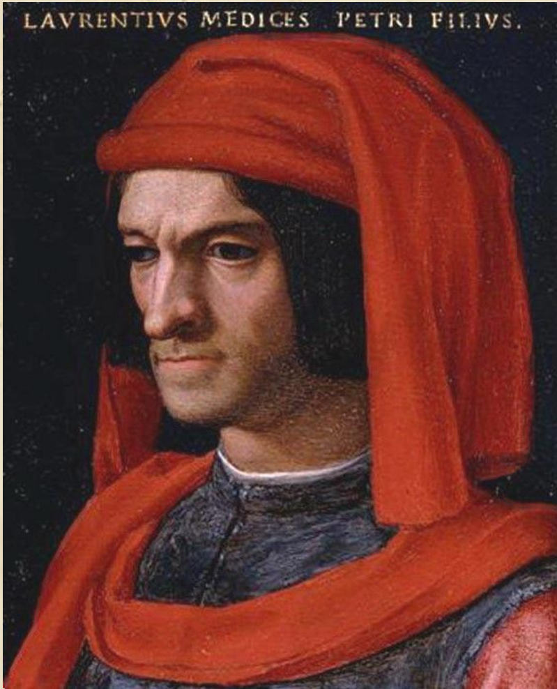
Лоренцо Медичи (1469-1492)

В XV ВЕКЕ В НЕКОТОРЫХ ГОРОДАХ УСТАНОВИЛАСЬ ВЛАСТЬ ЕДИНОЛИЧНЫХ ПРАВИТЕЛЕЙ – ТИРАНОВ