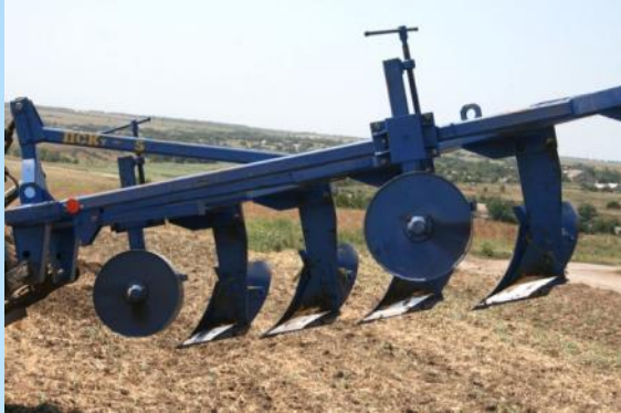
Плуг перекапывает землю, как множество мощных лопат