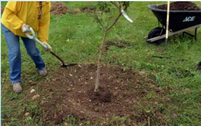
Высаживание молодых деревьев

В саду надо осуществлять следующие работы