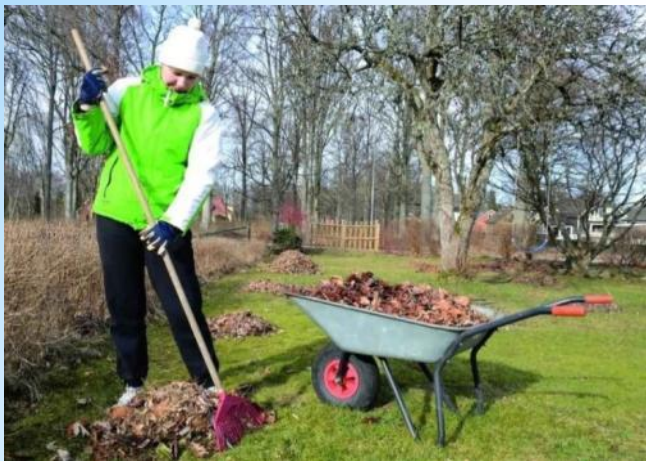
Уборка прошлогодней листвы