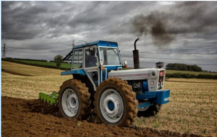
Трактор главный работник на поле. К нему прицепляют и плуг, и борону и сеялку. Управляет трактором тракторист

Цель: расширение лексического запаса за счет слов: плуг, борона, сеялка