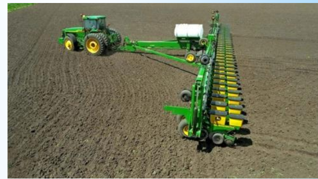
Сеялка равномерно разбрасывает семена по полю