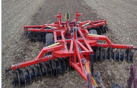
Борона делает землю мягкой, разбивает крупные куски