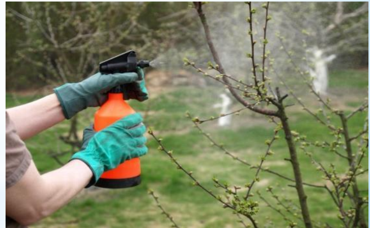
Опрыскивание от вредителей