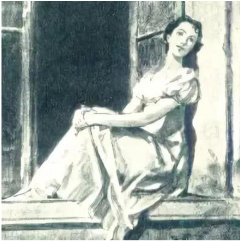
Наташа Ростова в ночи Отрадного