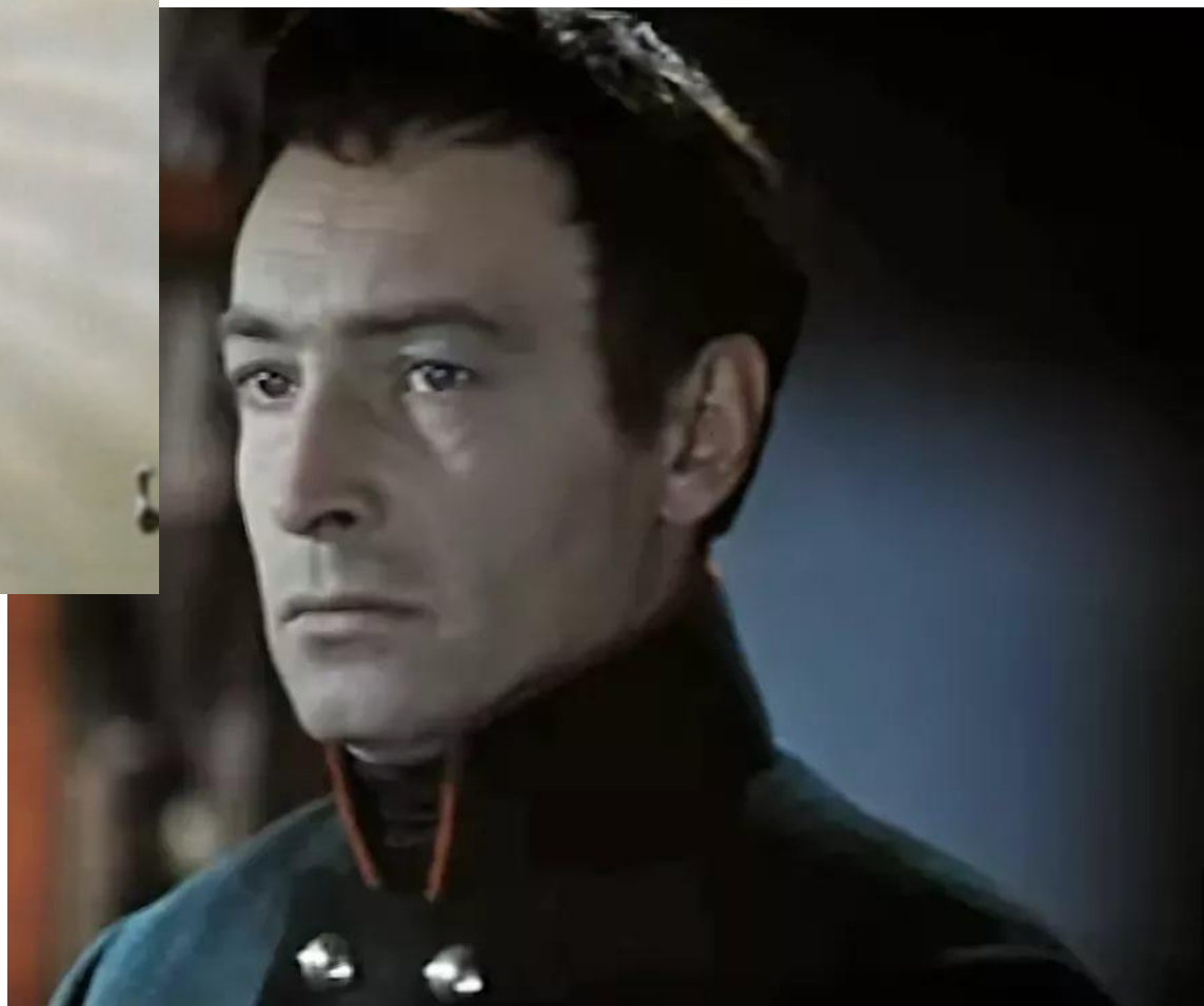
Наташа Ростова и Андрей Болконский в Отрадном