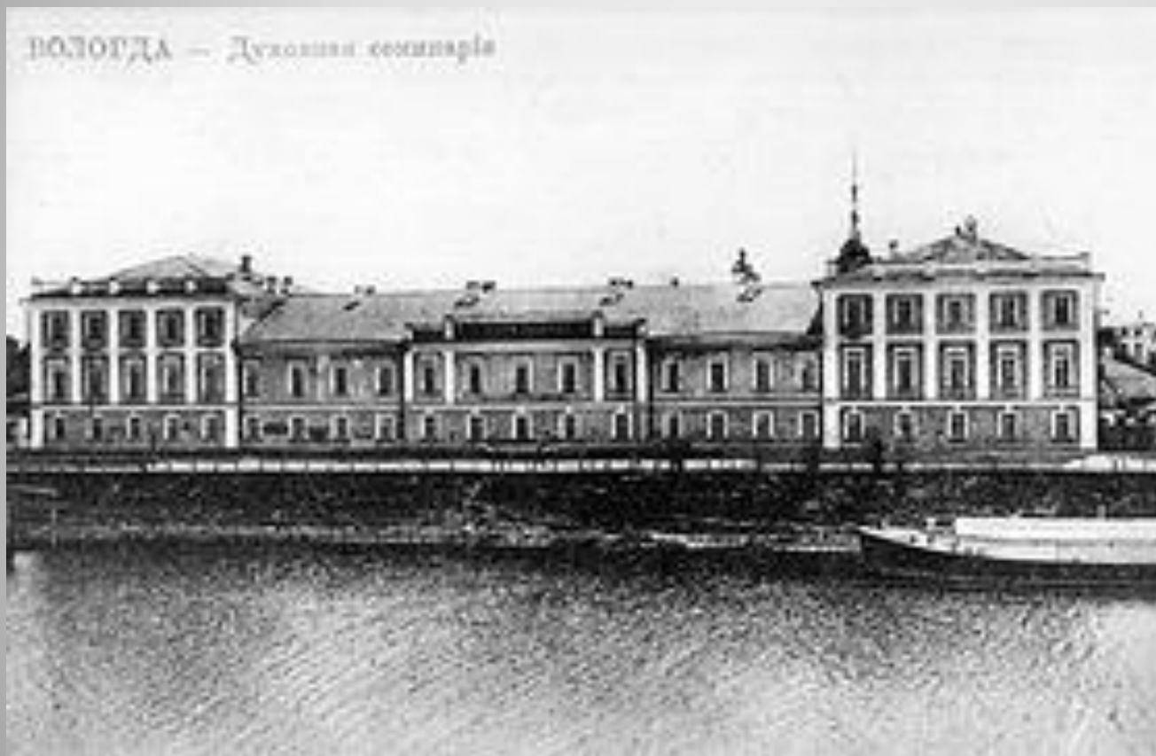
Вологодская духовная семинария