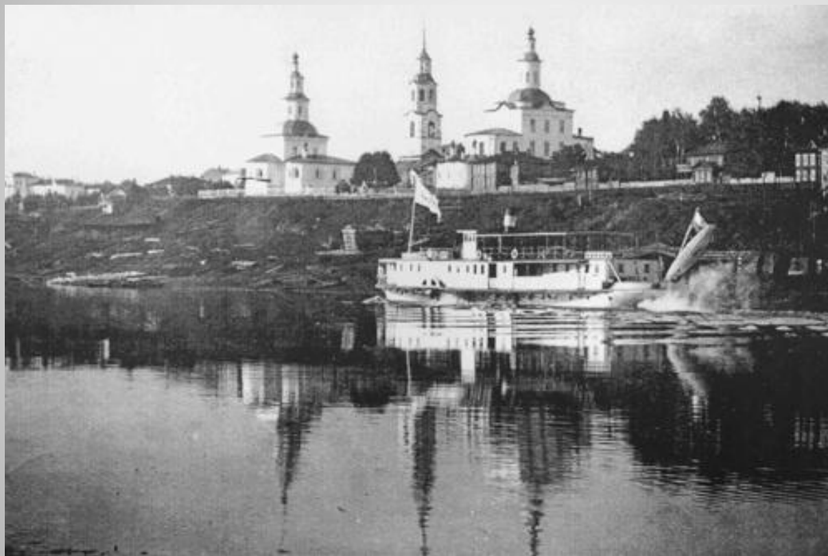
Общий вид города Усть-Сысольск со стороны реки Сысола.