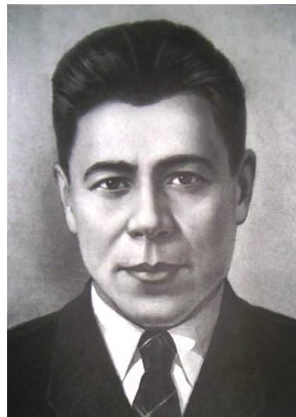
Фатих Кәрим (1909 – 1945)

Үләм икән, үкенечле түгел Бу үлемнең миңа килүе, Бәек жыр ул – Бәек Ватан өчен Сугыш кырларында үлүе.