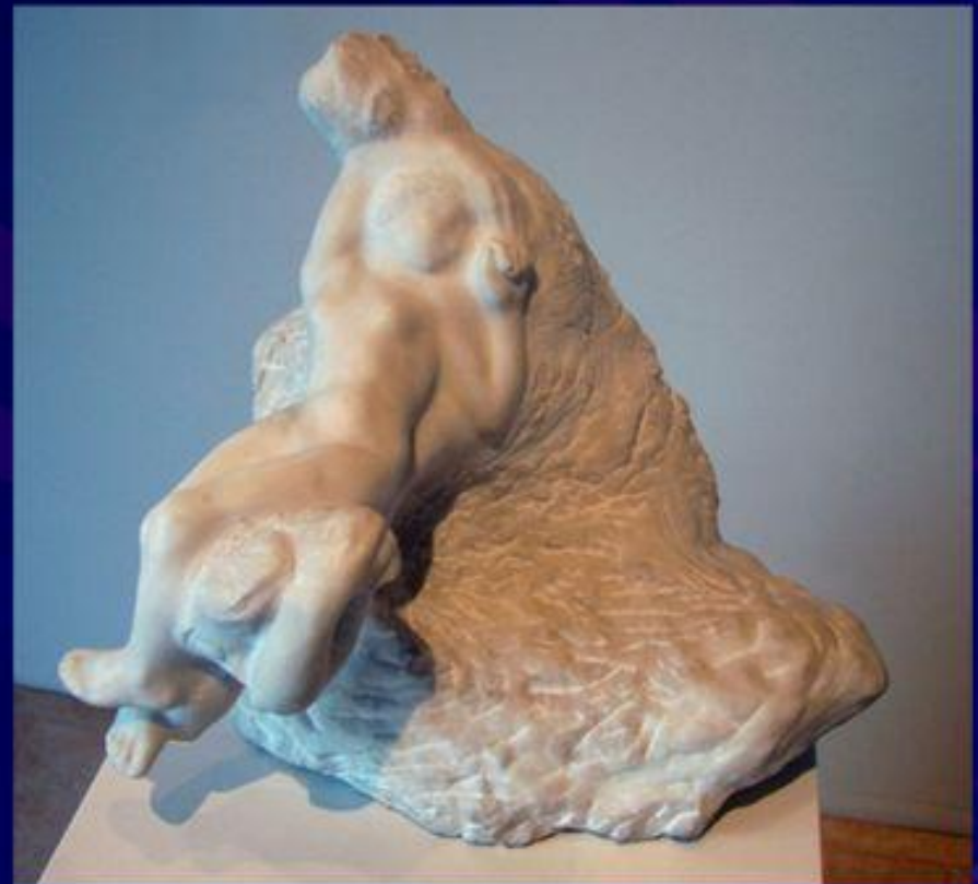
Огюст Роден (Амур и Психея) Shared