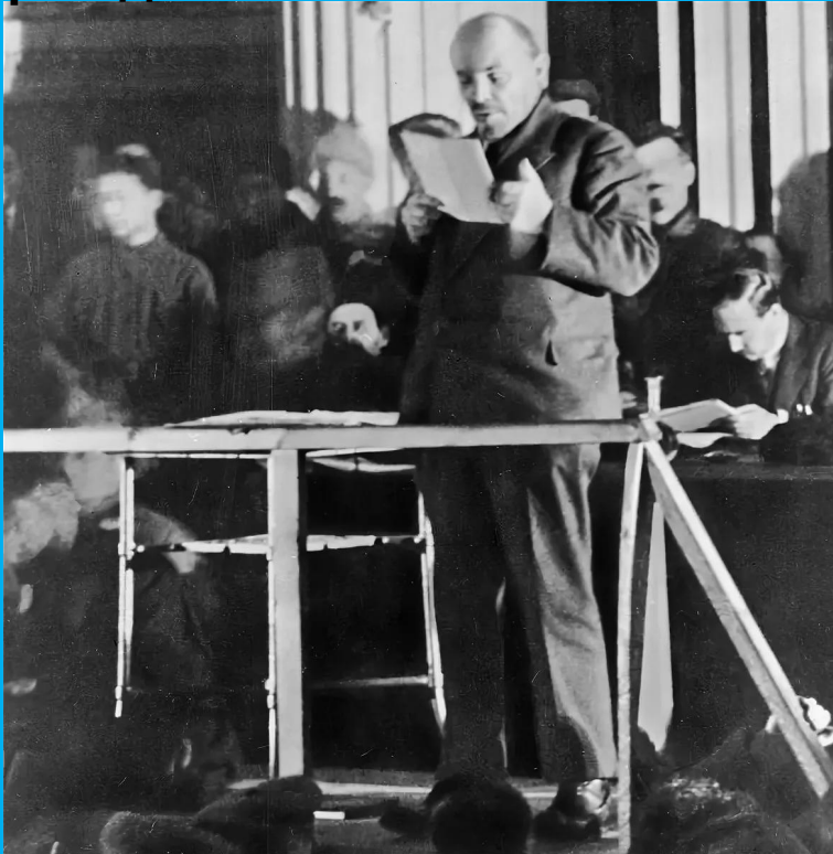
X съезд РКП(б) (март 1921 г.).

Новая экономическая политика (НЭП) – система экономических мер, призванных стимулировать рост сельского хозяйства и промышленности путём возврата элементов рыночной экономики и товарно-денежных отношений.