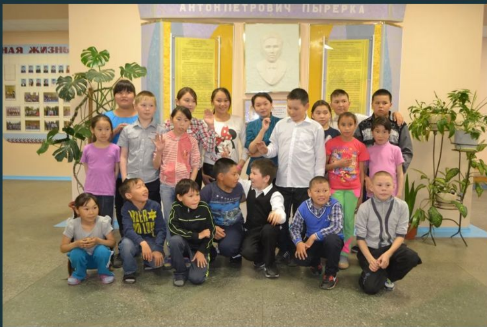
Школа-интернате им. А.П. Пырерки