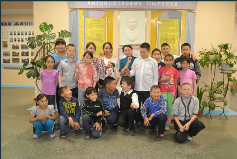
Школа-интернате им. А.П. Пырерки