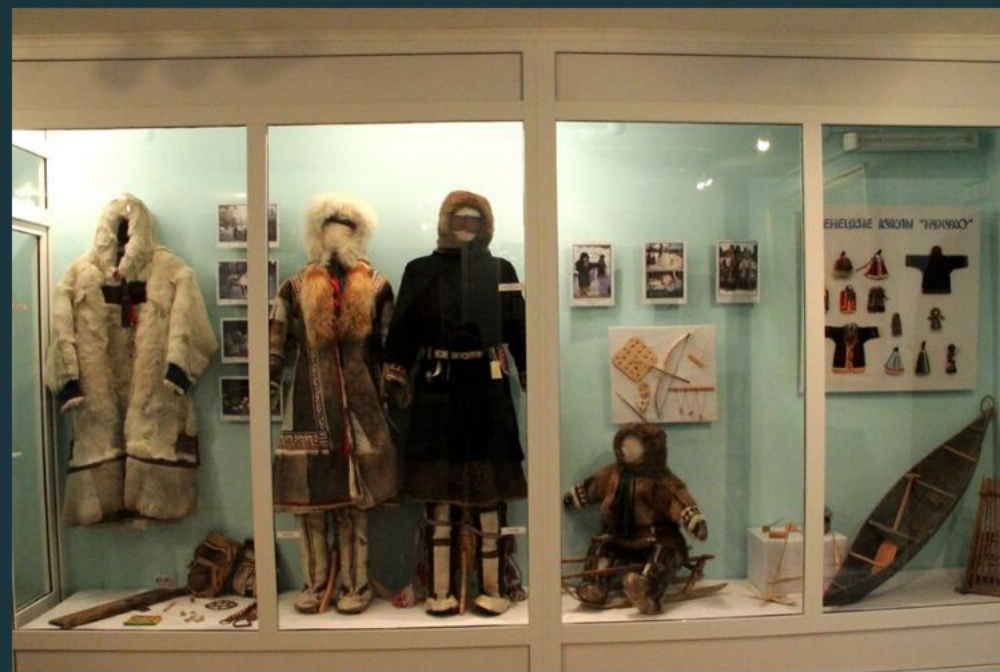
Пуровский районный краеведческий музей