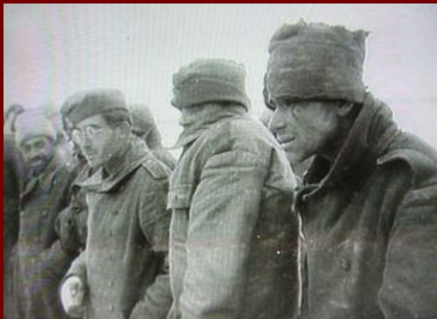
Немецкие солдаты захваченные в плен в районе Сталинграда