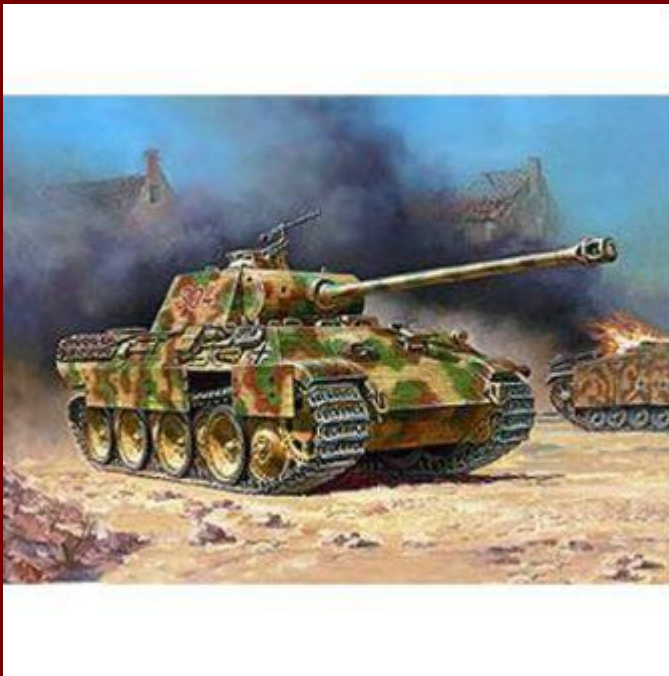
Немецкий танк Т-V "Пантера".