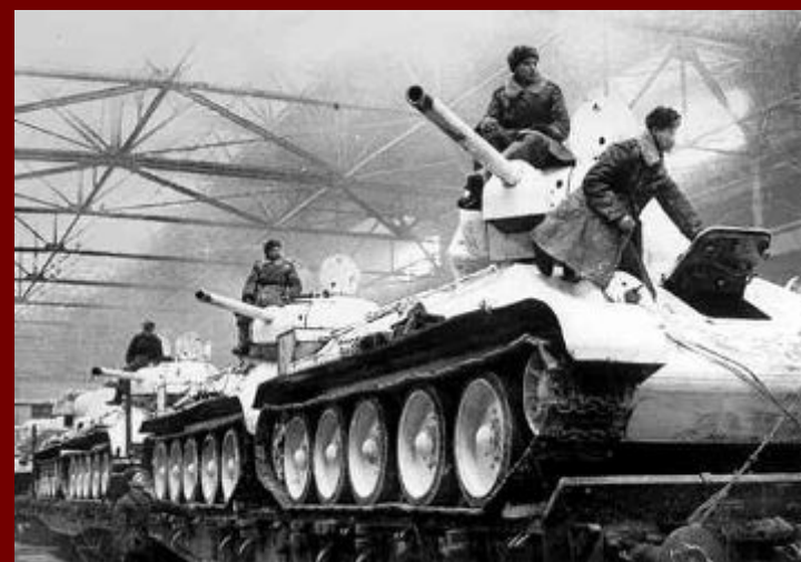
Танки Т-34 перед отправкой на фронт