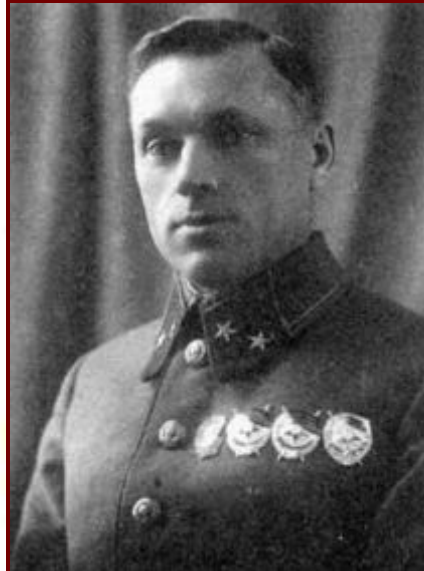
Генерал К.К. Рокоссовский.