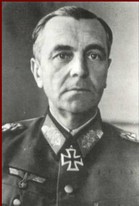
Фридрих Паулюс – германский генерал- фельдмаршал.