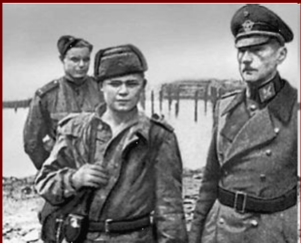
Фельдмаршал Ф. Паулюс взят в плен красноармейцами.