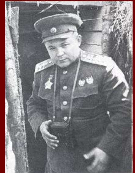
Генерал Н. Ф. Ватутин