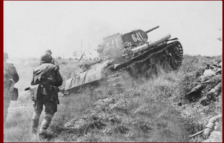
Июль 43-го. Курская дуга.