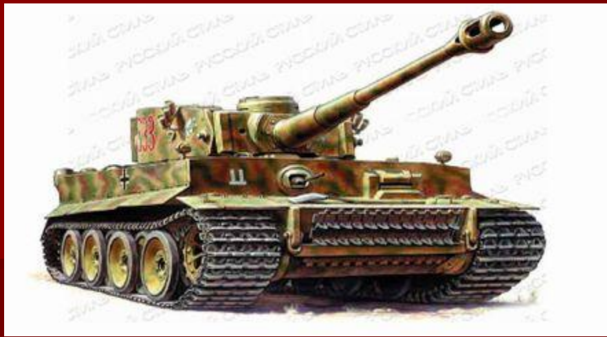
Немецкий тяжелый танк Тигр.