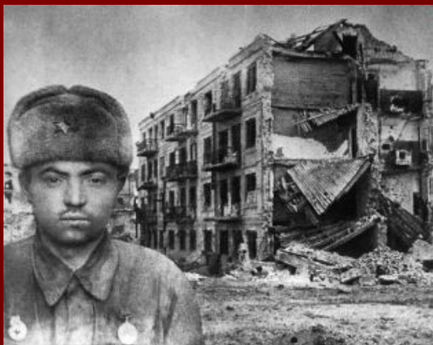
Сержант Яков Павлов и его знаменитый дом в центре Сталинграда.