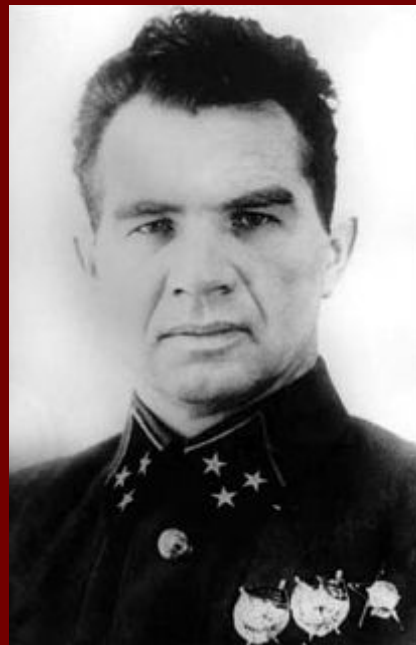
Чуйков Василий Иванович