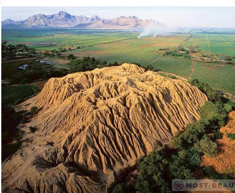
Пирамиды Тукуме. Перу.

В живописной долине расположились каменные пирамиды. Поражает количество этих своеобразных сооружений – около 250. Самая уникальная из них, пирамида Уака-Ларга, длина которой у основания 700 метров.