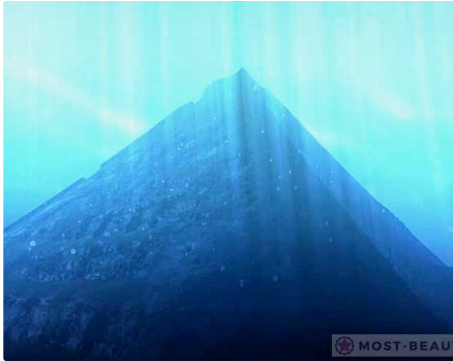
Пирамиды озера Фусянь. Китай

В 2001 году на дне озера Фусянь была обнаружена крупная и удивительная пирамида, построенная из мощных плит, весом более тонны каждая. Странно, но в пирамиду нет ни одного входа, и с какой целью и когда она построена еще предстоит разгадать. Одно известно, огромная пирамида высотой 19 метров и длиной у основания 90 метров расположена в центре города, который оказался погребен водами озера.