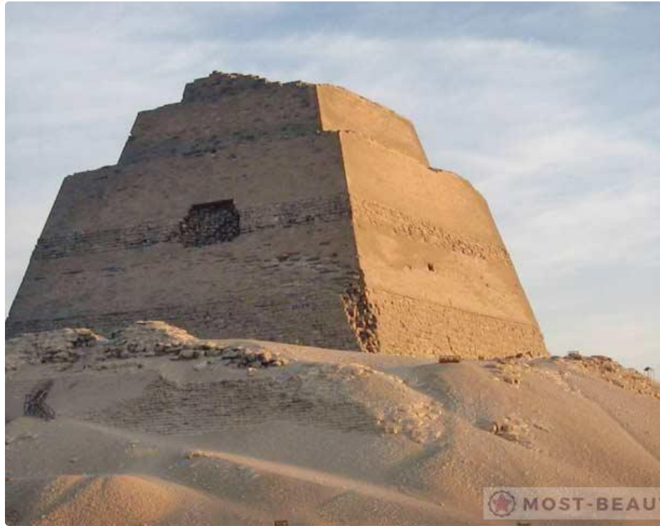
Пирамида Снофру. Египет

используемых при строительстве объекта, придавал ей романтический, розоватый оттенок. Одна из красивейших пирамид в мире, была построена в XXVI веке до н. э.