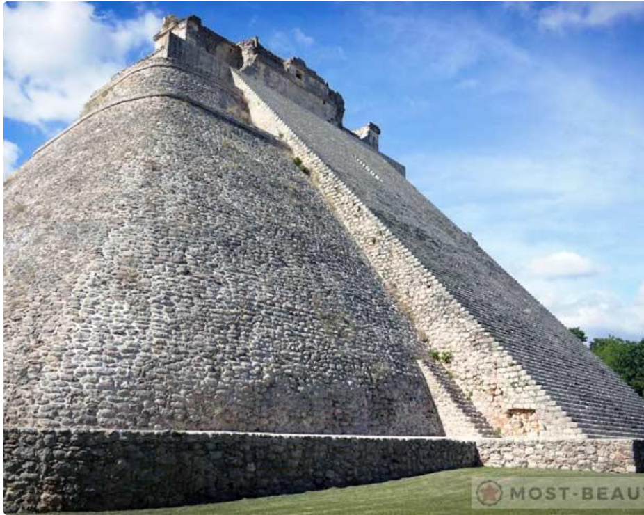
Пирамида Волшебника. Мексика.

В городе Ушмаль находится пирамида, выбивающаяся своей конструкцией из ряда других подобных объектов мира. Основание постройки имеет форму эллипса. До наших дней дошла легенда, в которой объясняется название пирамиды. Майя верили, что маг, волшебник построил это необычное и красивое сооружение за одну ночь.