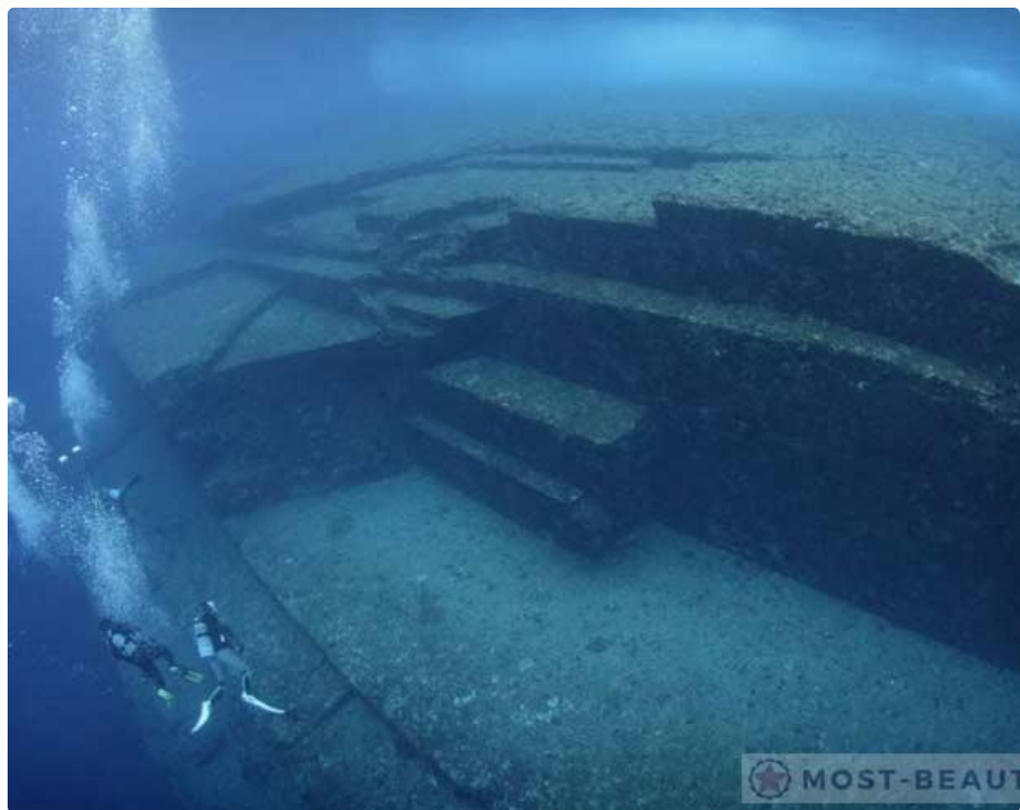
Монумент Йонагуни. Япония

Находящиеся под водой монументальные плиты являются предметом спора, естественное или рукотворное происхождение имеет это образование. Сторонники того, что это дело рук человека, приводят примеры существования подобных сооружений в других частях мира и то, что с другой стороны острова под водой обнаружены подобие дорог и стен. Чем бы ни являлась красивая подводная плита у японского острова Йонагуни, она уже привлекла к себе внимание всего мира.