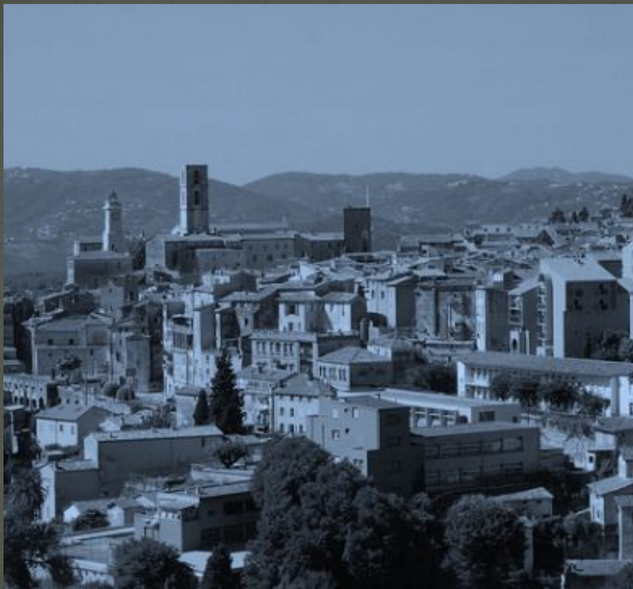
Грасс, город парфюмеров