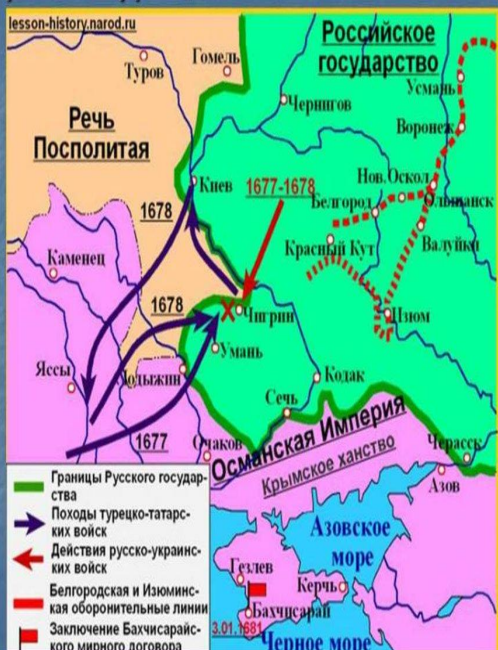
Русско-турецкая война 1676-1681 г.

Опасаясь наступления Турции и подвластного ей Крымского ханства, Россия попыталась укрепить свои позиции на Украине. В 1676 г. русские войска захватили бывшую столицу Богдана Хмельницкого Чигирин и вынудили гетмана Дорошенко сложить власть. Считая Правобережную Украину своей, турецкий султан направил на освобождение Чигирина большое войско, к которому добавилась также крымская конница. Прошло почти два года, прежде чем объединённым силам турок и крымцев удалось вновь занять казачью столицу.