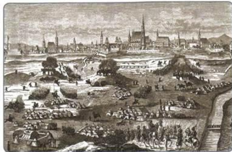
Осада Вены турками в 1683 году

Воспользовавшись заключением Бахчисарайского мира , Турция собрала все силы для удара по Священной Римской империи . В 1682 г. она объявила ей войну. Огромная многонациональная армия Османской империи летом 1683 г. осадила фактическую столицу империи — Вену . Защитить Вену лишь собственными силами оказалось невозможно. Тогда перед лицом общей угрозы на помощь Вене выдвинулись объединённые войска Священной Римской империи , а также Речи Посполитой .. В итоге против 90-тысячной армии турок во главе с великим визирем Кара Мустафой-пашой выступило объединённое 85-тысячное войско во главе с королём Речи Посполитой Яном Собеским . Турки имели 300 пушек, а союзные силы — 152. 12 сентября 1683 г. битва под Веной закончилась победой союзных сил. Турецкая армия была разбита, потеряв всю артиллерию.