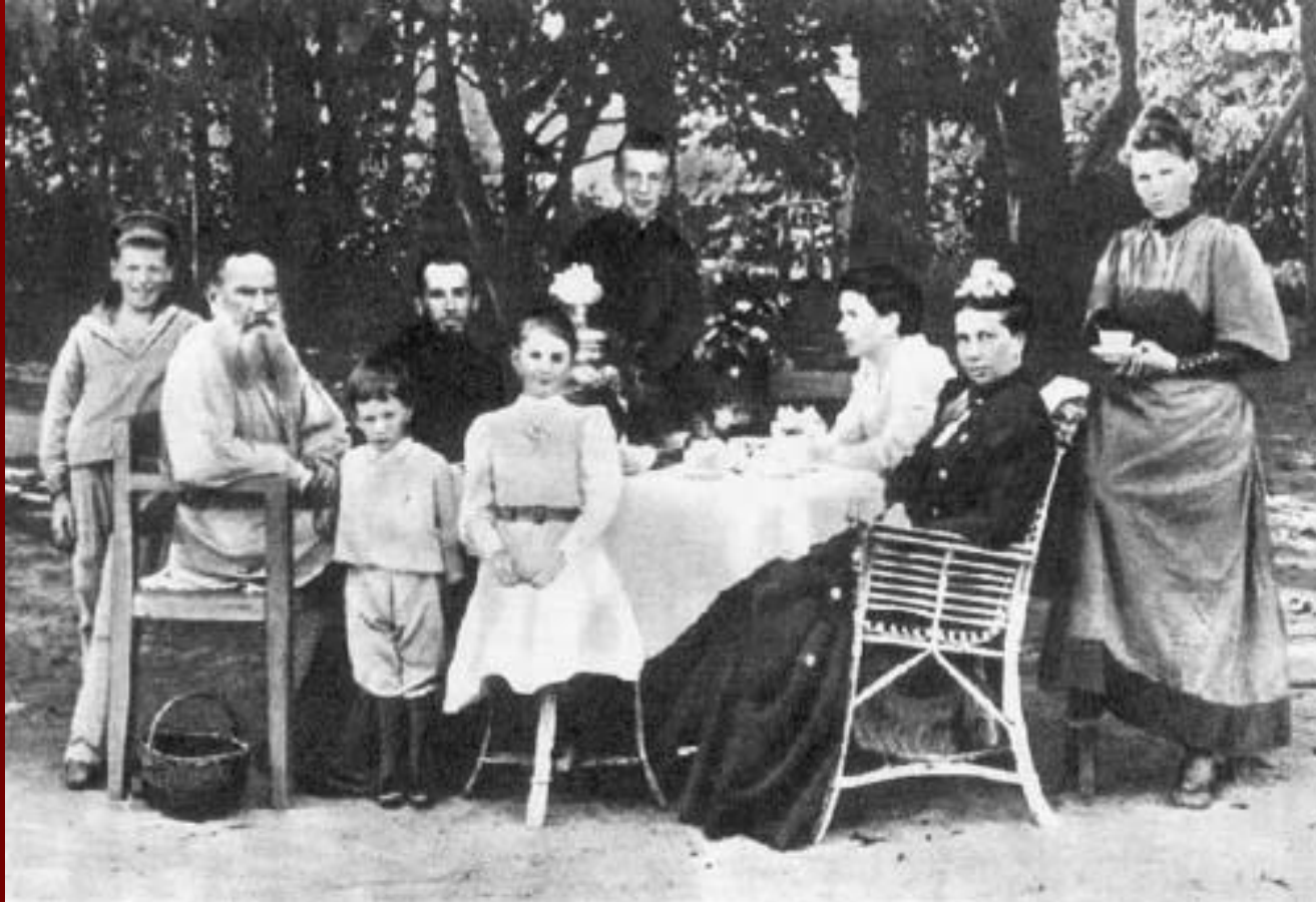
Лев Толстой с семьей. 1892 г.