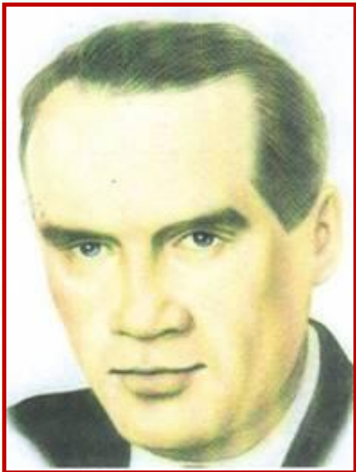
Николай Николаевич Носов