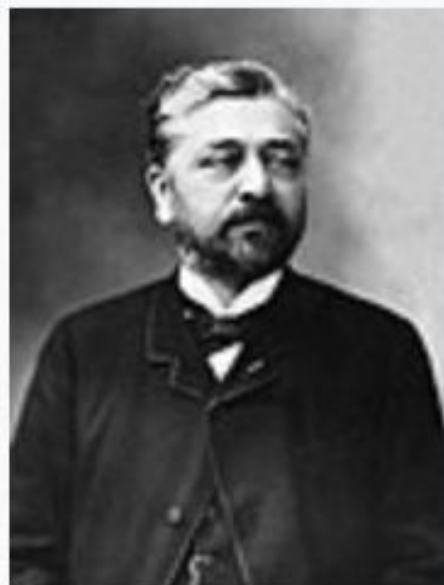
Гюстав Эйфель, фото Надара, 1888 год