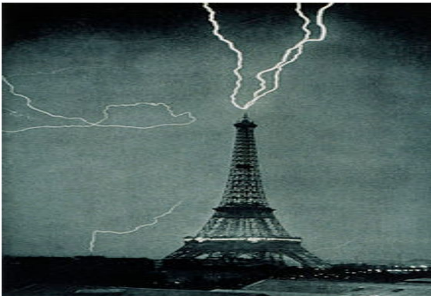
Молния бьет в Эйфелеву башню, фотография 1902 года