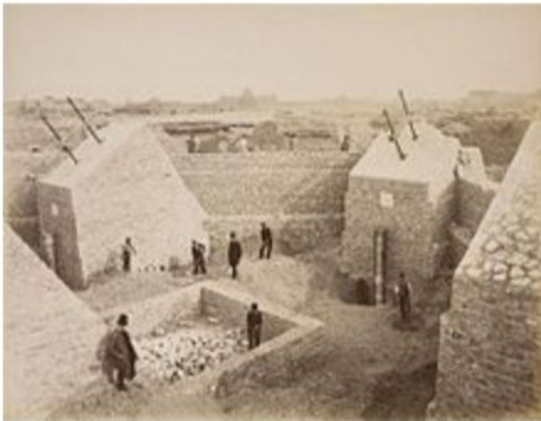
Строительство фундамента башни