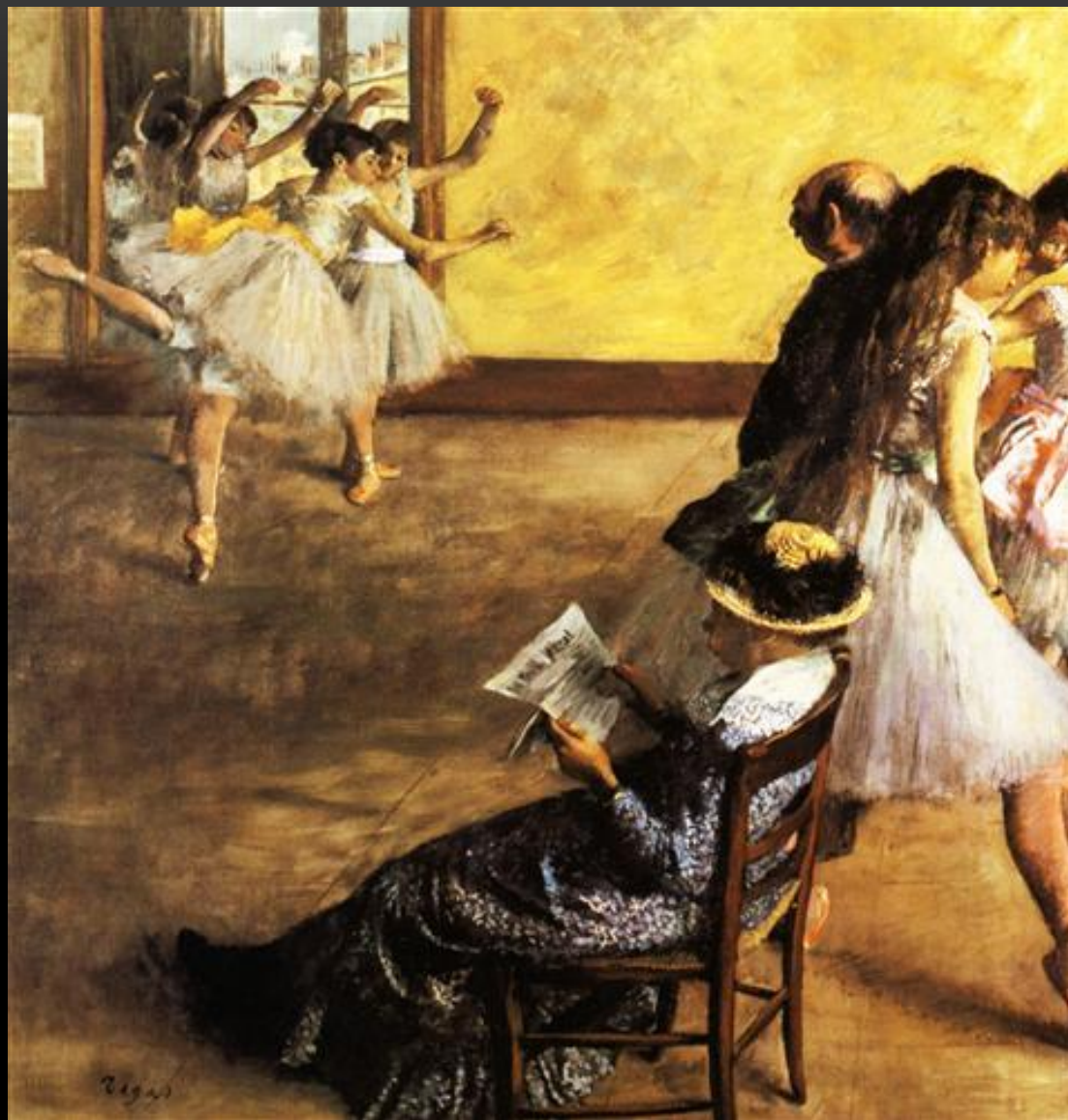
БАЛЕТНЫЙ КЛАСС 1881