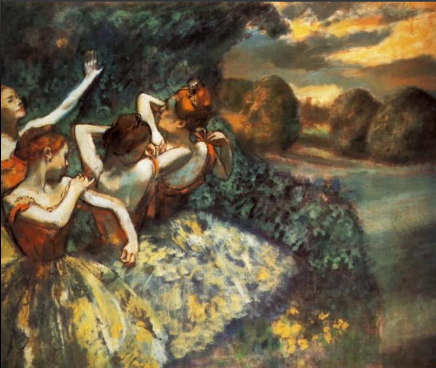
ЧЕТЫРЕ ТАНЦОВЩИЦЫ 1899