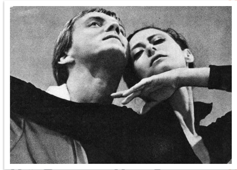
Майя Плисецкая и Марис Лиепа

Ее первый муж - Марис Лиепа, тоже был солистом театра и танцовщиком.