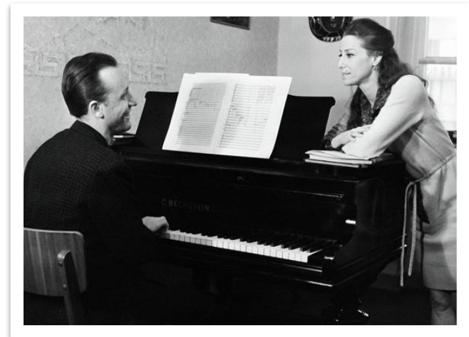
Майя Плисецкая и ее муж Родион Щедрин

Со своим вторым супругом Родионом Щедриным Майя познакомилась в гостях у Лили Брик. Плисецкая была на семь лет старше Щедрина