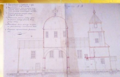
У інтэр’еры сяродкрыжжа перакрыта васьмігранным купалам на падружжых арках. У бабіны на двух суплах размешчаны хоры.