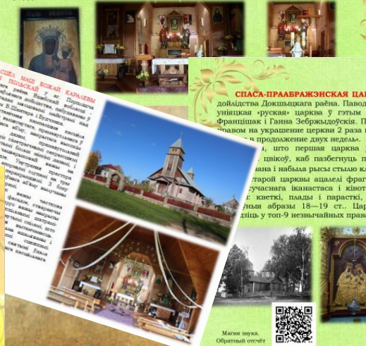
Магія згук. Обратный отсчет