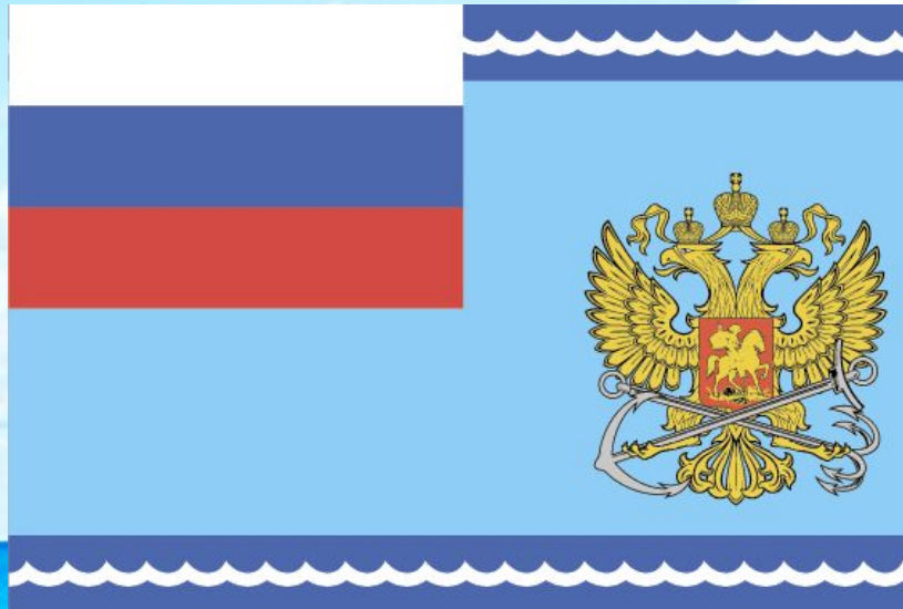
Флаг Федерального агентства морского и речного транспорта