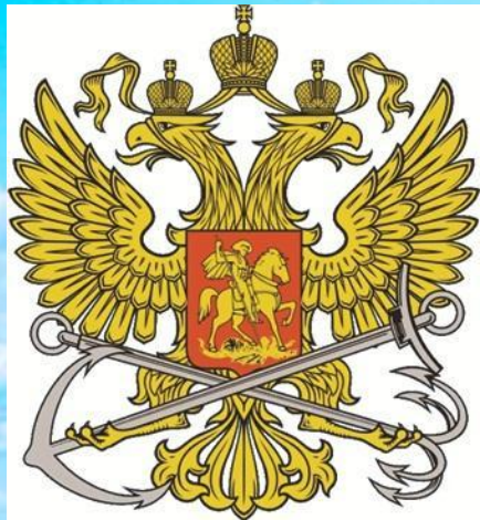
Герб Федерального агентства морского и речного транспорта

Постановлением Правительства Российской Федерации от 27 октября 2008 г. № 796 учреждены эмблема и флаг Федерального агентства морского и речного транспорта, а также вымпел руководителя Агентства.