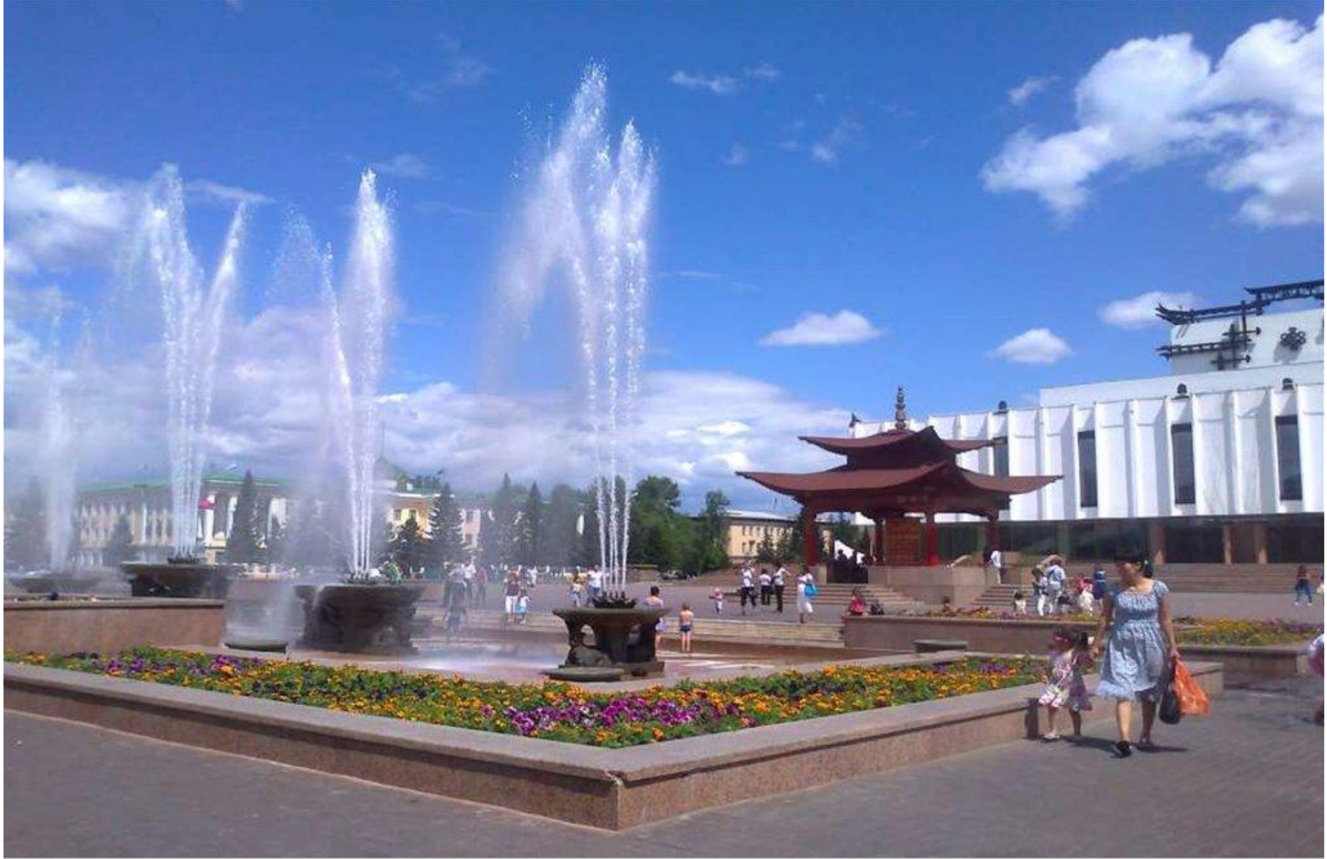
Административный центр – город Кызыл