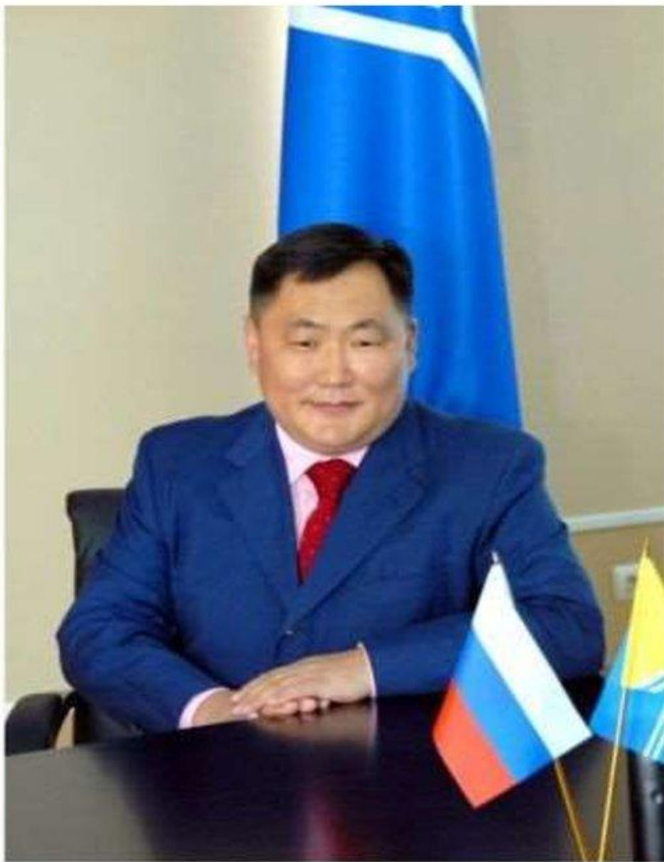
Председатель Правительства Республики Тыва Кара-оол Шолбан Валерьевич