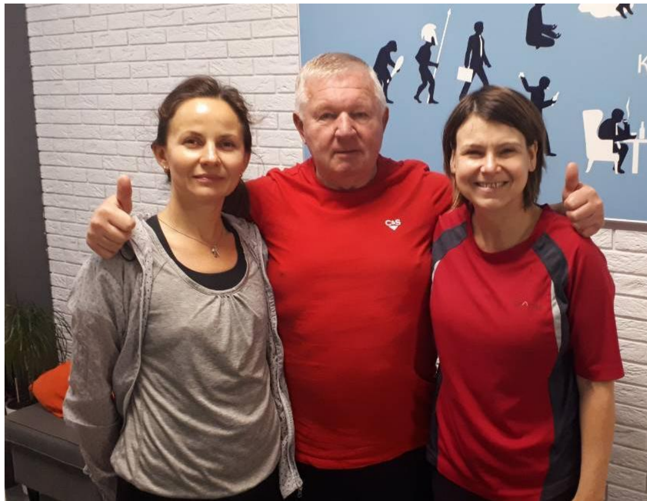
2018, ПОСОЛ ВЕЛИКОБРИТАНИИ В РБ ФИОННА ГИББ