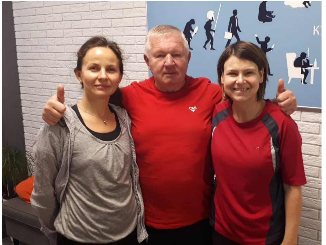
2018, ПОСОЛ ВЕЛИКОБРИТАНИИ В РБ ФИОННА ГИББ