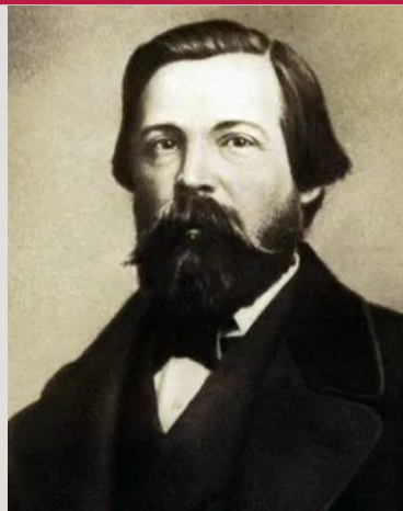
Фридрих Энгельс (1820 – 1895 г.)