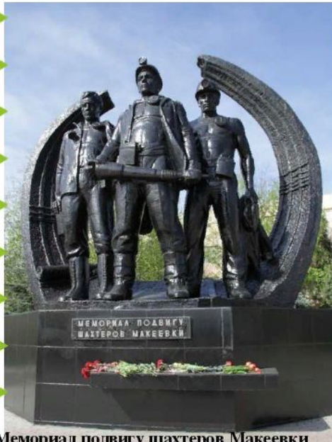
Мемориал подвигу шахтеров Макеевки